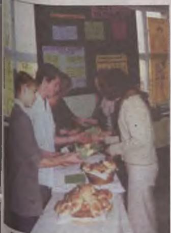
Gimnazjaliści rogaliki sprzedawali po złotówce