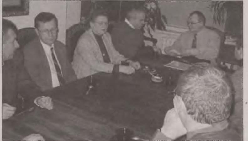
Wstawienie witraży zaplanowano na początek przyszłego roku