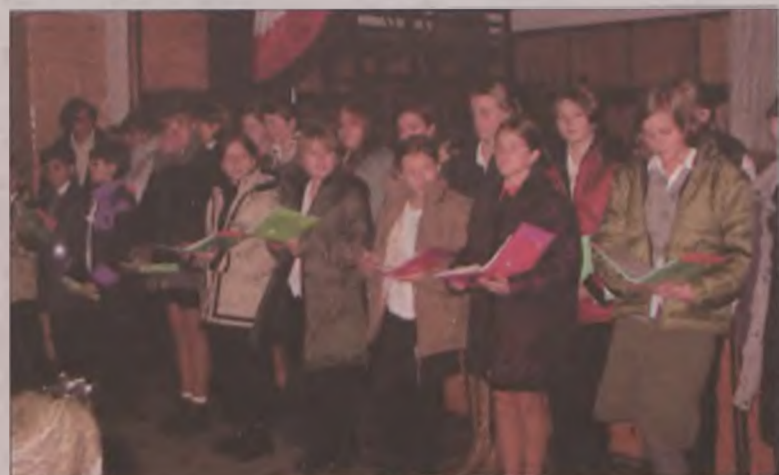
Ku pokrzepieniu serc śpiewał chór z GOK-u