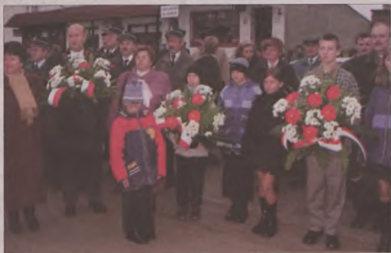
Pod tablicą pamięci złożono wiązanki kwiatów