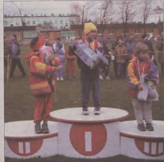
Najmłodsi na podium