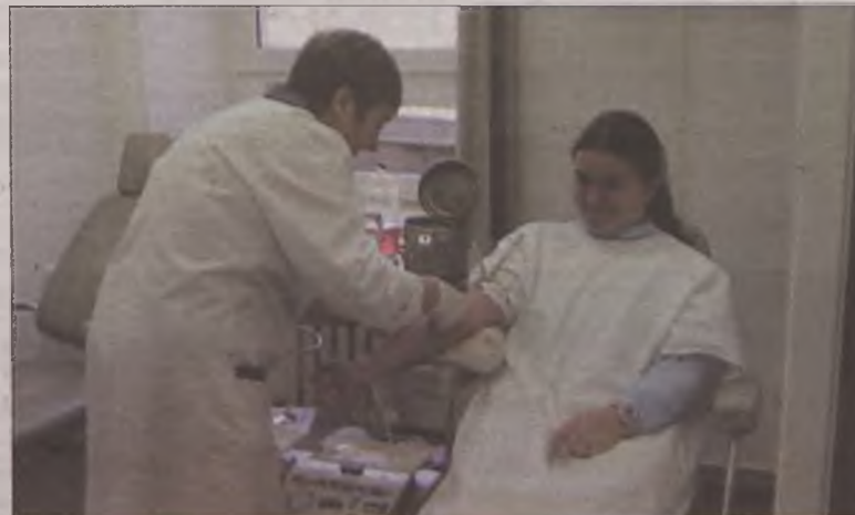
Każdy z dawców oddał ok. 450 ml krwi