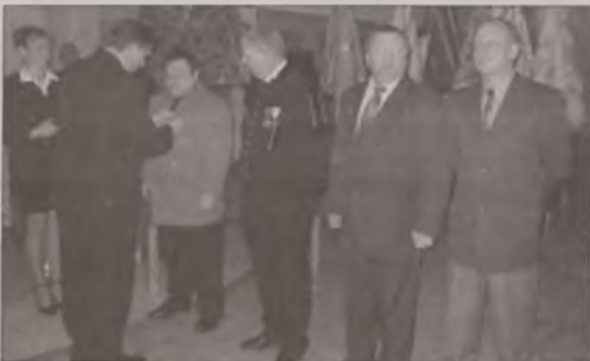
Nagrodzono około sto osób