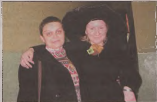
Uczestniczki sabatu czarownic