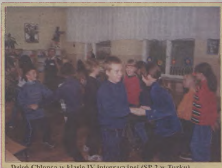
Dzień Chłopca w klasie IV integracyjnej (SP 2 w Turku)