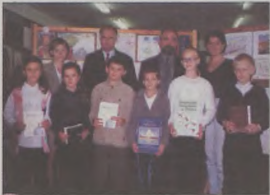
Uczestnicy konkursu z jurorami

Konkurs ekologiczny był jednym z elementów tegorocznej akcji „Sprzątania świata” w gminie Przykona. Wzięli w nim udział uczniowie trzech tamtejszych szkół podstawowych.