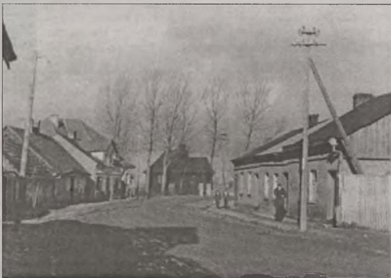
Jedno z prezentowanych na wystawie zdjęć - ulica Dekerta z widocznym w głębi kościółkiem pod wezwaniem św. Barbary.

gminy Dobra, prosi o kontakt telefoniczny pod numerem 279-90-11.