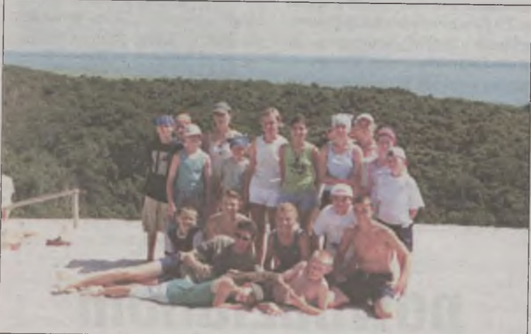
Turkowskie karateki na wydmych w Łebie

wiano wydmy w Łebie i okazały pałac w Krokowej wraz z otaczającym go parkiem. Upalna pogoda sprzyjała morskim kąpielom i plażowaniu. Dodatkovymi atrakcjami były liczne konkursy, dyskoteki oraz tradycyjny chrzest obozowy. W nowym roku szkoleniowym, który rozpocznie się pierwszego września, Turkowski Klub Karate