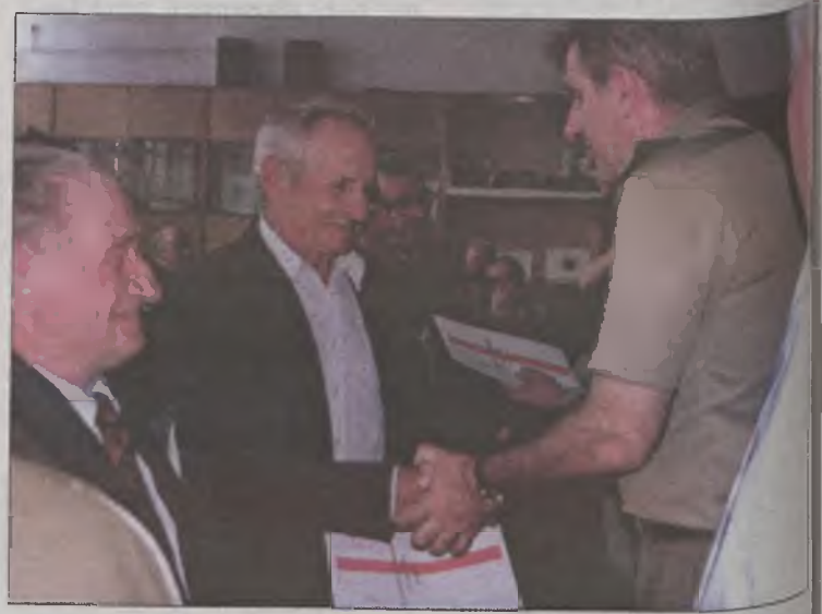
czek do munduru, że uczyliście tego, aby młodsze pokolenia równie godnie wypełniały obowiązki wobec ojczyzny.