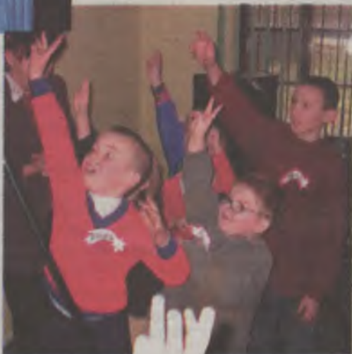
Chętnych aż rwali się do odpowiedzi na pytania konkursowe.