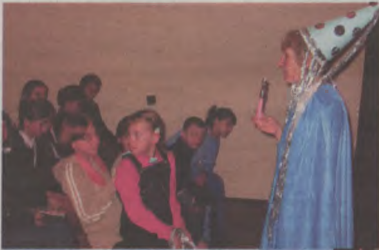
Z dziećmi spotkała się dobra wróżka.

Imprezę mikołajkową dla ponad stu dzieci w wieku od 7 do 13 lat z najuboższych rodzin w gminie Tuliszków, w tym dla kilku dzieci niepełnosprawnych, zorganizowały członkinie Forum Równych Szans i Praw Kobiet w Tuliszkwie. W dniu imienin św. Mikołaja dzieci zebrały się w Miejsko-Gminnym Ośrodku Kultury, gdzie przygotowano dla nich wiele atrakcji. Mikołajkowi goście obejrzyli teatrzyk w wykonaniu dzieci z M-GOK i SP Smaszew. Były zabawy i konkursy z nagrodami oraz poczęstunek