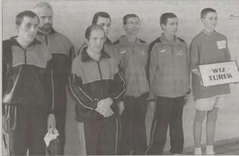
Drużyna Warsztatów Terapii Zajęciowej w Turku