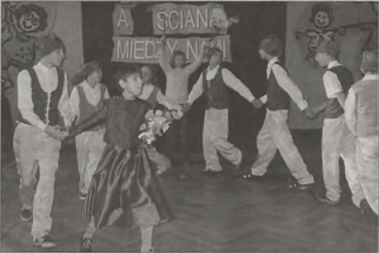
Królowa Śnieżka i krasnoludki

kę szkolną oraz Pielęgniarskie Centrum Medycyny Szkolnej „Żak”. Do udziału w konkursie