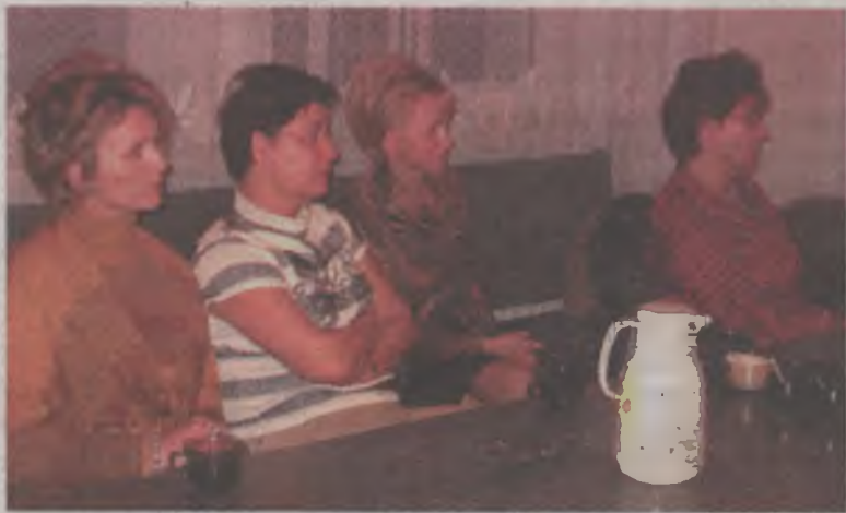
Nikt z lekarzy rodzinnych w powiecie tureckim nie złożył swojej oferty do Narodowego Funduszu Zdrowia. Lekarze z naszego powiatu uważają zaproponowane im warunki jako nie do zaakceptowania.

Tymczasem w atmosferze powszechnej krytyki warunków kontraktów proponowanych przez NFZ system Łapińskiego wali się w gruzy. Na czele buntu stanęli lekarze rodinni. Powstało tzw. Porozumienie Zielonogórskie, nieformalne stowarzyszenie lekarzy rodzinnych z