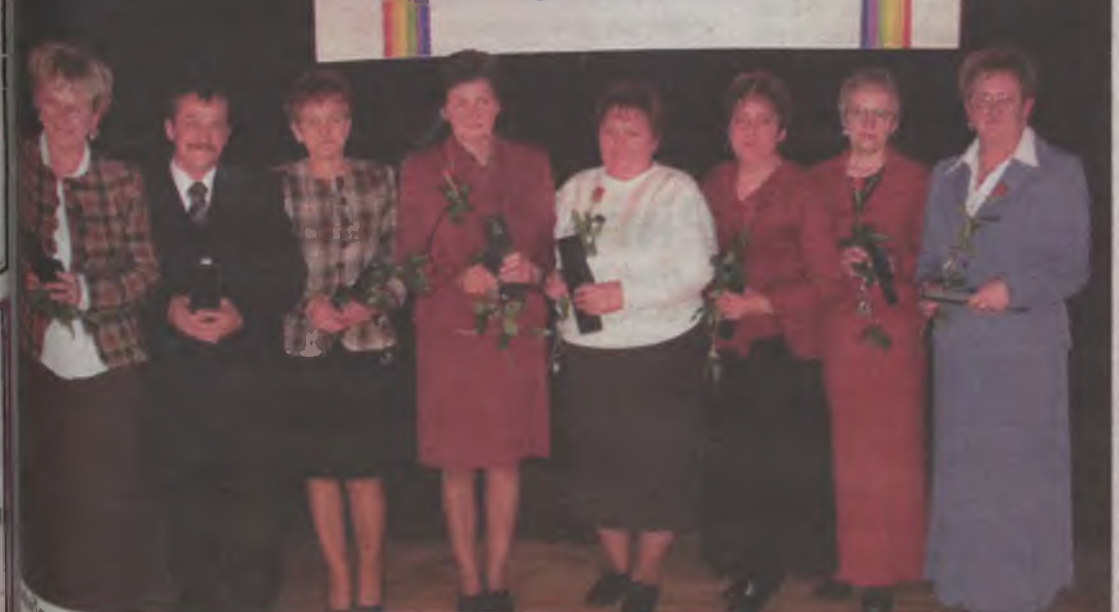
Jubileusz był okazją do odznaczenia ponad 70 spółdzielców