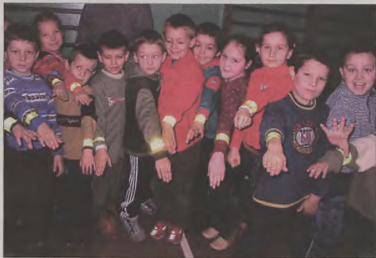
Pierwszaki z Władysławowa prezentują świecące opaski.

Opaski funkcjonariusze ruchu drogowego rozdawać też będą dzieciom w szkołach podczas prowadzonych w nimi pogadanek prewencyjnych na temat bezpieczeństwa na drodze. AZ