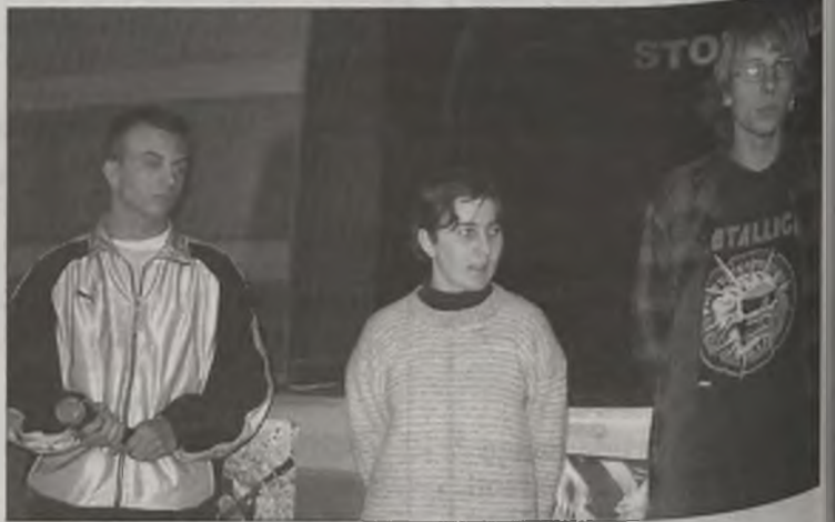
Zwycięzcy quizu o AIDS

W drugiej części programu zaprezentowany został spektakl teatralny zatytułowany „Porozmawiajmy o AIDS”, który przygotowali aktorzy z Krakowa. Miał on uświadomić młodzieży, jak wiele niebezpieczeństwa kryją w sobie wszelkie używki, poprzez które niedaleka droga do zakażenia groźnym wirusem HIV. MJ