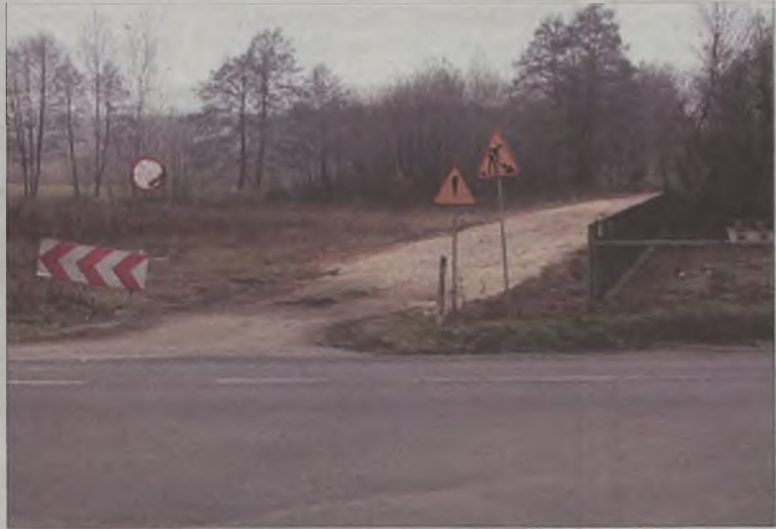
Przyłączenia drogi gminnej do wojewódzkiej domaga się część mieszkańców Obrębizny i Szadowa Pańskiego.

– Żeby to była jakaś nowa droga. Ale ona istnieje już od kilkadziesiąt lat i ciągle ktoś wjeżdża, wyjeżdża i do tej pory nie było z tym problemów. Jak tylko nam zaczęli robić asfalt, to od razu jest źle i nie wolną tędy dojeżdżać do Obwodnicy, bo to niebezpieczne – komentują mieszkańcy. AZ