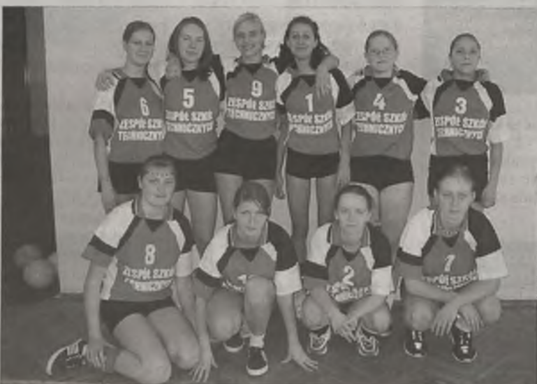
Zwycięska drużyna ZST Turek