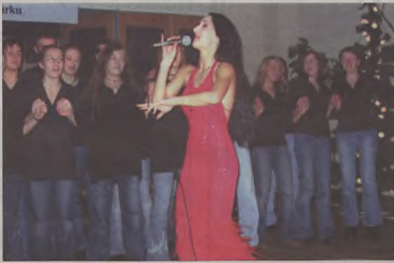
Podczas pierwszego balu na rzecz Domu Dziecka śpiewała Justyna Steczkowska

Wstęp na koncert - 200 złotych od osoby. Bilety w sprzedaży w Urzędzie Gminy Turek, ul. Konińska 2. Właścicielka: Justyna Steczkowska.