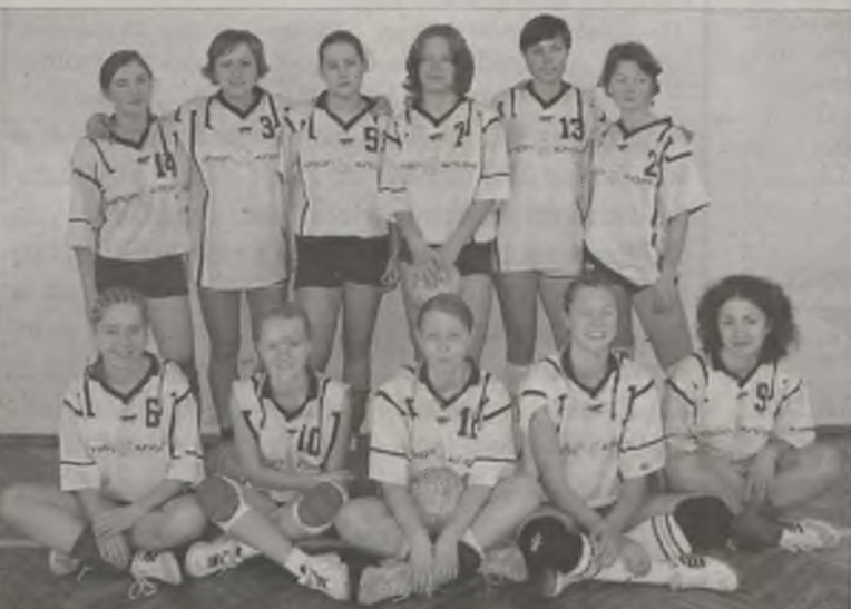
Siatkarki z Liceum