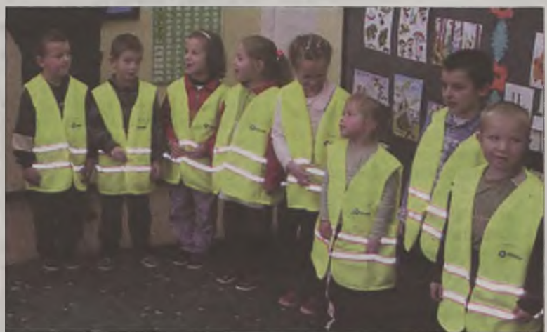
Pierwsze kamizelki otrzymały dzieciaki z Chylina

Pierwsi kamizelki dostali najmłodsi ze Szkoły Podstawowej w Chylinie, czyli dzieci z „zerówki”. Uczniowie pozostałych szkół otrzymają je w tym tygodniu. W podobne kamizelki gmina władysławów zaopatrzy również funkcjonariuszy miejscowego posterunku policji.