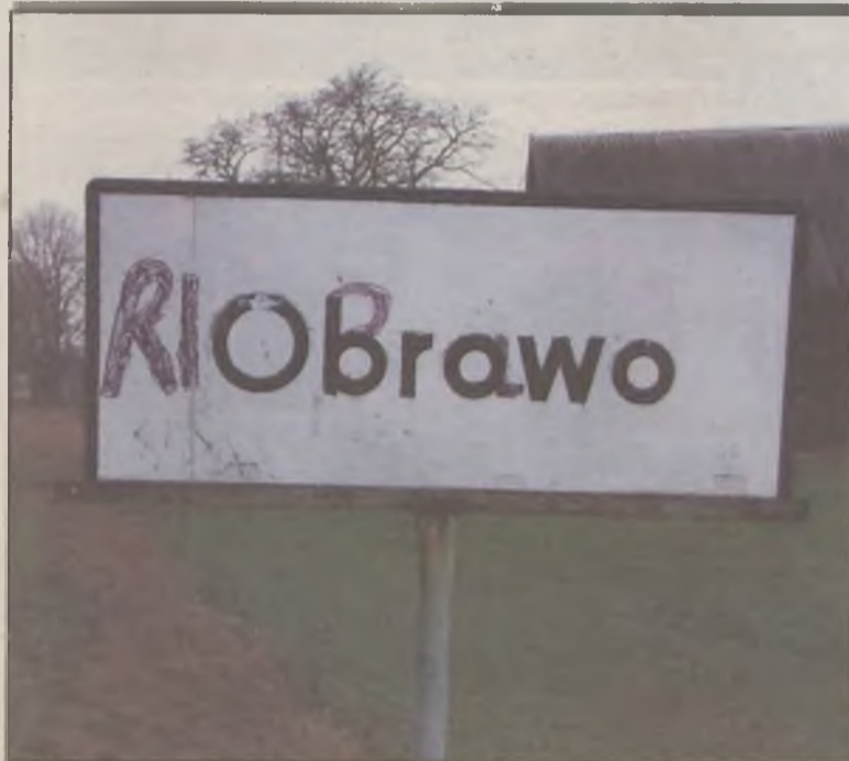
Czyżby marzyli o westernach?