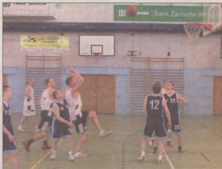
Pojedynki momentami były niezwykle emocjonujące