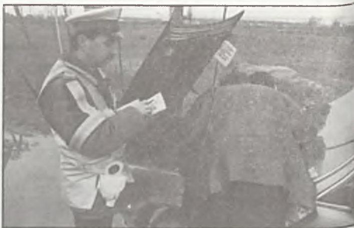
Maska w górę i... sprawdzamy.

Od kierujących blokadą dowiedziałem się, że była to pierwsza, ale nie ostatnia podobna akcja. Zuchwałość, z jaką poruszają sobie gangi samochodowych złodziei nie pozwala na skuteczną walkę z nimi przy pomocy kilku nawet radiowozów. Gdzie i kiedy zorganizowa-