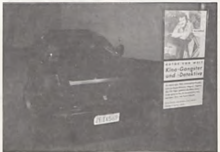
Ferrari 308 GTS — z 3 litrowym silnikiem (zdjęcie górne), znają wszyscy telewidzowie oglądający w latach 80-tych ponad 100 odcinków kryminalnego serialu „Magnum”. Za jego kierownicą zasiadał aktor Tom Selleck.

... Policja Muncypalna zamieniła „dacie” na daczę?