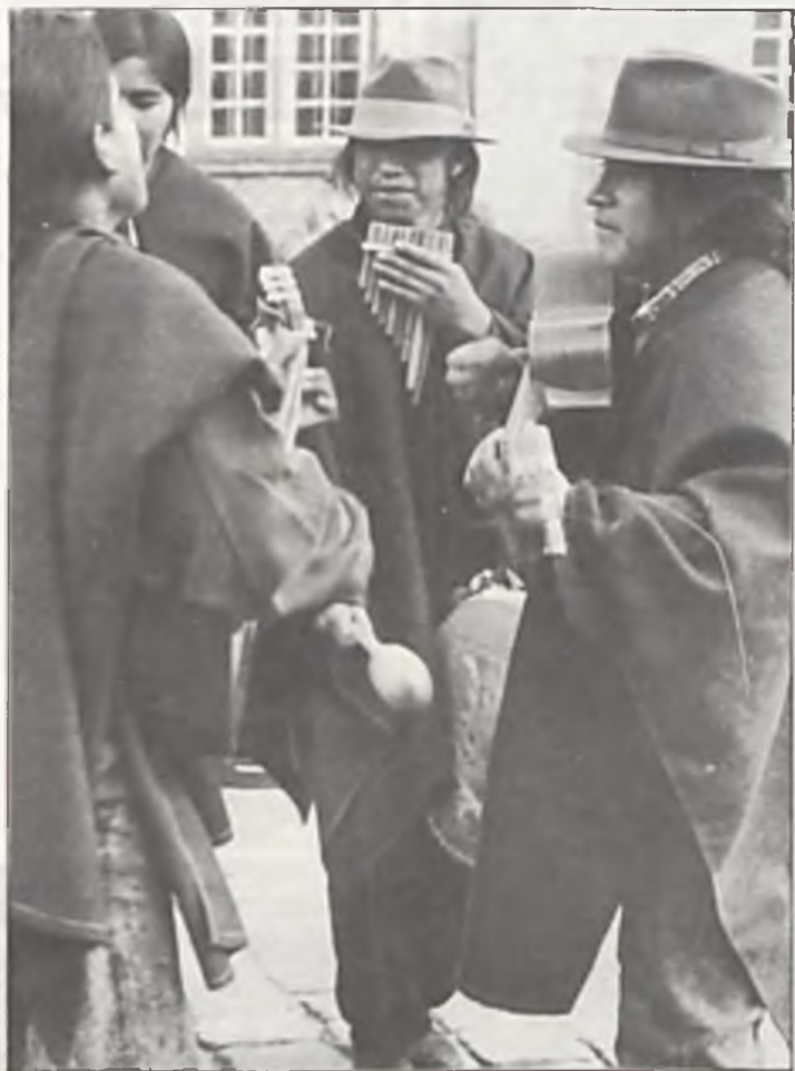
El Condor Passa, Góralu czy ci nie żal, a reszta... ech pal ich sześć.

„Cud mniemany, czyli telefony w Nowej Wsi”. „Cudu nie ma — telefony są” — to tytuły dwóch publikacji na łamach „TS” pojawiły się w minionych tygodniach, a dotyczących telefonizacji naszego miasta. Byliśmy i będziemy do końca śledzili wszystko, co się z tą sprawą wiąże. Rzetelnie i na bieżąco. W najśmielszych myślach natomiast nie przypuszczaliśmy, że będziemy aktualniejsi od „Głosu Wielkopolskiego” (wszak jesteśmy tygodnikiem, a nie dziennikiem), który w poniedziałkowym wydaniu zamieścił informację zatytułowaną „Telefony na papierze”. Być może z perspektywy Poznania to, co dzieje się w Swarzędzu wygląda prowincjonalnie i mdło. Nie zwalnia to jednak nikt, szczególnie dziennikarki podpisującej się „paw”, od minimum rzetelności. Wszak od dwóch tygodni telefony w mieszkaniach w Osiedlu im. Raczyńskiego działają, nie wspominając już osiedli Czwartaków, Dąbrowszczaków i Gryniów. Z informacji uzyskanych w Prokuraturze wynika, iż wpłynęło doniesienie o przestępstwie (pisaliśmy o tym przed kilkoma tygodniami), natomiast brak jakichkolwiek dowodów jego popełnienia. Domyslna natomiast i pomówieniami żywi się prasa brukowa. Jest nam o tyle przykro, że nie uważaliśmy dotychczas „Głosu” za tytuł taki właśnie. (m) P.S. z nieoficjalnych informacji, jakie uzyskaliśmy w miniony wtorek wynika, że autorka może być pozwana do Sądu pod zarzutem pomówienia. Nierzetelność w każdym zawodzie kosztuje.