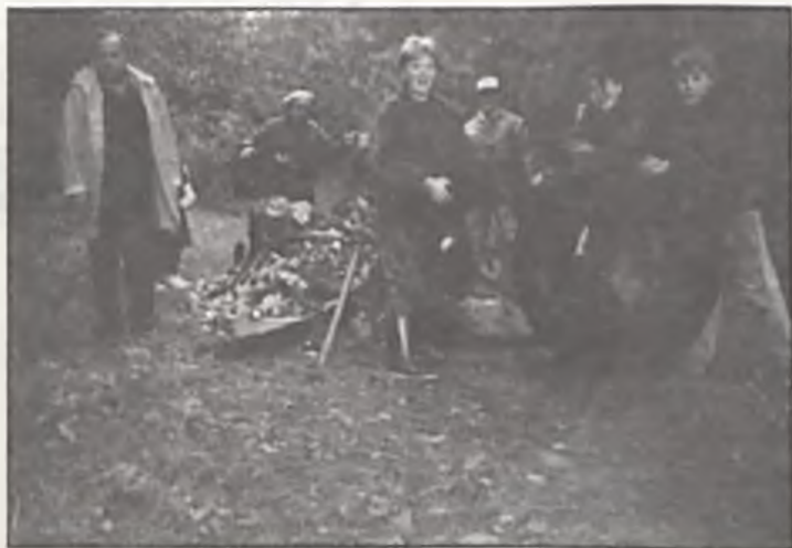
Lasek w Bogucinie sprzątali przede wszystkim młodzi. A sprzątali po nas, po starszych, którzy winniśmy ponoć świecić przykładem. Może zatem dorośli uszanują pracę własnych dzieci i nie będą brudzić otoczenia?