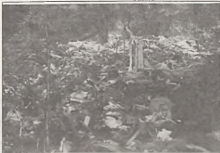
Po czterech tygodniach w lasu Guszczyskim bez zmian.

Jak ważne dla nas są zasoby zieleni nikogo dzisiaj nie potrzeba uświadamiać. Może poza małą grupą osób bezmyślnie niszczących krzewy i drzewa, czy może trochę większą deptających trawniki. Mieszkańcy osiedla Kościuszkowców dwa lata temu postanowili każdego roku dosadzać nowe rośliny. Dzięki temu ilość nasadzeń co pewien czas znacznie wzrasta. Tak też dzieje się dzisiaj.