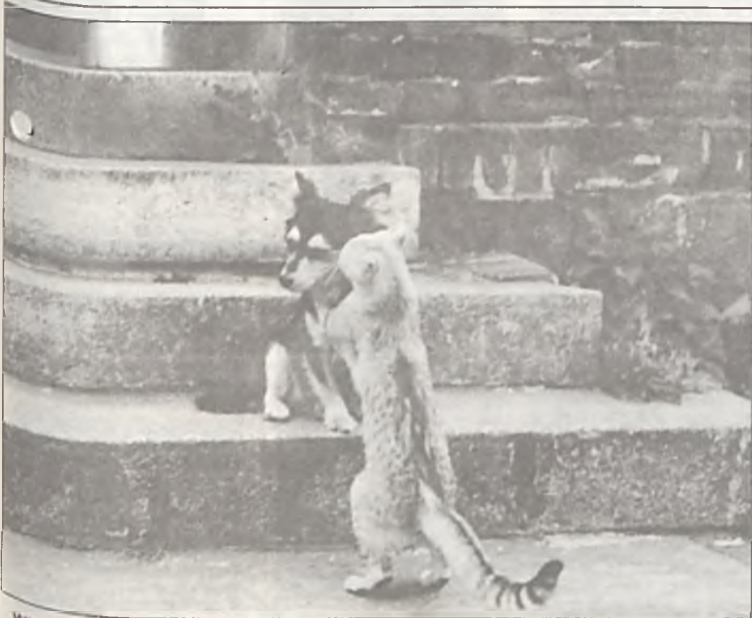
Wiesz, podobno będą budować szkołę na osiedlu Raczyńskiego!