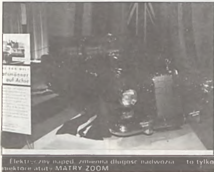
Elektryczny napęd, zmienna długość nadwozia — to tylko niektóre atuty MATRY ZOOM

produkowanych przez FIATa stojącego samotnie białego Cinqcento. Dzwone to i po trasie denerwujące zwały się na mocną obecność pojazdów z Czecho-Słowacji oraz Wspólnoty Niepodległych Państw.