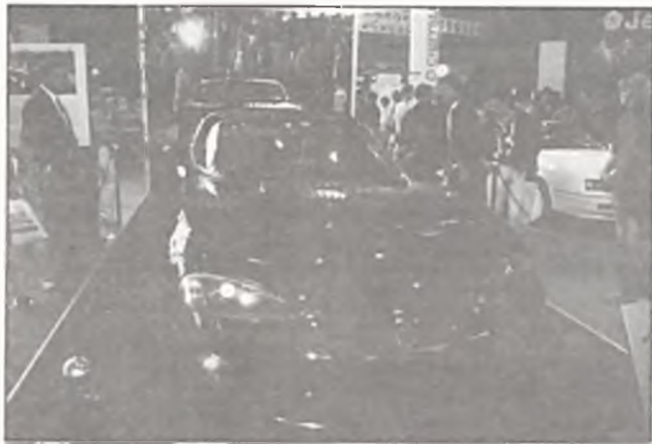
Chrysler RT10 VIPER jeden z przebojów amerykańskiego koncernu.

Od pięciu dni Berlin jest niekwestionowaną stolicą motoryzacyjną Europy. Dokładnie o godzinie 10.00 w minioną sobotę na terenach wystawienniczych Targów Berlińskich nastąpiło otwarcie VIII Międzynarodowej Wystawy Samochodowej zwanej AAA, czyli Auto Avos Ausstellung. Wystawy, która zdaniem jej organizatorów ma pełne szanse w krótkim czasie stać się co najmniej tak znaną i poważnie traktowaną imprezą jak Międzynarodowy Salon Samochodowy we Frankfurcie n/ Menem.