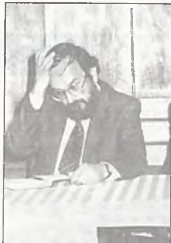
Burmistrz miasta i Gminy Swarzędz

Następna sprawa którą podniósł przewodniczący St. Łukowiak była inwestycja kanalizacyjna na Zatorzu.