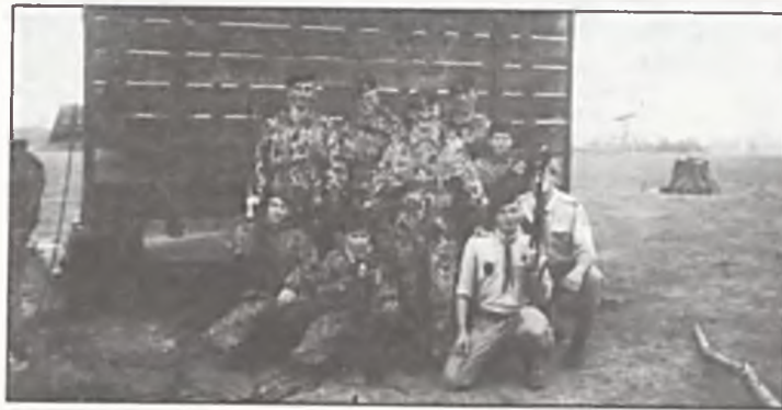
2-28 września 6 SDH - młodszych uczestniczyła w Świątym Złocie Spadochroniarzy 1 SBH Warszawa -Kraków. Drużyna 6 SDH jest członkiem Klubu Pikującego Orła w Kielcach.

Interwencyjny telefon czynny jest codziennie od godz. 8.00 do 15.00 — nr 174-178, od 15.00 do 8.00 dnia następnego — nr 174-011. Osoby dyżurujące zanotują i przekażą nam wszystkie problemy zgłaszane telefonicznie, a my postaramy się w najbliższym wydaniu je opublikować i odpowiedzieć osobom kompetentnych w danej sprawie.