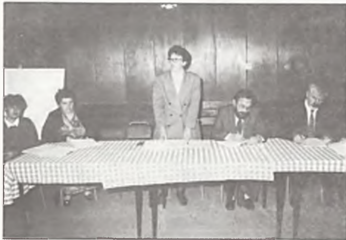
Przedstawiciele Stowarzyszenia z gośćmi na walnym zebraniu.

Stowarzyszenie poza pomocą finansową prowadzi poradnictwo, szkolenia, odczyty z zakresu opieki i leczenia chorych dzieci. Tu rodzice otrzymują niezbędne informacje czy adresy specjalistów.