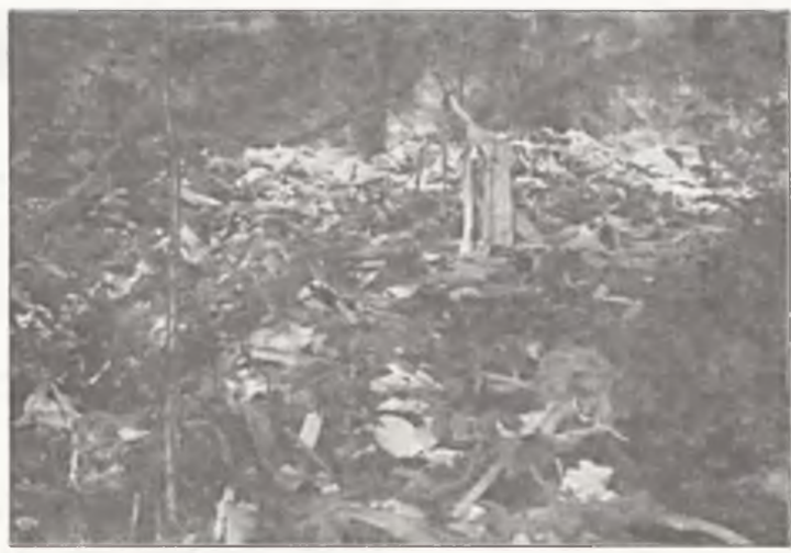
Po dwóch tygodniach w lasku Gruszczyńskim bez zmian.

Cyrk rozłożył się na ul. Rzemieślniczej w Nowej Wsi. Szkoda tylko, że zawitał do nas jedynie na trzy dni... (f1)