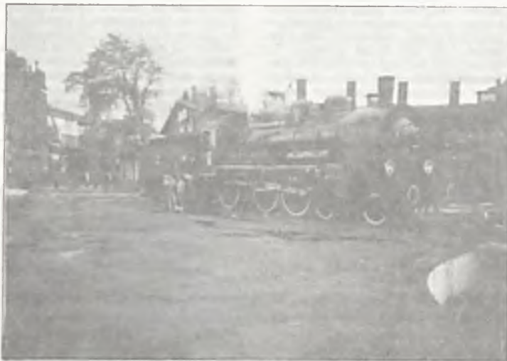
Archiwalne zdjęcie z zeszłorocznego rajdu, podczas którego członkowie HKT „Azymut” przez wiele godzin zwiedzali parowozownię w Wolsztynie.