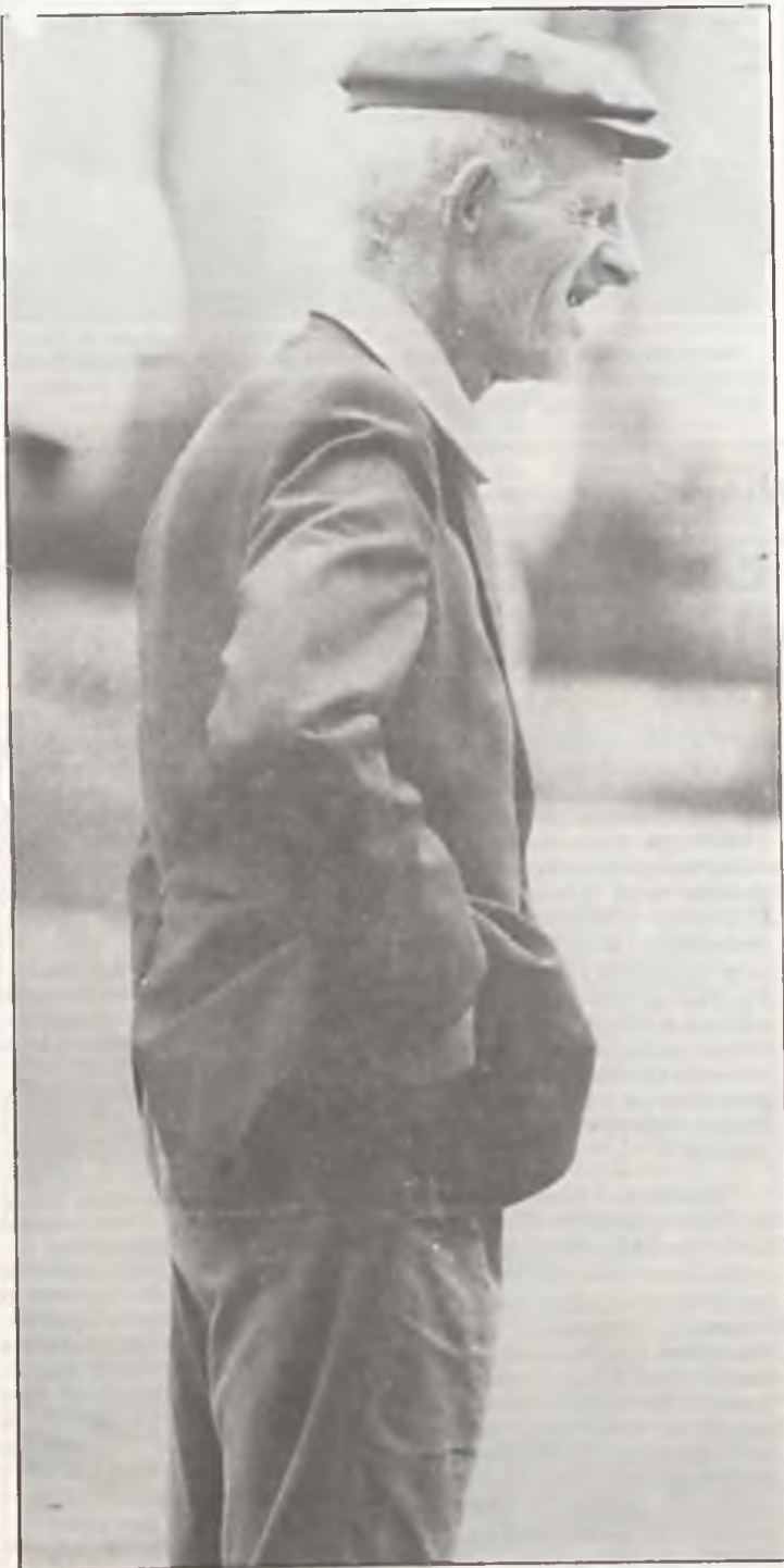
Co łyne jeszcze spieprzom.

Sądymy, że podobne spotkania objawniające wiele trudnych zagadnień, winny odbywać się regularnie w innych osiedlach. Być może, nie widzielibyśmy wówczas własnych dzieci bezmyślnie niszczących wszystko, co tylko jest do zniszczenia. (1z)