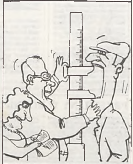
Rys. A. Mleczeko