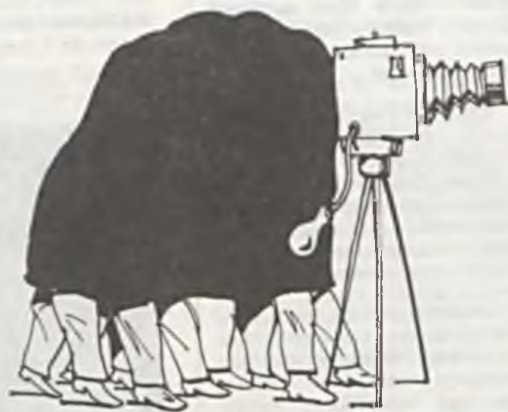
APARAT ADMINISTRACYJNO PARTYZYNY

Ile to wszystko może kosztować? Podejrzewam, że na to pytanie nikt w kraju nie potrafi odpowiedzieć. Czy tę reformę musimy realizować właśnie teraz?