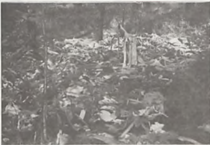
Po tygodniu w lasku Gruszczyńskim — bez zmian!