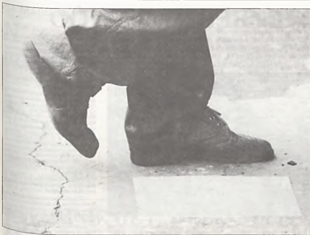
Uwaga nadchodzi prawica. Golał