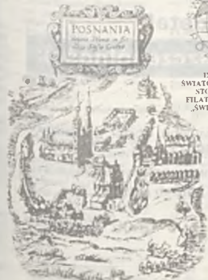
Widok Poznania z 1618 r. (fragment) wg medalionu Brauna i Hogenberga