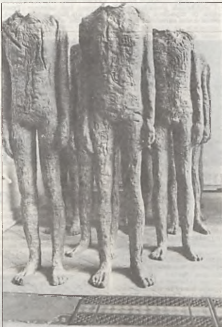
Postacie z symbolicznego obrazu „Święta Góra”. Czyżby to kolejny rząd z tego samego pnia?

To niecała lista, na którą składa się nasza stawka eksploatacyjna. Musimy sobie uświadomić fakt, iż chcąc utrzymać nasze osiedla w takim stanie, jak obecny jesteśmy zobowiązani ponosić pewne koszty. Inna sprawa, że są one duże. (Iz)