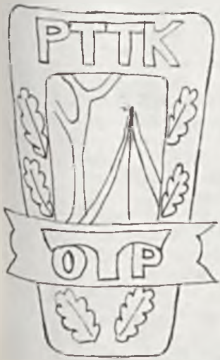
IV. Odnaka „Za wytrwałość”

Odnaki w kategoriach I i II przyznają Oddziały PTTK natomiast w III i IV Zarząd Główny PTTK. Po przejściu każdego odcinka trasy należy uzyskać potwierdzenie terenowe. Mogą to być pieczętki z obiektów PTTK, Urzędów oraz różnych zakładów, sklepów znajdujących się w danej miejscowości a także potwierdzenia przewodników turystyki pieszej. Za tydzień umieścimy wykaz punktowanych miejscowości oraz opiszemy następane odnaki piesze.