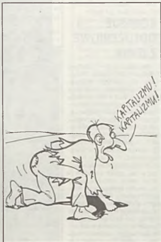
Rys. A. Mleczko

Głodek przemysłu tłumaczy się rozpadem Związku Radzieckiego i RWPG. A tak mówiono, że damy im wszystko za darmo, to skąd mieliśmy pieniądze na robienie prezentów?