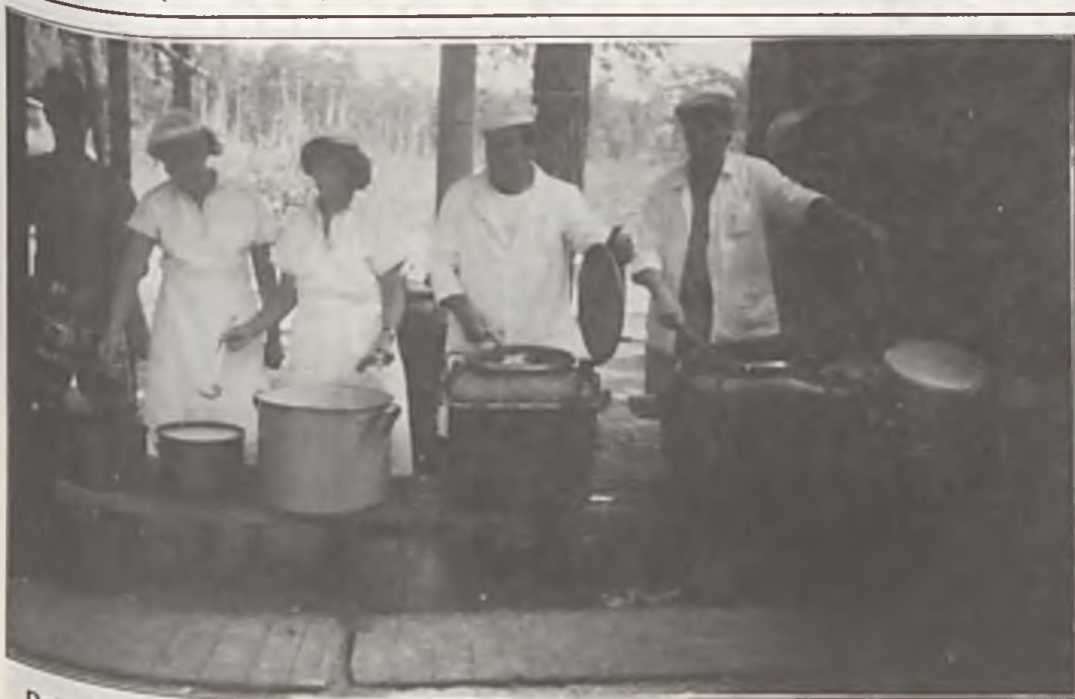
Dobrobyt jest tuż, tuż...

Wszystkie wypowiedzi były na ogół mało tolerancyjne. 50wCelowo wybraliśmy trzy, które były „za”, jako że tylko tych troje rozmówców założyło sobie - naszym zdaniem - na miano „Europejczyków”. (FIL)