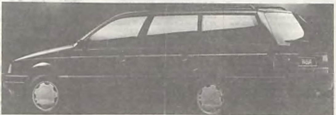
Volkswagen Passat GL. Nie jest to wersja „dostawcza”. Aby być produkowany w FSR Polmo, ale przyznać trzeba, że chciałoby się takim jeździć.