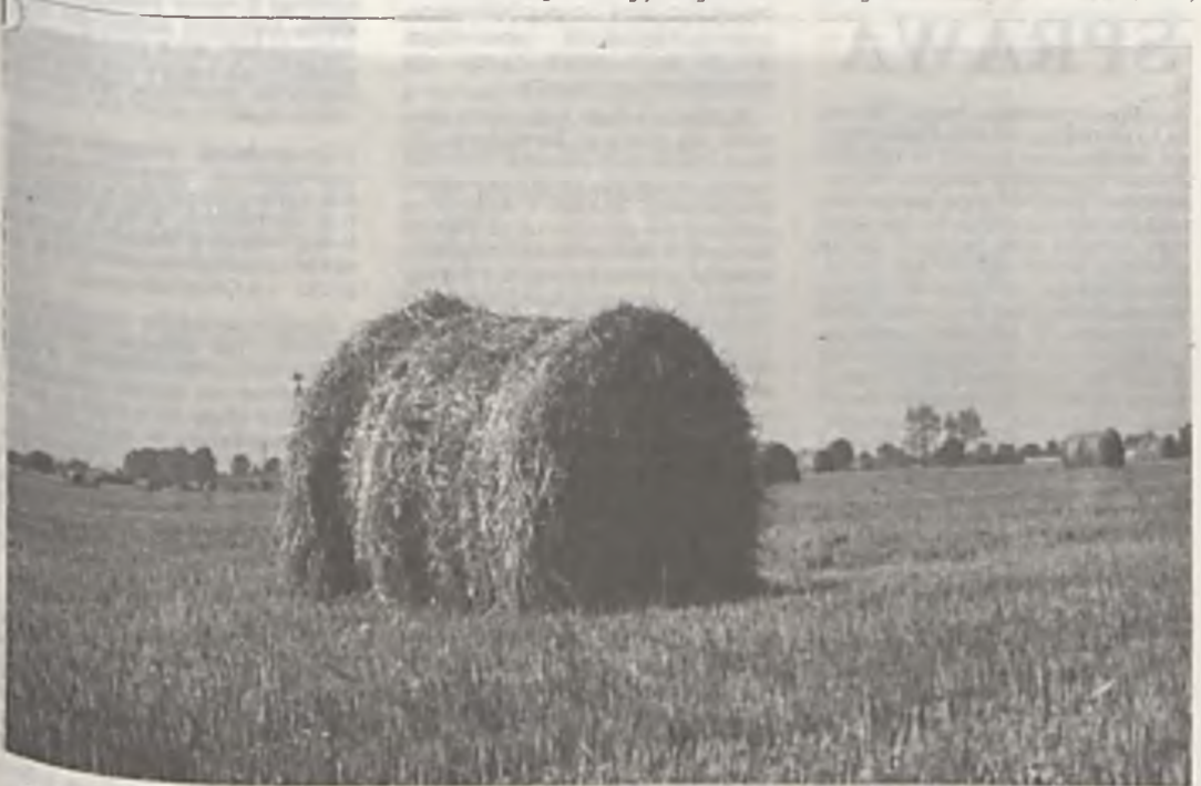
Znowu będą kłopoty z rolnictwem.