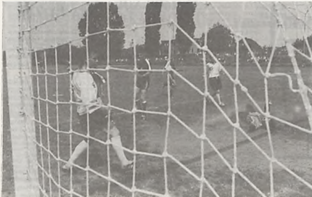
Przebywająca na zgrupowaniu w Zaniemyślu Unia Swarzędz rozegrała towarzyskie spotkanie z Olimpią-Wartą, ulegając I-ligowcom 1:3. „Honorowego” gola dla Unii zdobył Pasek.