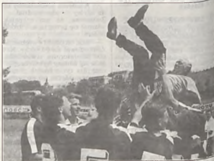
Zwycięzki trener w ramionach zawodników

Termin VI — 5-6 września 92 r. Gwardia Koszalin — Polonia Chodzież Lubuszanin Trzcianka — Polonia Piła Orzeł Biały Wałcz — Unia Swarzędz