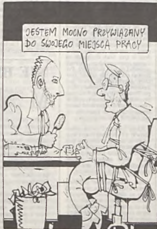
Rys. A. Mleczko

Z pewnością znawcy mają rację. Ja jednak zakończę powiedzeniem Wiecha „... przypuszczam, że wąpnię”.