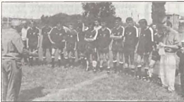
Bohaterowie walki o III ligę — zwycięzki zespół Unii Swarzędz

Termin II — 8-9 sierpnia 92 r. Polonia Chodzież — Orzeł Biały Wałcz Błękitni Stargard — Lubuszanin Trzcianka Pogoń Barlinek — Gwardia Koszalin Darłovia Darłowo — Polonia Piła