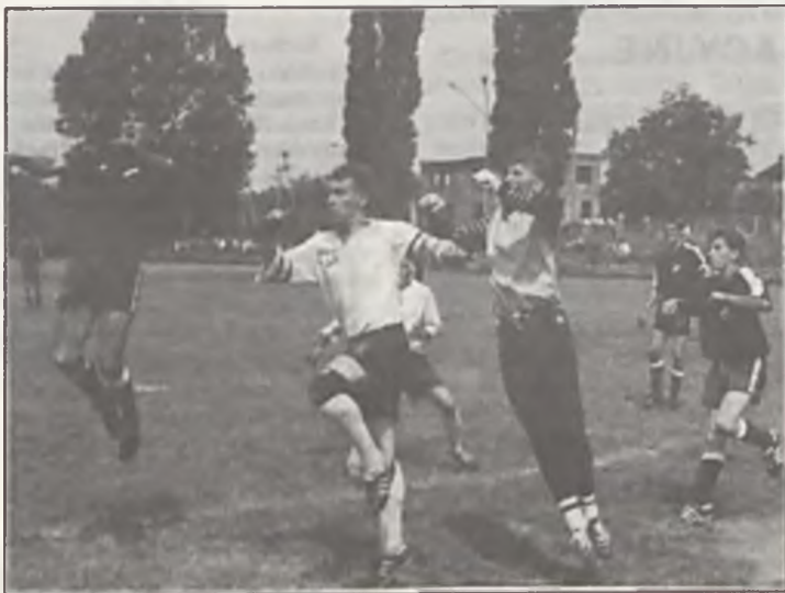
Tak walczyli o pierwsze miejsce

Termin XII — 17-18 października 92 r. Tur Koszalin — Polonia Chodzież Unia Swarzędz — Dąb Dębno Polonia Piła — Hutnik Szczecin Gwardia Koszalin — Lech II Poznań Lubuszanin Trzcianka — Flota Świnoujście Orzeł Biały Wałcz — Celuloza Kostrzyn