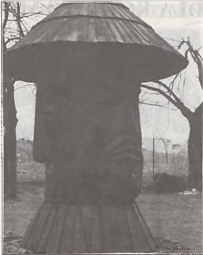
Jak widać, brakuje tylko miodu

Od wstęglej środy, wykręcając numer 49, można łączyć telefonicznie z całym obszarem Niemiec. Dotychczas obowiązywały dwa kierunkowe: 49 dla terytorium dawnej RFN i 37 dla landów dawnej NRD.