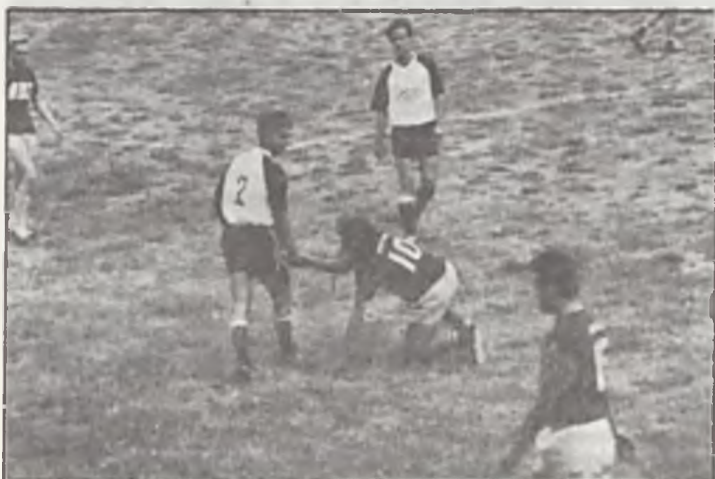
Piast Kobylnica powalił na kolana zespół Matki Boskiej Zwycięskiej.