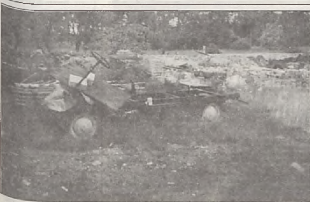
Tak wygląda samochód, gdy kierowcę zmienia się podczas jazdy.

Wszystkich, których pytaliśmy, odpowiadali, że chcieliby mieć normalną drogę. Nawet emerytka, otrzymująca 1.100.000 emerytury stwierdziła, że rodzina jej pomoże i jakoś dołoży się również. W czym więc problem? Dlaczego ul. Jakuba Przybylskiego ma być takim swarzędzkim curiosum? (fil)