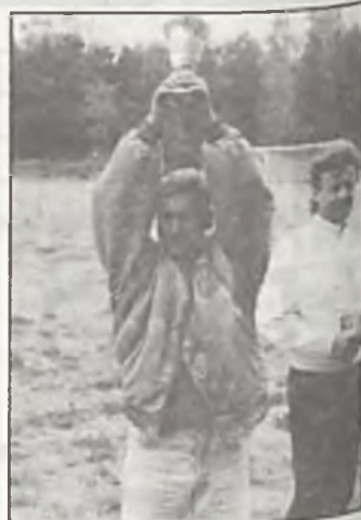
Puchar ligi środowiskowej dla Kobylnicy.