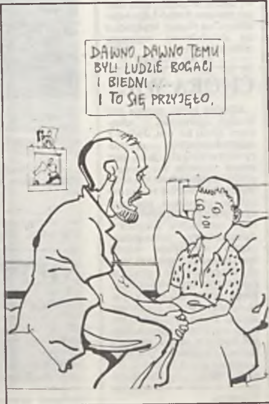
Rys. A. Mleczko

Poprzedni ustrój wyrzuciliśmy na śmietnik. Czyżby to samo należało zrobić z hasłem: „Wszystkie dzieci są nasze”?