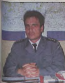
Nowy komendant w Dobrej – str. 3