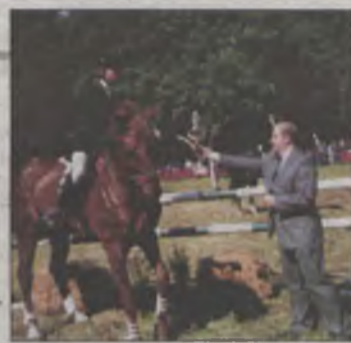
Minister na kawęczyńskim parkurze – str. 9