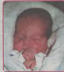
...BOROWSKA córka Justyny i Tomasza ur. 2 czerwca, godz. 13.50 wżyła 3400g, mierzyła 55cm