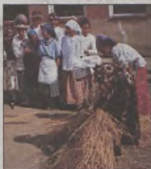
Dzień Dziecka w Tokarach – str. 8