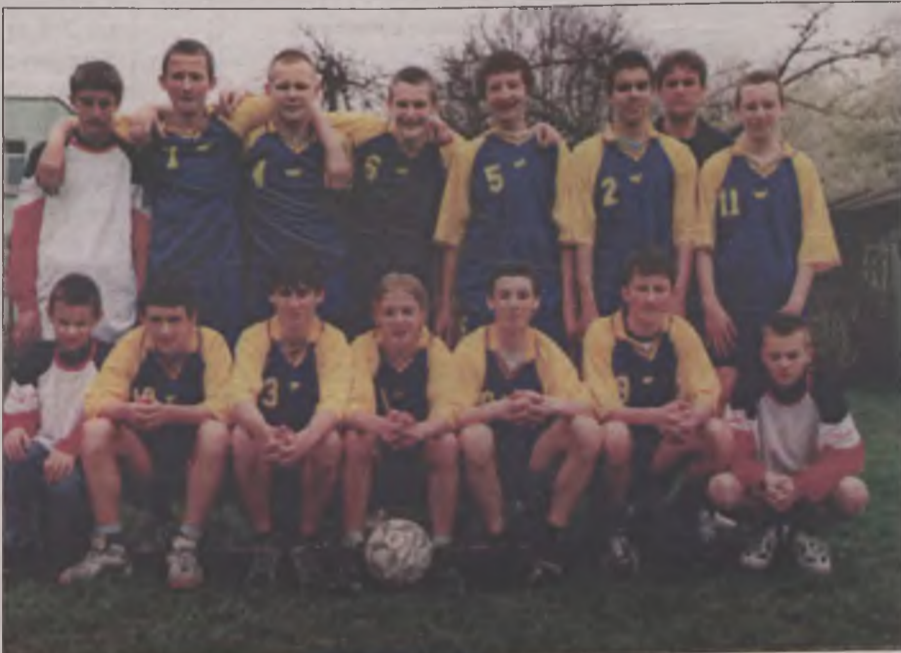
Mistrzowie powiatu - Gimnazjum nr 1 w Turku