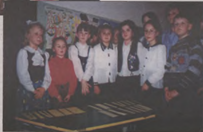
Modele i modelki prezentujący ekologiczny pokaz mody

Ostatnią konkurencją był pokaz mody ekologicznej. Każda klasa przygotowała strój mający przyczynić się do ochrony środowiska. Zarówno jury, jak i publiczności najbardziej podobał się strój reprezentantki klasy pierwszej, który też otrzymał najwięcej punktów. Ostatecznie w pierwszej kategorii wiekowej wygrała klasa pierwsza, a w drugiej klasa czwarta. Zwycięskie klasy w nagrodę otrzymały kwiaty doniczkowe. AZ