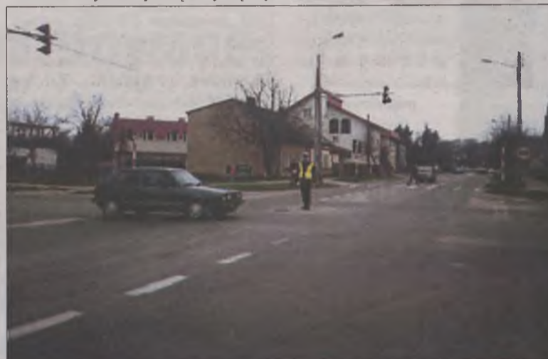
Kierowanie ruchem w wykonaniu najlepszego funkcjonariusza "drogówki"

PHU JAN-POL Turek, ul. Konińska 1 Zapraszamy: codziennie od 7.00 - 18.00 soboty od 8.00 - 13.00