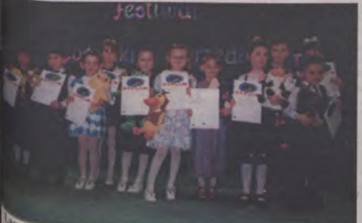
Laureaci Gminnego Festiwalu Piosenki Przedszkolnej

W konkursie wzięli udział dzieci z przedszkola w Brudzewie, z