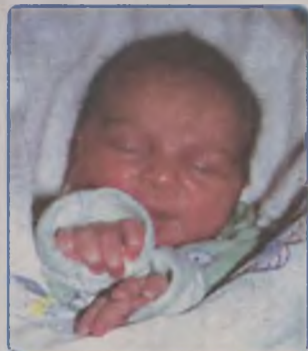
... CIEŚLAK syn Marzeny i Krzysztofa ur. 13 marca 2001r., godz. 10.05 wżyła 2350g, mierzyła 50cm