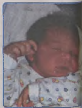
... PACHOLSKI syn Edyty i Ryszarda ur. 13 marca 2001r., godz. 7.15 wżył 3840g, mierzył 55cm