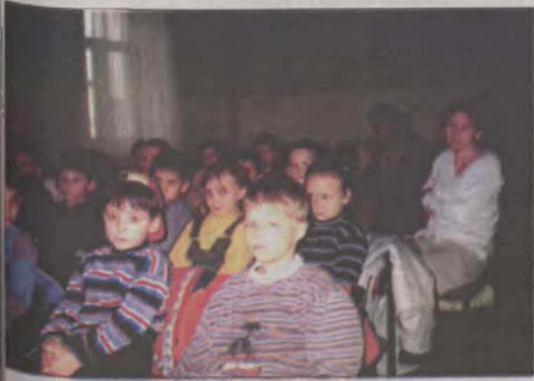
Przedszkolaki na koncercie