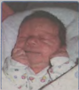
... JANKIEWICZ syn Agnieszki i Rafała ur. 13 marca 2001r., godz. 0.45 wżył 3400g, mierzył 54cm