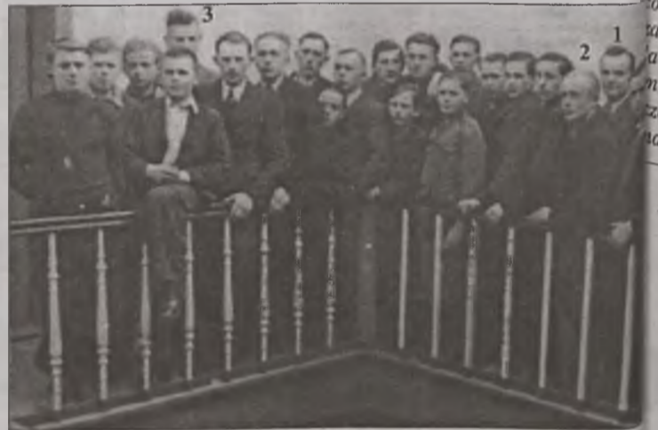
Szkolenie przed rozpoczęciem pracy w fabryce FOCKE-WULF – KRZESINY

Jednocześnie wszystkim poszukiwanym i podobnym do nich redakcja deklaruje wsparcie w skaniu informacji.