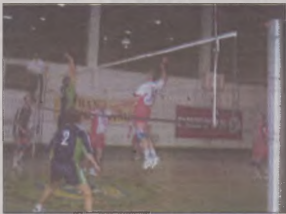
Fragment meczu Tonsil – Zryw

worytem byli jednak wrzesinianie, choć całe spotkanie było dość zacięte i wyrównane. Po blisko półtoragodzinnej grze lepsi okazali się doświadczeni gracze z Wrześni.