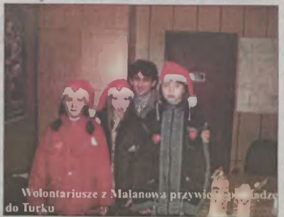
Wolontariusze z Malanowa przywitali gości do Turku