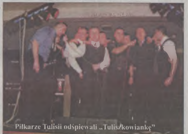
Piłkarze Tulisii odśpiewali „Tuliszkowiankę”