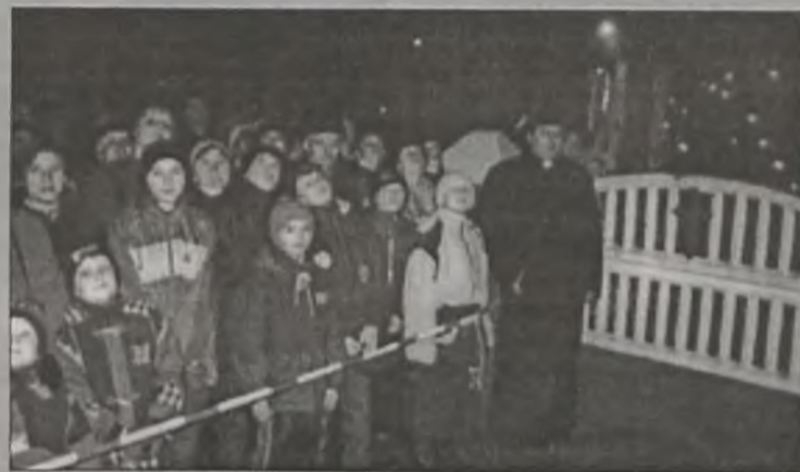
Wszyscy podziwiali wybuchające na niebie peterdy