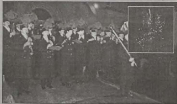
Występ orkiestry dętej KWB Adamów