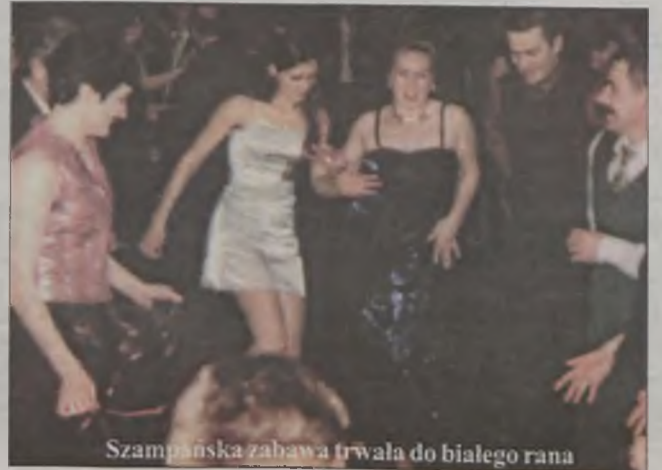
Szampańska zabawa trwała do białego rana