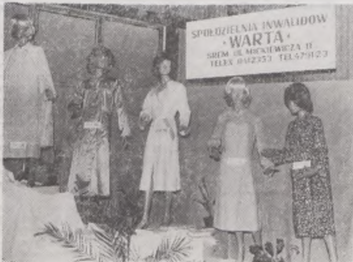
S.I. „Warta” produkuje także (w kooperacji z „Wamelem” Warszawa) wierzchni uzwojone

— Cóż, do tej pory między innymi z powodu niewiedzy i braku wyobraźni niektórych handlowców cierpiał klient. Jestem przekonany, że ta sytuacja na pewno się zmieni. Z.