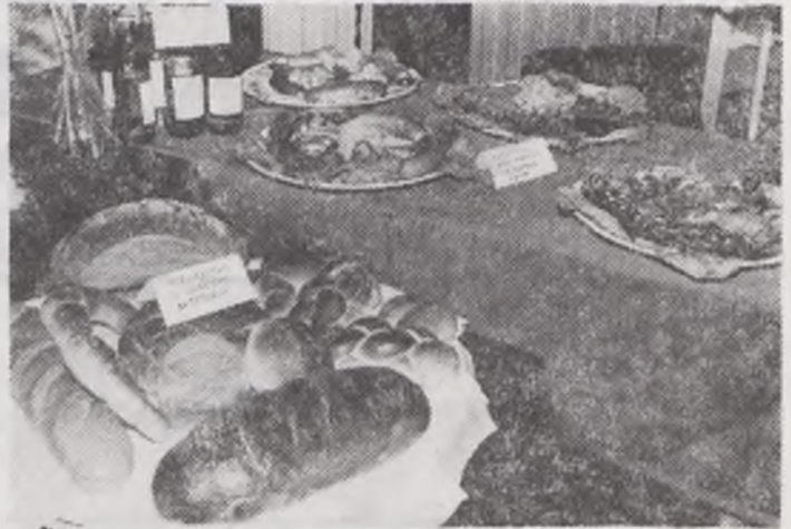
Pieczyno Z. Wolarczyka i wyroby wędliniarskie T. Rzepki są smaczne nie tylko z okazji targów.

— Właśnie po to, żeby taka sytuacja nie powtórzyła się, zrobiliśmy te lokalne targi. Co prawda nie był to najszczęśliwszy mo-