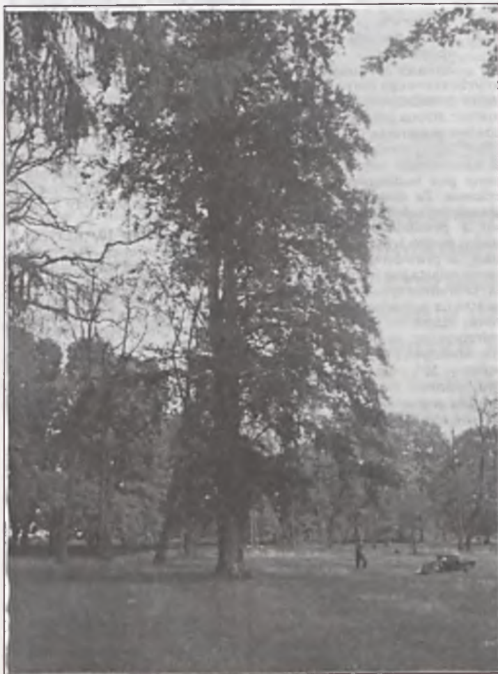
W naszym cyklu prezentacji prac nagrodzonych w Ekokursie, dziś żywy pomnik przyrody rosnący w parku w Uzarzewie.

I przy okazji. Co z zielenią za którą lokatorzy tych bloków od trzech lat płacą? Wysiana dwa lata temu trawa, została już dawno zdeptana, a kilka drzewek nie oparło się młodzieńczym szalenciom. (12)