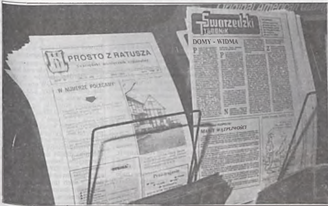
W numerze połączonym z lutego-marca br. „Prosto z ratusza” zamieściło radosną informację (...), możemy się pochwalić, że pismo nasze rozchodzi się w całości(...)” Z zazdrością gratulujemy kolegom z konkurencji. A to co Państwo widzą na zdjęciu zrobionym 2 czerwca to zapewne dodruki.