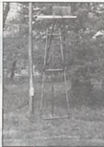
Trudno grać w koszykówkę mając takie tarcze. A dzieciom z Państwowego Domu Dziecka musi taki sprzęt wystarczyć.

wy stół do ping-ponga i wyremontowane boisko oraz sprzęt do gry w koszykówkę. Mamy nadzieję, że zbierzemy także środki na akcję letnią dla dzieci. Osoby i zakłady zamierzające wesprzeć naszą dobroczynną imprezę proszone są o kontakt telefoniczny pod nr. 174-178 (Redakcja) lub 173-992 (redaktor sportowy). Prosimy także o przekazywanie środków pieniężnych na konto Domu Dziecka w BS Swarzędz nr 3900-189-99 z dopiskiem „Festyn”. Dalsze informacje dotyczące organizacji jak i programu imprezy przekazywać będziemy Państwu w kolejnych numerach Tygodnika Swarzędzkiego.