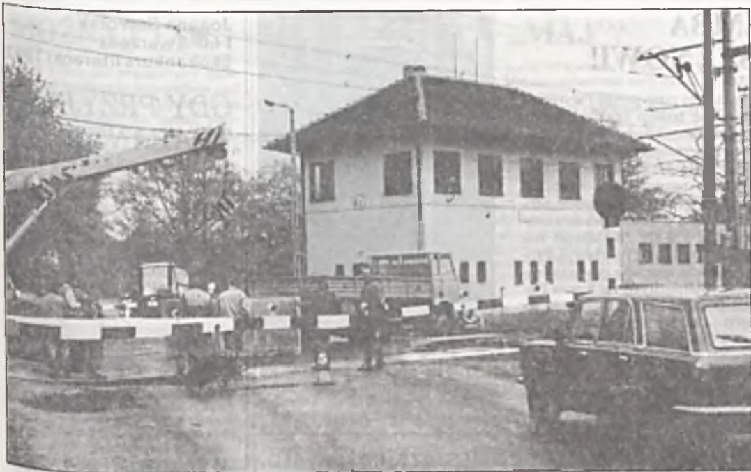
Tak przedstawiamy polskie reformy na nowe tory.