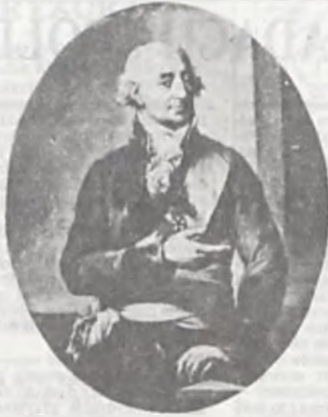
Stanisław Małachowski — marszałek Sejmu Czteroletniego.

W dniu 3 maja mija dwusetna pierwsza rocznica uchwalenia Konstytucji 3 Maja, która była owocem działań Sejmu Czteroletniego (1788 — 1992).