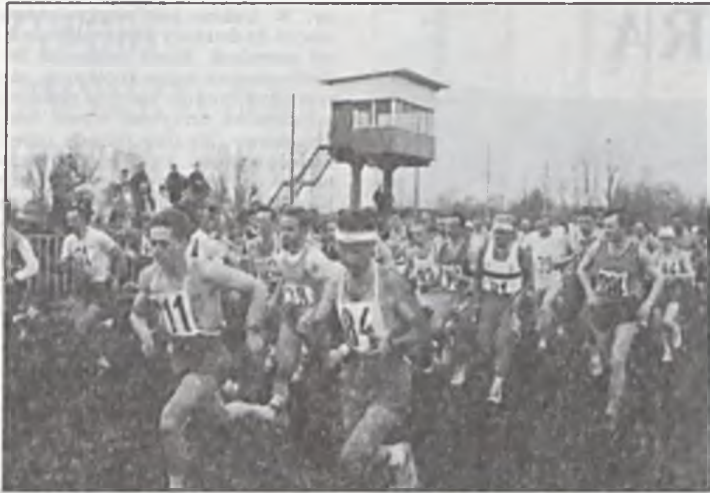
Start do biegu.