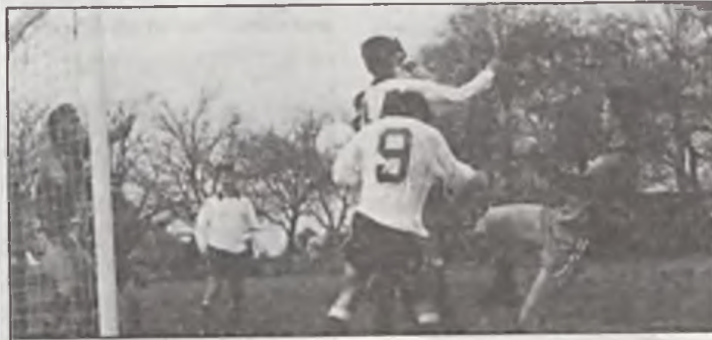
Pod bramką Paczkowa.