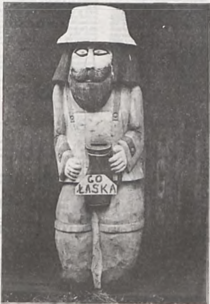
Z jednego solidarnościowego pnia.

Czekamy na odpowiedź licząc, że tym razem udzieli jej Pan naszym Czytelnikom. (Iz)