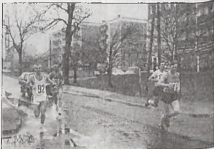
15 w lewo, 5 prosto.