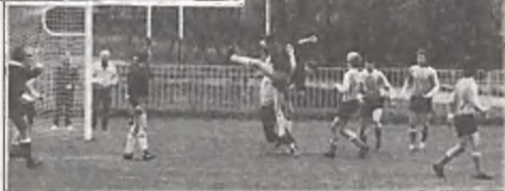
Groźna sytuacja pod bramką Polonii.