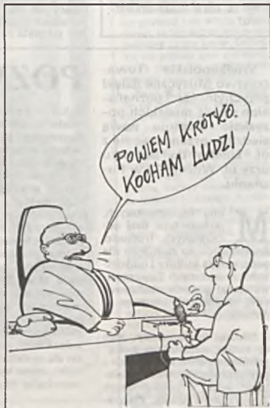
Rys. A. Mleczko

Boję się, że to kwaśne piwo będziemy musieli znowu wypić my wszyscy.