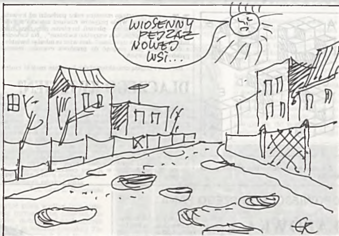
Graf. Eryk Sierński