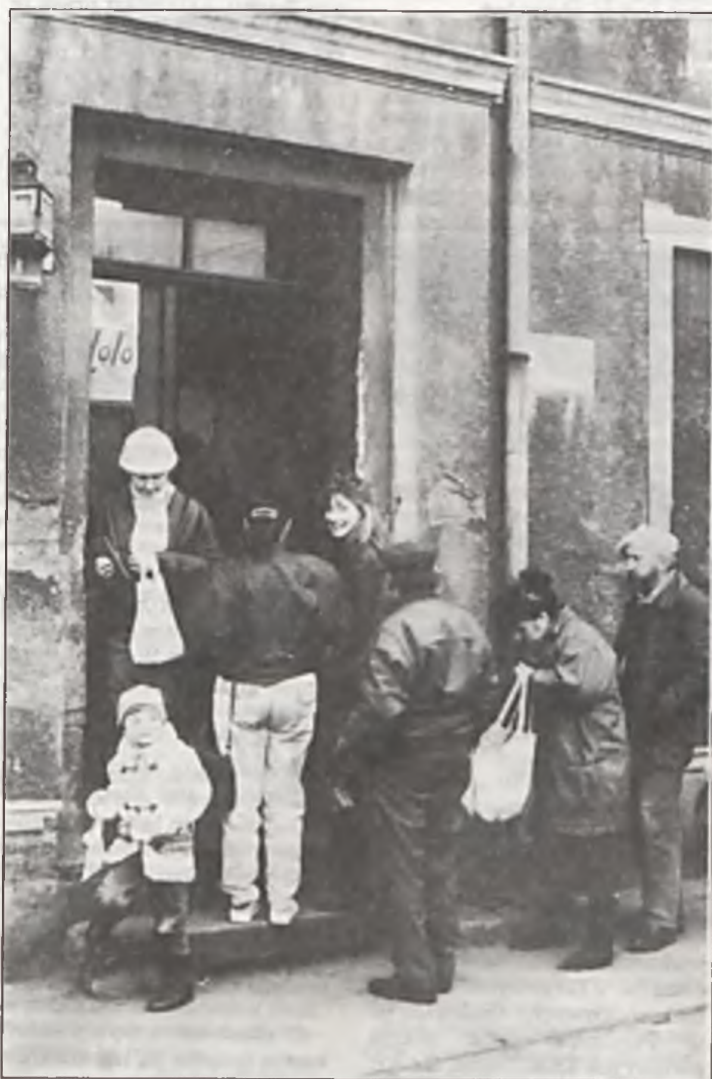
Kolejka po przepustki do Eldorado.

Osoby, które zgodziły się udzielić odpowiedzi na postawione pytania prosiły o anonimowość. Wiadomo, temat jest drażliwy i nikt nie chce się narazić na osąd społeczny.