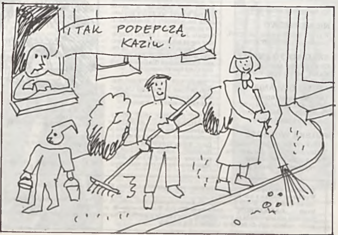
Reportera przy tym nie było. Taka podepcza Kaziu!