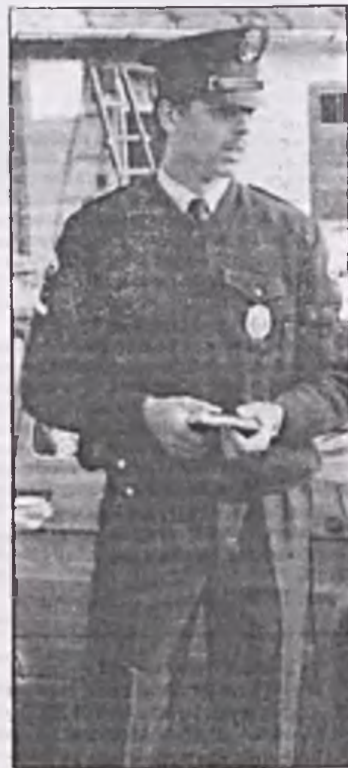
Nie zawsze są bezpieczni.

Proszę więc w jego i innych imieniu. Spółdzielcze znaczy wspólne, nasze, godne troski i szacunku. Proszę, i po troszę wstydy się tego, że o tak elementarnych prawdach trzeba przypominać. (JAW)