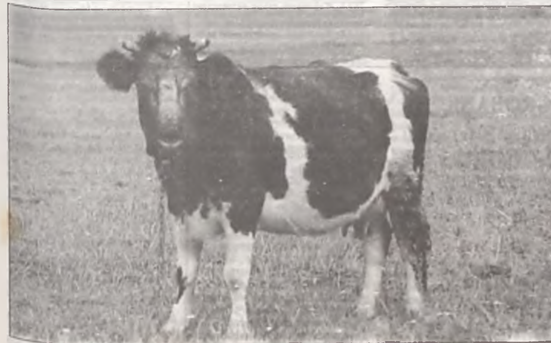
Boże, co mnie jeszcze czeka?