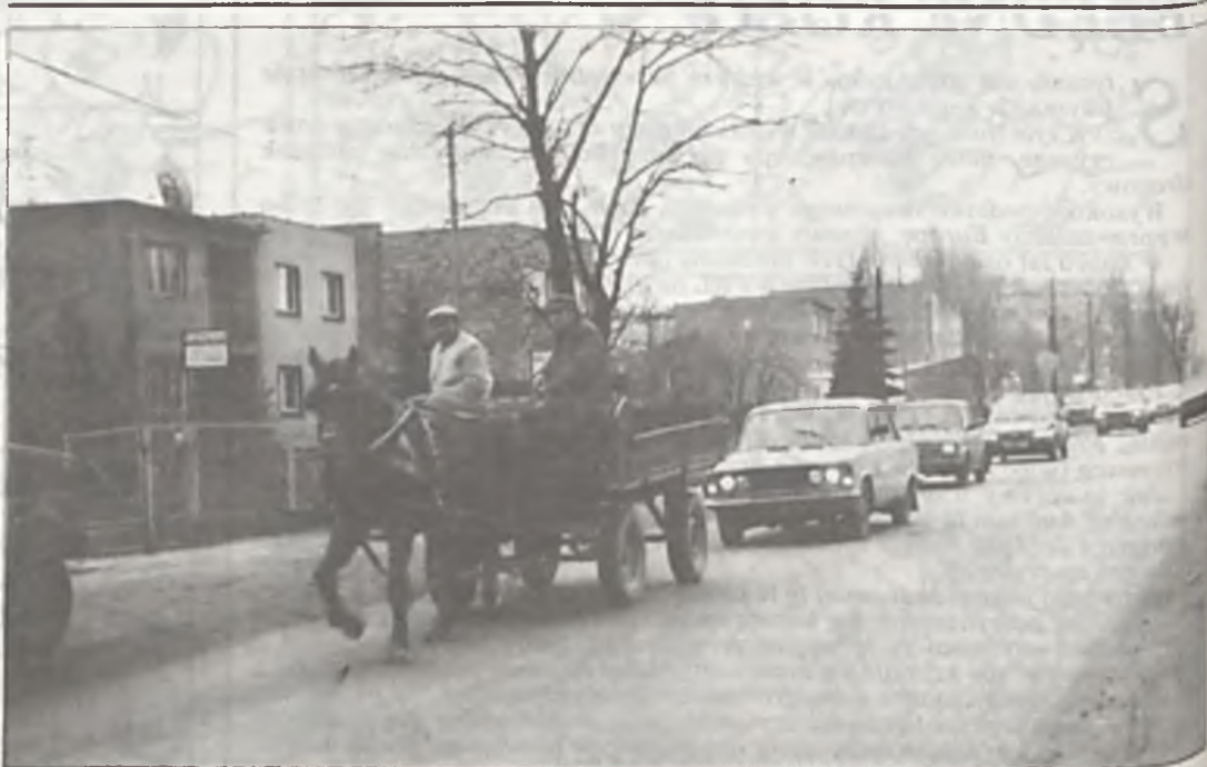
Tym sposobem jesteśmy w czołówce światowych reform.

Po styczniowej zmianie cen biletów niektórzy Czytelnicy zostali z nieaktualnymi „bloczkami”. Informujemy zatem, że pieniądze są do odzyskania w Urzędzie Miejskim, pok. 21. (12)