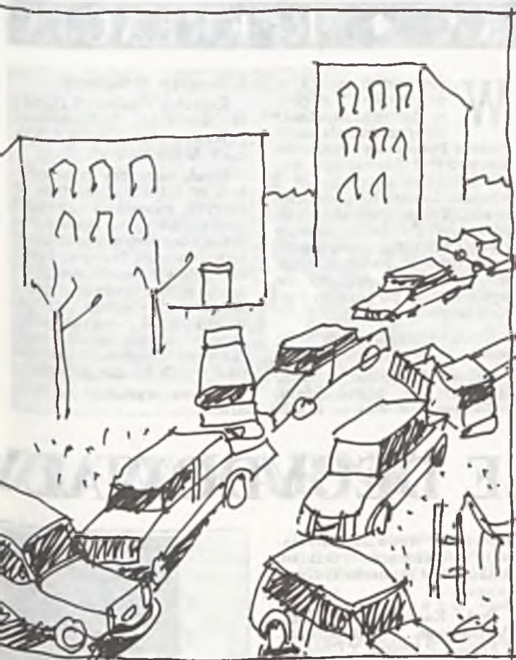
Codzienny widok osiedli. Moje miliony na naszych milionach. Rys. E. Sieński