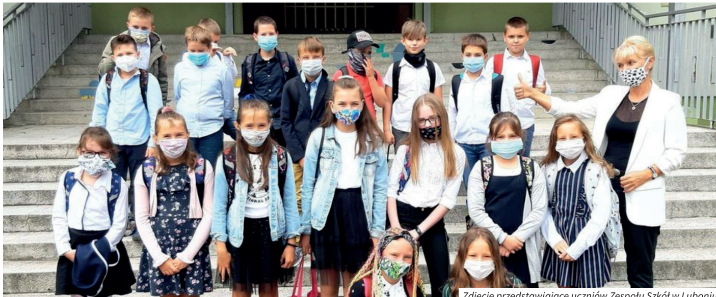
Zdjęcie przedstawiające uczniów Zespołu Szkół w Luboniu

Maseczki, przyłbice oraz płyn do dezynfekcji wpisały się w naszą codzienność. Nie zabrakło ich we wtorek, 1 września, kiedy to rozpoczął się długo oczekiwany nowy rok szkolny. Większość klas spotkała się w salach ze swoimi nauczycielami. Dzieci otrzymały plan lekcji i odebrały przygotowane przez bibliotekarki zestawy podręczników. Następnego dnia wychowawcy przedstawili swym podopiecznym zasady funkcjonowania szkoły w czasie pandemii, a na zebraniach poznali je także rodzice.