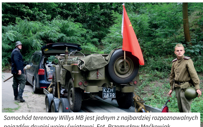
Samochód terenowy Willys MB jest jednym z najbardziej rozpoznawalnych pojazdów drugiej wojny światowej.

tu VIIa podczas kolejnych Dni Twierdzy koordynowanych przez Poznańską Lokalną Organizację Turystyczną. Jednak pasja oraz zaangażowanie naszych przyjaciół zwyciężyło i prywatny obiekt można było bezpłatnie zwiedzać, podobnie jak czyniliśmy to przez ostatnie dziesięć lat pokazując niedostępne na co dzień budowle militarne poznańskiej twierdzy. Pewnym mankamentem były tym razem ściśle limitowane grupy zachowujące obostrzenia sanitarne. Wszystko jednak się udało i dość wyjątkowy obiekt zwiedziło kilkaset osób (dla porównania w 2013 roku było to cztery tysiące osób!).