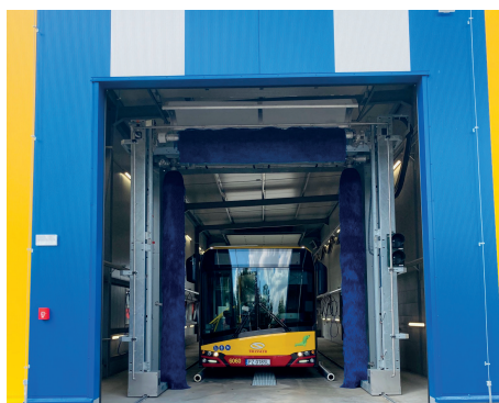
Zdjęcie przedstawiające autobus, znajdujący się w myjni autobusowej

Myjnia jest wyposażona m.in. w samojezdny, trzyszczotkowy (2 boczne i dachowa) portal z silnikami jezdny, umożliwiający mycie zewnętrzne pojazdów o wysokości 3,5 – 4,20