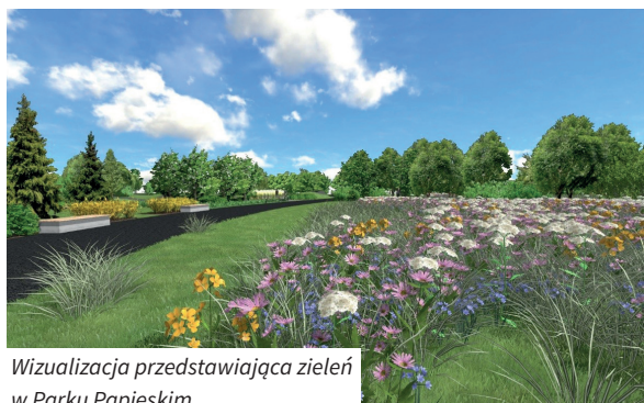
Wizualizacja przedstawiająca zieleni w Parku Papieskim

Na terenie Parku Papieskiego trwają obecnie prace przygotowawcze pod nasadzenia roślinności. Dobór gatunkowy pozwoli zwiększyć bioróżnorodność roślin na tym obszarze. Projekt przewiduje posadzenie jesienią tego roku ponad 700 szt. drzew, ponad 5600 krzewów, ponad 1200 sadzonek bylin i traw oraz wykonanie różanek i obsadzenie pnąciami pergoli. Prace zieleniarskie przewidują również rewitalizację trawników, pielęgnację zieleni istniejącej i zieleni nowo założonej. Nowością również będą łąki kwietne na terenie parku o powierzchni ponad 1 ha, a pośród łąk kwietnych rozstawione będą 3 hotele dla owadów.