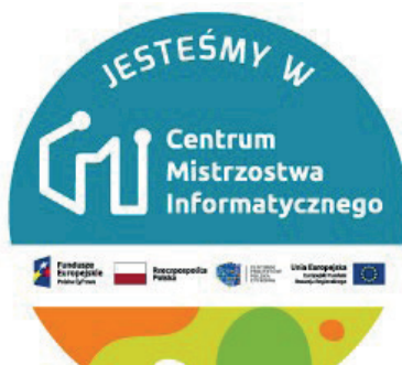
Grafika przedstawiająca logo Centrum Mistrzostwa Informatycznego

W nowym roku szkolnym po raz kolejny, nasi uczniowie klas starszych będą mogli uczestniczyć w zajęciach w ramach programu CMI. To cykl bezpłatnych zajęć z algorytmiki i programowania. Nauczą się profesjonalnego programowania i zapanują nad algorytmami. Będą mogli poznać informatykę od podszewki. Uczniowie będą mieli możliwość uczestniczenia w zawodach algorytmicznych i projektowych, organizowanych przez Politechnikę Łódzką.