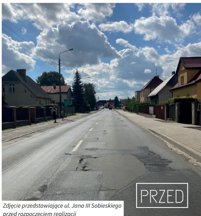
Zdjęcie przedstawiające ul. Jana III Sobieskiego przed rozpoczęciem realizacji

Od 31 sierpnia trwały prace związane z wymianą nawierzchni bitumicznej na ul. Jana III Sobieskiego, na odcinku od ul. Fabrycznej do ul. Wschodniej. Wiemy, że przed nami jeszcze dużo pracy. Jednak nie zwalniamy tempa i oprócz realizowanych inwestycji, jeszcze w tym miesiącu rozpoczną się prace związane z przebudową chodnika na ul. Sobieskiego, od ul. Łącznej do ul. Podgórnej oraz przebudową chodnika na ul. Poniatowskiego, od ul. Klonowej do ul. Kołtątaja