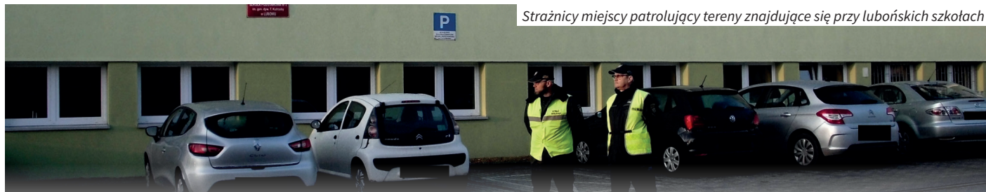
Strażnicy miejscy patrolujący tereny znajdujące się przy lubońskich szkołach

Od 1 września 2020 r., strażnicy miejscy wzorem lat ubiegłych, dbają o bezpieczeństwo dzieci i młodzieży przy szkołach w Luboniu, w godzinach porannych tj. 7.45 – 8.15 oraz w godzinach popołudniowych. Naszym celem jest zapewnienie bezpieczeństwa dzieciom w drodze do i ze szkoły. Niestety coraz częściej dochodzi do niebezpiecznych sytuacji. Obserwujemy rodziców, którzy przywożąc dzieci do szkoły, zatrzymują swoje pojazdy w sposób uniemożliwiający bezpieczne przejście chodnikiem lub w odległości mniejszej niż 10 metrów od przejścia dla pieszych. Tym samym stwarzają realne zagrożenie dla dzieci. Blokują przejazd autobusów, na drodze jednokierunkowej jeżdżą niezgodnie z kierunkiem jazdy oraz wjeżdżają na skrzyżowania na czerwonym lub pomarańczowym świetle. Coraz częściej widzimy również dzieci jadące ulicą na hulajnodze lub wbiegające na ulicę bez sprawdzenia czy nie nadjeżdża pojazd.