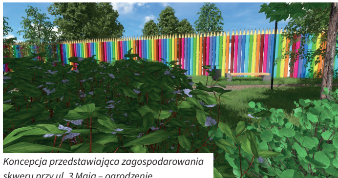
Koncepcja przedstawiająca zagospodarowania skweru przy ul. 3 Maja – ogrodzenie