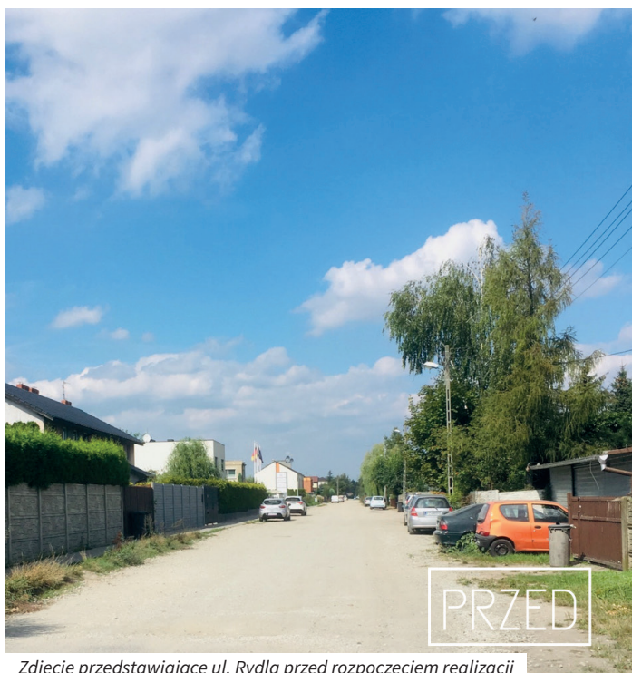
Zdjęcie przedstawiające ul. Rydla przed rozpoczęciem realizacji