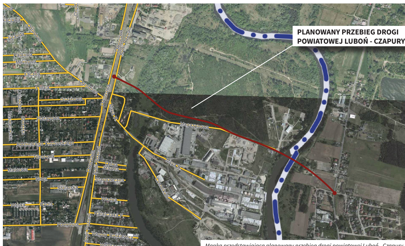
Mapka przedstawiająca planowany przebieg drogi powiatowej Luboń - Czapury

Zgodnie z przepisami prawa każdemu przysługuje dostęp do informacji o środowisku. Informacja może być udostępniona m.in. ustnie lub przez wgląd do danego dokumentu. W okresie, w którym z powodu wprowadzonych rozwiązań, ograniczeń czy zakazów/nakazów związanych z „COVID -19” ograniczona będzie możliwość osobistego wglądu do dokumentów, wskazany jest kontakt telefoniczny z osobą prowadzącą postępowanie (Joanna Cichoń 618130011 wew. 35 lub 697 630 648).