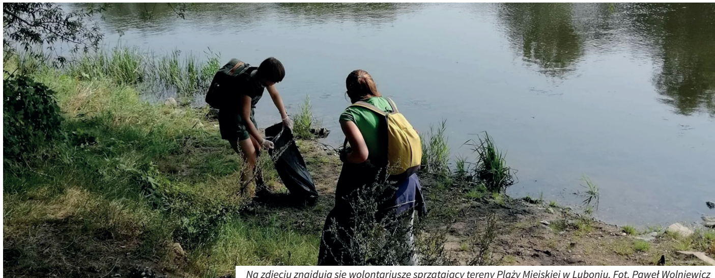
Na zdjęciu znajdują się wolontariusze sprzątający tereny Plaży Miejskiej w Luboniu.