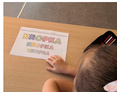
Zdjęcie przedstawiające prace plastyczne, wykonaną z okazji „Dnia Kropki”