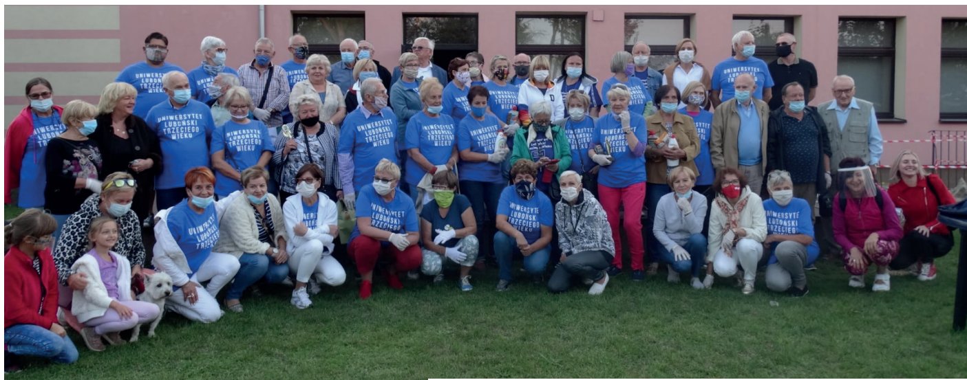
Zdjęcie przedstawiające wszystkich uczestników VI Miejskiej Olimpiady Aktywnego Seniora

W ubiegły piątek, 11 września na placu zabaw Ośrodka Kultury w Luboniu, odbyła się VI Miejska Olimpiada Aktywnego Seniora. W konkurencjach sportowych i konkursie wiedzy udział wzięli seniorzy z Lubońskiego Uniwersytetu Trzeciego Wieku. Uczestnicy mogli zmierzyć się w następujących kategoriach: rzut kulą, rzut do kosza, rzut do celu, bieg z szarfą, „wieża z puszkami”, „klepanie książek”, „gwóźdź olimpiady”, „bezpieczny senior” oraz „Czy znasz Luboń?”. Zwycięzcom gratulujemy wygranych, a wszystkim dziękujemy za wspaniałą zabawę i miło spędzony czas.