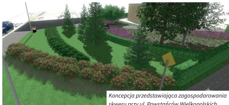
Koncepcja przedstawiająca zagospodarowania skweru przy ul. Powstańców Wielkopolskich

Skwerek przy ul. Powstańców Wielkopolskich/ Ks. Streicha o powierzchni 0,0234 ha nie stanowi dużej powierzchni, jednak jego wybór był podyktowany jednym z kryteriów o lokalnym programie rewitalizacji. Zieleniec ten zostanie przebudowany oraz doposażony o dwie ławeczki i kosz na śmieci. Zostaną usunięte stare skupiny krzewów oraz posadzone nowe rośliny: 86 szt. krzewów, 494 szt. pnączy, 15 róż oraz 569 szt. bylin. Żywopłaty zostaną zrewitalizowane, a ubytki w nich uzupełnione.