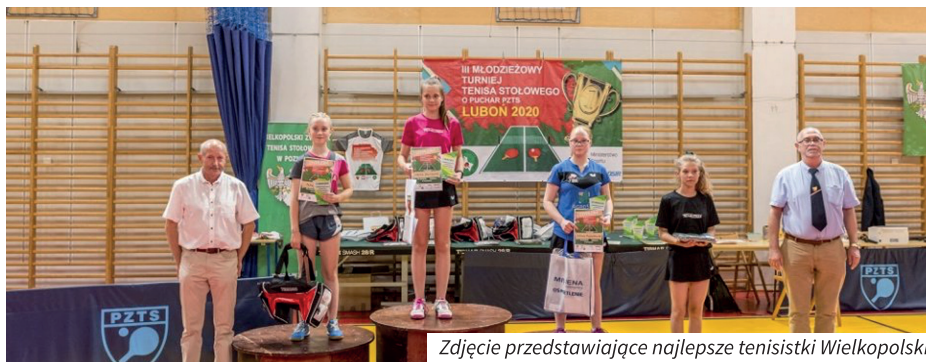
Zdjęcie przedstawiające najlepsze tenisistki Wielkopolski

września, a w kolejnych dniach pracownicy LOSIR we współpracy z KOM LUB uporządkowali i zabezpieczyli otoczenie kontenera. Zyskaliśmy nowoczesne zaplecze boiska Orlik i mamy nadzieję, że obiekt będzie dobrze służył zarówno uczniom Szkoły Podstawowej nr 4, jak i wszystkim pozostałym użytkownikom obiektu!