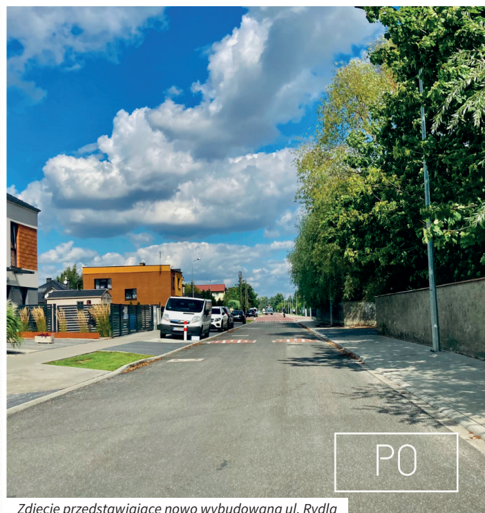
Zdjęcie przedstawiające nowo wybudowaną ul. Rydla

Od 31 sierpnia trwały prace związane z wymianą nawierzchni bitumicznej na ul. Jana III Sobieskiego, na odcinku od ul. Fabrycznej do ul. Wschodniej. Wiemy, że przed nami jeszcze dużo pracy. Jednak nie zwalniamy tempa i oprócz realizowanych inwestycji, jeszcze w tym miesiącu rozpoczną się prace związane z przebudową chodnika na ul. Sobieskiego, od ul. Łącznej do ul. Podgórnej oraz przebudową chodnika na ul. Poniatowskiego, od ul. Klonowej do ul. Kołtątaja