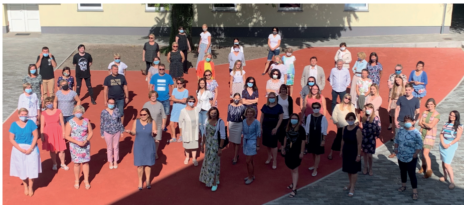
Szkoła Podstawowa nr 2 im. Augusta hr. Cieszkowskiego Grono Pedagogiczne 2020/2021

Pierwszy tydzień szybko minął. Kadra „Cieszkowianki” już w sierpniu rozpoczęła przygotowania do kolejnego, pełnego wyzwań roku szkolnego. Nauczyciele ukończyli kursy z cyberprzemocy, przeszkolili się również w pomocy psychologiczno-pedagogicznej i zyskali nowe narzędzia samorozwoju. „Jesteśmy gotowi do pracy. W tych trudnych warunkach naszym priorytetem jest przede wszystkim bezpieczeństwo. Zadbamy oczywiście również o wysoki poziom zajęć dydaktycznych – wychowawczych” – zaznaczają nauczyciele szkoły.