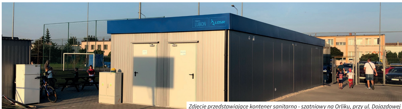
Zdjęcie przedstawiające kontener sanitarno - szatniowy na Orliku, przy ul. Dojazdowej

Boisko Orlik na ulicy Dojazdowej zmienia swoje oblicze. W efekcie przystąpienia do programu „Szatnia na Medal” realizowanego przez Urząd Marszałkowski Województwa Wielkopolskiego Miasto Luboń otrzymało dofinansowanie na budowę kontenera sanitarno-szatniowego. Kwota wsparcia to 76 500 złotych, co stanowi 50% wartości inwestycji. Na zapytanie ofertowe odpowiedziały 4 firmy,