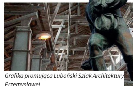
Grafika promująca Luboński Szlak Architektury Przemysłowej