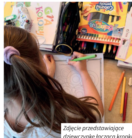
Zdjęcie przedstawiające dziewczynkę tączącą kropki

Od pięciu lat, 15 września, obchodzi się „International Dot Day”. Jest to święto kreatywności, odwagi i zabawy. Uczniowie, nauczyciele, bibliotekarze, pracownicy instytucji kultury na całym świecie, organizują tego dnia wiele działań, które pomagają dzieciom odkryć talenty, poznać ich mocne strony i je zaprezentować.