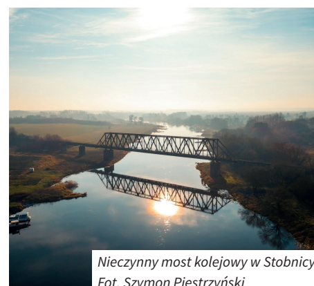
Nieczynny most kolejowy w Stobnicy.

ko nie zrealizowano planów, o których ostatnio donoszą media. Unikatowy, zabytkowy most w Stobnicy nie został zniszczony ani przez polskich saperów w 1939 r., ani przez wycofujących się Niemców w 1945 r., liczymy więc, że uda się go uchronić także przed planami wysadzenia na potrzeby kolejnej części filmu „Mission: Impossible”.