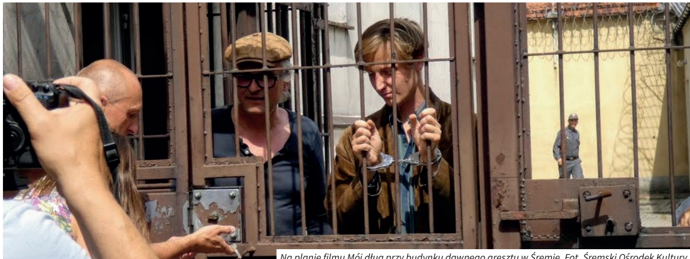
Na planie filmu Mój dług przy budynku dawnego aresztu w Śremie.

Podpoznańskie lasy, pałace czy muzea to nie tylko idealne miejsca spędzania wolnego czasu, ale też źródło inspiracji i atrakcyjne plenery dla filmowców. Spora odległość od Łodzi – stolicy polskiego filmu i warszawskich studiów filmowych nie przeszkodziła w powstaniu licznych filmów, za sprawą których okolice Poznania stały się istotnym miejscem na mapie rodzimej kinematografii.