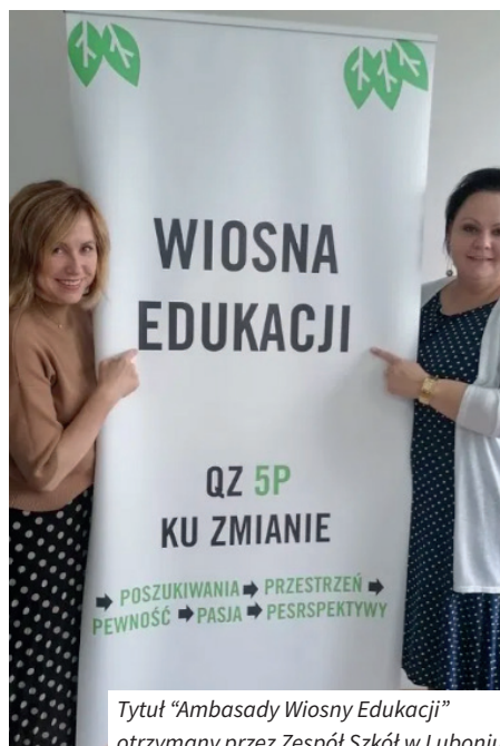
Tytuł „Ambasady Wiosny Edukacji” otrzymany przez Zespół Szkół w Luboniu

5 września w Radowie Małym, odbył się finał programu „Wiosna Edukacji”. Szkoły, które uczestniczyły dwa lata temu w inauguracji, w Warszawie i wykonano w nich założenia, otrzymały tytuł „Ambasady Wiosny Edukacji”. Tytuł otrzymała także nasza placówka. W Zespole Szkół wprowadzono wiele innowacji pedagogicznych, zagospodarowano przestrzeń, nauczyciele rozwijali swoje pasje i doskonalili się zawodowo. Dla uczestniczek projektu z naszej szkoły, najciekawsze były wizyty studyjne w Radowie Małym, gdzie zachwycało zagospodarowanie klas, korytarzy i boiska.