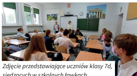
Zdjęcie przedstawiające uczniów klasy 7d, siedzących w szkolnych ławkach

W czasie przerw, uczniowie dbają o zachowanie dystansu i zakładają maseczki, a w przypadku infekcji zostają w domu. Gdyby gorączka i inne niepokojące dolegliwości dopadły kogoś w szkole, na przyjazd rodziców lub pomoc medyczną można poczekać w zaciszu izolatki. Na razie nikt nie tęskni za zdalnym nauczaniem, ale w przypadku zachorowań na COVID-19 wśród uczniów i nauczycieli trzeba będzie wziąć je pod uwagę. Kluczowa jest tu opinia sanepidu oraz stanowisko dyrektora i organu prowadzącego.