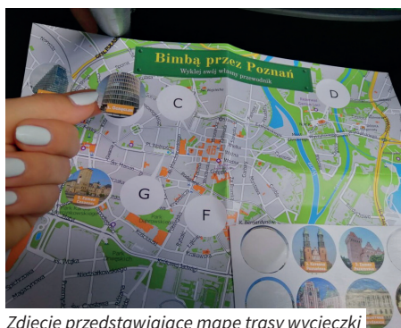
Zdjęcie przedstawiające mapę trasy wycieczki

„Bimbą po Poznaniu”, czyli wycieczka zabytkowym tramwajem była doskonałą okazją do zobaczenia miasta z innej, ciekawej perspektywy. 22 lipca grupa dzieci w wieku od 7 do 12 lat udała się do Poznania, aby poznać jego najważniejsze atrakcje turystyczne. Zobaczyliśmy między innymi: Plac Adama Mickiewicza, Plac Wolności, Ostrów Tumski, Most Rocha i Maltę. Organizatorem wycieczki był Ośrodek Kultury w Luboniu.