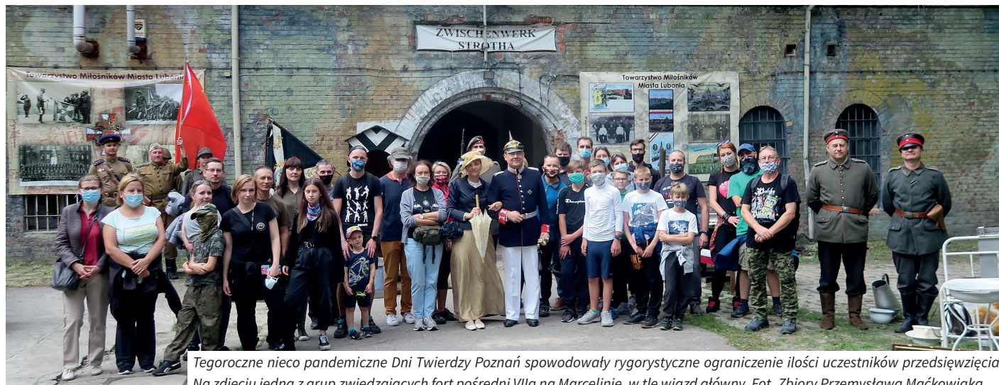
Tegoroczne nieco pandemiczne Dni Twierdzy Poznań spowodowały rygorystyczne ograniczenie ilości uczestników przedsięwzięcia. Na zdjęciu jedna z grup zwiedzających fort pośredni VIIa na Marcelinie, w tle wjazd główny.

Towarzystwo Miłośników Miasta Lubonia zorganizowało po raz kolejny w dniach 29-30 sierpnia zwiedzanie fortu VII a na Marcelinie, w ramach VIII Dni Twierdzy Poznań. Wcześniej prywatny obiekt był pokazywany w swojej historii jedynie trzy razy w trakcie naszych Fortecznych Weekendów w 2009 i 2013 roku oraz ubiegłorocznych Dni Twierdzy.