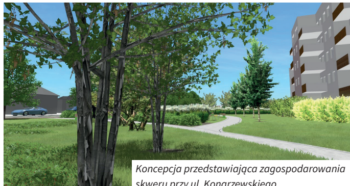
Koncepcja przedstawiająca zagospodarowania skweru przy ul. Konarzewskiego