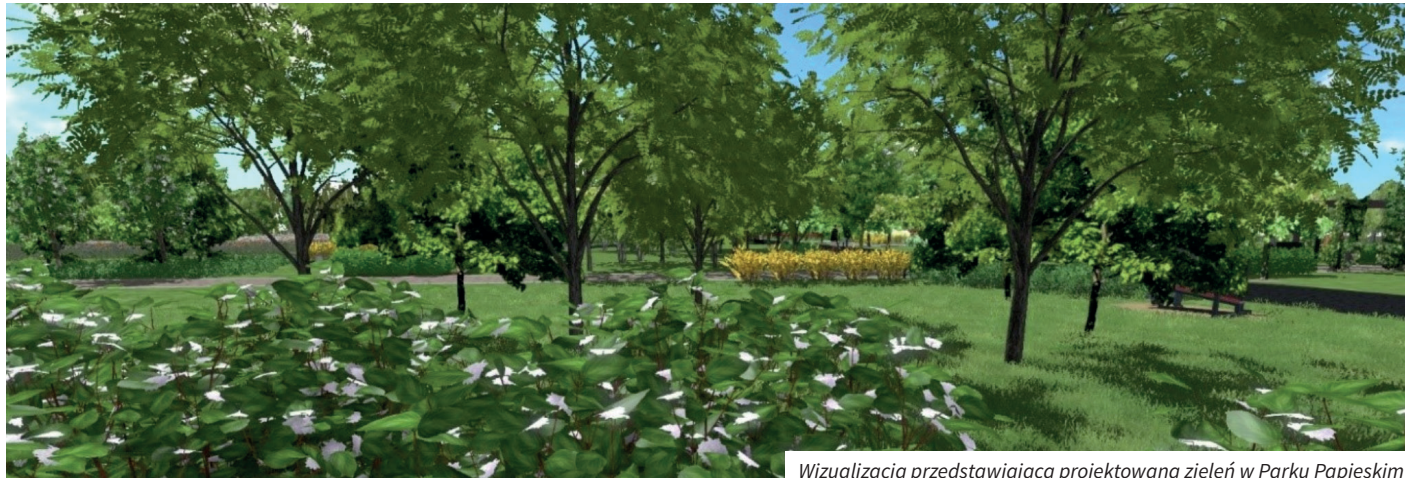
Wizualizacja przedstawiająca projektowaną zieleni w Parku Papieskim

Drodzy Mieszkańcy, z radością informujemy, że rozpoczął się kolejny etap prac realizowanych w ramach projektu konkursowego, na które miasto otrzymało dotację z Narodowego Funduszu Ochrony Środowiska i Gospodarki Wodnej w zakresie tzw. priorytetu „2.5. Poprawa jakości środowiska miejskiego”.