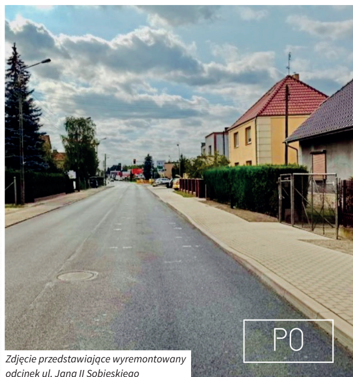
Zdjęcie przedstawiające wyremontowany odcinek ul. Jana II Sobieskiego