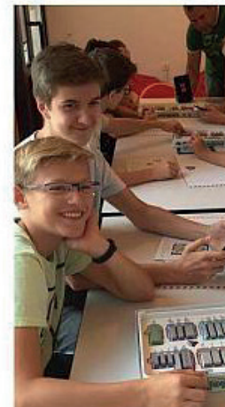
Kolaż zdjęć przedstawiający zwiedzone miejsca