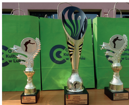
Zdjęcie przedstawiające trzy puchary, ufundowane przez Miasto

decznie gratulujemy zwycięzcom, a także dziękujemy wszystkim uczestnikom za wspaniałą zabawę.