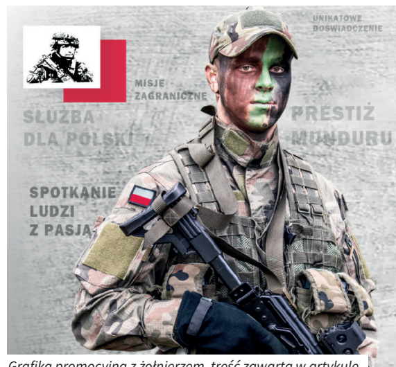
Grafika promocyjna z żołnierzem, treść zawarta w artykule

Planujesz związać swoją przyszłość z Wojskiem Polskim? A może dopiero zastanawiasz się nad służbą dla swojego kraju? Mamy dla Ciebie świetną wiadomość! Reforma procesu rekrutacji do Sił Zbrojnych RP wprowadza szereg ułatwień dla kandydatów. Nowe podejście do rekrutacji, procedura powołania zaplanowana tak, by była jak najprostsza i by w jak największym stopniu odpowiadała wymaganiom ochotników, więcej turnusów szkoleniowych, a także ich skrócony wymiar. Przeczytaj artykuł i dowiedz się, jak zmienia się dla Ciebie Wojsko Polskie!