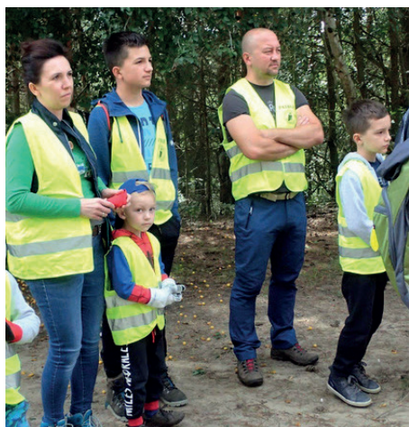
Wolontariusze Wielkopolskiego Parku Narodowego