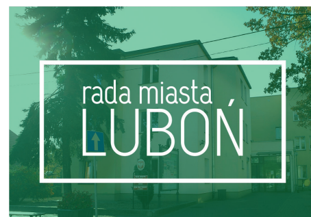
Grafika przedstawiająca logo Rady Miasta Luboń