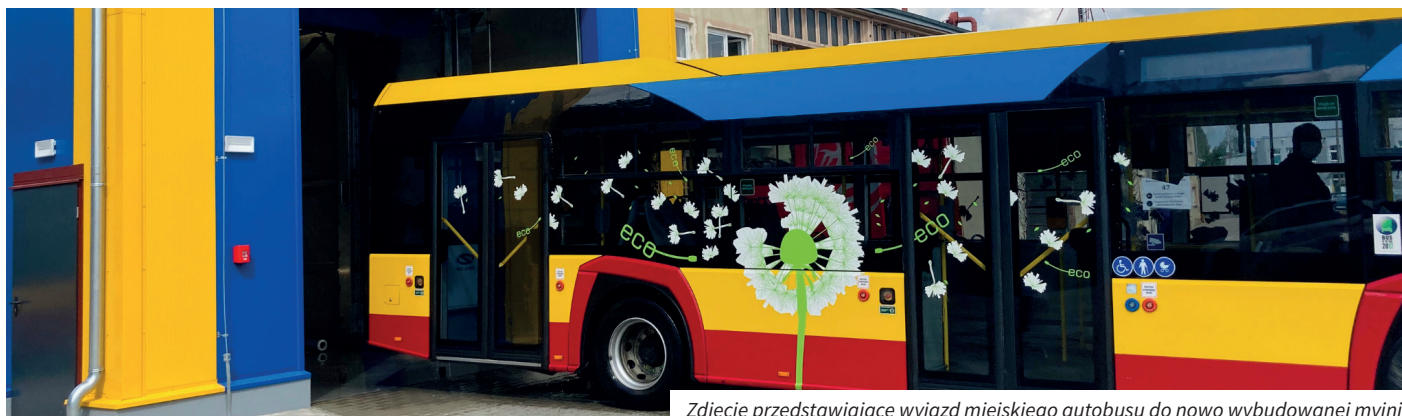
Zdjęcie przedstawiające wyjazd miejskiego autobusu do nowo wybudowanej myjni

Nasz miejski przewoźnik Przedsiębiorstwo Transportowe „Translub” Sp. z o.o. może już korzystać z nowoczesnej, automatycznej, a co najważniejsze ekologicznej myjni autobusowej. Taki obiekt to w dzisiejszych czasach standard każdej bazy autobusowej. Budowa myjni autobusowej została zrealizowana w ramach Wielkopolskiego Regionalnego Programu Operacyjnego na lata 2014-2020, Europejski Fundusz Rozwoju Regionalnego, w ramach projektu „Koncentracja transportu publicznego Miasta Luboń, wokół transportu szynowego w drodze budowy Zintegrowanego Węzła Przesiadkowego w Luboniu wraz z działaniami uzupełniającymi”. Całkowity koszt budowy myjni wyniósł: 1 590 715,42 zł.