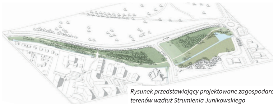
Rysunek przedstawiający projektowane zagospodarowanie terenów wzdłuż Strumienia Junikowskiego

20 sierpnia na terenie Parku rozpoczęły się prace zieleniarskie. Park jest dostępny dla Mieszkańców, a od strony wybiegu dla psów, rozstawiono tymczasowe ogrodzenie uniemożliwiające wjazd pojazdów osób postronnych, istnieje jednak możliwość wejścia na teren z obu stron. Tereny objęte pracami są wygradzone taśmami i prosimy o nie wchodzenie na obszary, na których odbywają się prace ziemne.