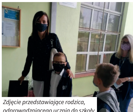
Zdjęcie przedstawiające rodzica, odprowadzającego ucznia do szkoły

Uczniowie wchodzą do szkoły różnymi wejściami o różnych godzinach, aby uniknąć tłoku. Dezynfekują dłonie, a pielęgniarka lub wyznaczony pracownik szkoły mierzy im temperaturę.