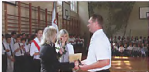
Szkoła nr 3