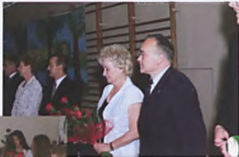
Gimnazjum nr 1