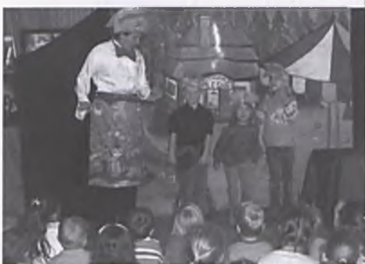
Spektakl dla dzieci Wilk i Zając