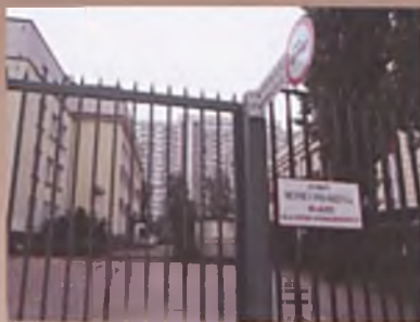
Zaraz wejdziemy do mennicy