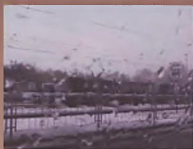
Warszawa w dniu odbioru monet i sztabek