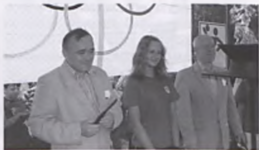
Zapalenie olimpijskiego znicza

Tak jak w ubiegłych latach, dużą atrakcją okazały się stoiska klasowe. Rodzice i uczniowie prześcigali się w pomysłach na atrakcyjność straganów, które reklamowano w gwarze wiel-