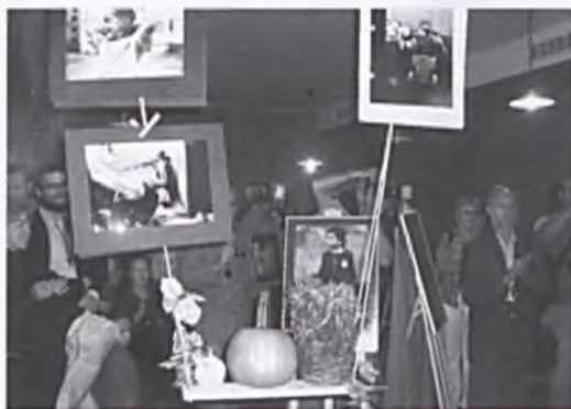
Dzieci są jak Anioły, wernisaż fotografii M. Głazika

W październiku lubońskie dzieci obejrzały w Bibliotece Miejskiej przedstawienie „Wilk i Zając”. Przed publicznością wystąpili aktorzy Studia Małych Form Teatralnych, Scenografii