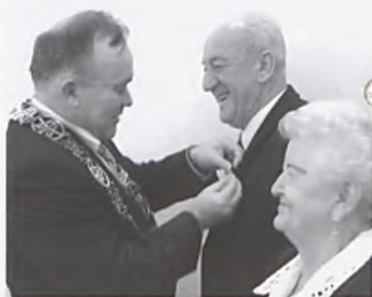
Spotkanie z okazji 50 i 60-lecia pożycia małżeńskiego