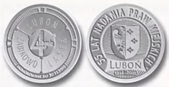
Graficzna wizualizacja lubońskiego dukata, awers i rewers

Przypominamy, że do 30 listopada 2009 roku trwa wyjątkowa akcja promująca nasze miasto. Specjalnie dla Lubonia Mennica Polska S.A. zaprojektowała i wybiła dukat lokalny 4 Lubonie. W ten sposób chcemy upamiętnić ważne wydarzenie, jakim jest pięćdziesiąta piąta rocznica uzyskania przez Luboń w 1954 roku praw miejskich. Do obiegu, na obszarze miasta, wprowadzona została mosiężna moneta o nominale 4 Lubonie. Ma ona wartość 4 złote i pełni funkcję zbliżoną do bonu towarowego (niewy-