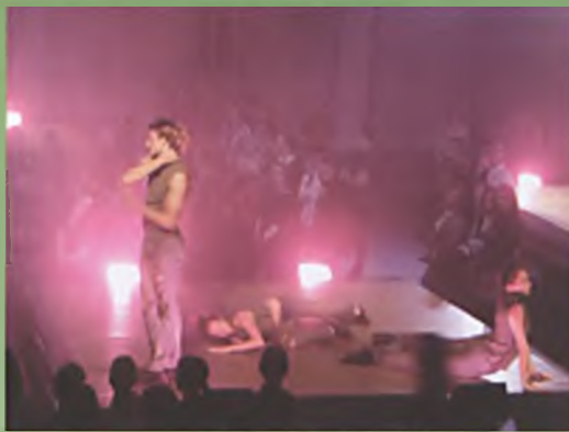
Spektakl PTT „Walka Karnawału z Postem”

Oficjalne obchody 55-lecia nadania Luboniowi praw miejskich, zorganizowane 7 października, rozpoczęły się Mszą Świętą w intencji mieszkańców miasta, koncelebrowaną przez księdza kapelana i księży proboszczów 3 lubońskich parafii. Po mszy delegacje władz miejskich, służb mundurowych i organizacji społecznych złożyły kwiaty pod pomnikiem „Znicz Pamięci Pokoju”. W ramach Święta Miasta w Gimnazjum nr 2 odbyła się uroczysta Sesja Rady Miasta Luboń. Zaproszeni goście mogli wysłuchać prelekcji Przemysława Maćkowiaka o „Luboniu na dawnych pocztówkach” oraz obejrzeć premierowy pokaz miejskiej prezentacji multimedialnej. Podczas uroczystej sesji nie zabrakło życzeń i odznaczeń. Medale „Zasłużony dla Miasta Luboń” otrzymali Honorowi Dawcy Krwi „Luboniana” oraz luboński odział PTTK. Obecny na sesji jubilat, mieszkańcom urodzonym