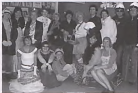
Nauczyciele spróbowali swoich sił w aktorskim rzemiośle