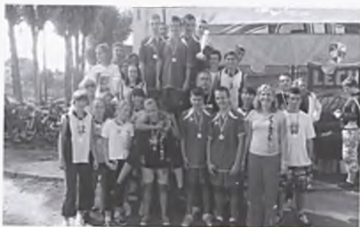
Uczestnicy mistrzostw w biegach przełajowych

Od 5 października 2009, w Gimnazjum nr 2,