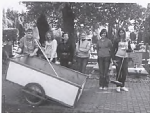
Lokalni patrioci - porządkowanie żołnierskich grobów