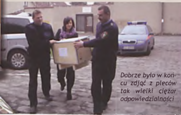
Dobrze było w końcu zdjąć z pleców tak wielki ciężar odpowiedzialności