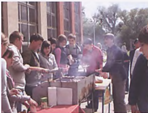
Uczestnicy Dnia Patrona na szkolnym boisku

23 maja w Gimnazjum nr 1 w Luboniu obchodzono Dzień Patrona. Po Mszy św. uczniowie wzięli udział w festynie, który odbył się na boisku szkolnym. W trakcie imprezy rozegrano mecz piłki nożnej między uczniami i sponsorami oraz przeprowadzono finał Szkoły Myślenia, w którym uczniowie prezentowali swoje projekty. Odbył się także występ koła teatralnego i szkolnych zespołów muzycznych – Makabja i Akcent. Gwiazdą wieczoru był raper Mezo, którego koncert cieszył się wielkim zainteresowaniem.