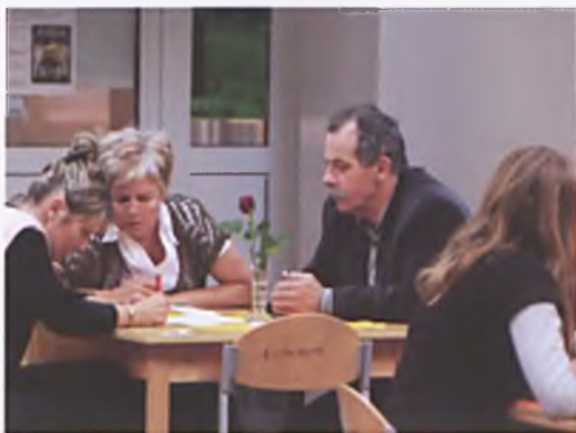
Zmagania z polską ortografią