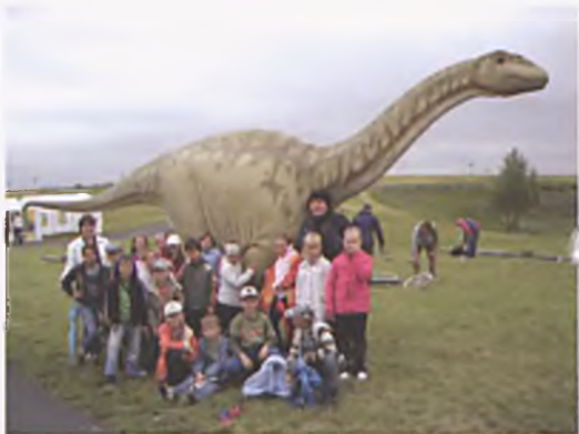
Model dinozaura, dodatkowa atrakcja Dnia Dziecka

Na najmłodszych mieszkańców miasta czekały różnorodne atrakcje. Na specjalnie przygotowanym stoisku dzieci zostały wprowadzone w tajniki fizyki, prowadziły obserwacje i doświadczenia, by w sposób łatwy i przyjemny zrozumieć często skomplikowane teorie naukowe. Każdy mógł spróbować swoich sił w grze w minigolfa oraz udoskonalić umiejętności gimnastyczne na dmuchanych urządzeniach. Wiele radości sprawiło dzieciom spotkanie z bohaterami kreskówek,