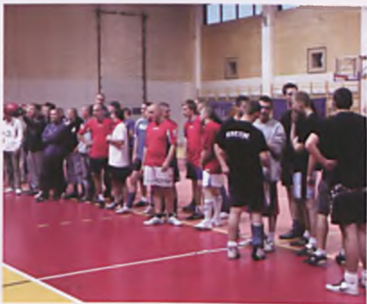
Kibice przed piłkarskimi zmaganiem

Osiem drużyn z Wielkopolski uczestniczyło w rozegranym na hali widowiskowo-sportowej w Luboniu turnieju Fanklubów Lecha Poznań, w futsalu. Ci, którzy zazwyczaj dopingują swoich ulubieńców z trybun stadionów musieli pokazać, że arkaną futbolu nie są im obce. Zawodnicy wykazywali się wielkim zaangażowaniem i ambicją w grze. Mecze były bardzo wyrównane i grający kibice Lecha wykazali się także całkiem niezłymi umiejętnościami. ■