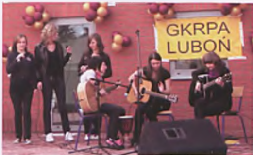
Występ podczas festynu Zdrowo-Sportowo-Bezalkoholowo

7 czerwca 2009 w godzinach 14.00-16.30 w ramach festynu Zdrowo-Sportowo-Bezalkoholowo odbył się przegląd piosenek i tańców. Brało w nim udział 39 uczestników z lubońskich szkół i przedszkoli. Każdy uczestnik losował nagrodę oraz częstował się lubońską delcją (ciastko, które wygrało w konkursie świetlic środowiskowych), pączkiem i sokiem. Rodzice otrzymali symboliczną różę, w podziękowaniu wraz z życzeniami dalszych sukcesów ich pociech. Każdy występ był nagradzany wielkimi brawami. Sponsorami