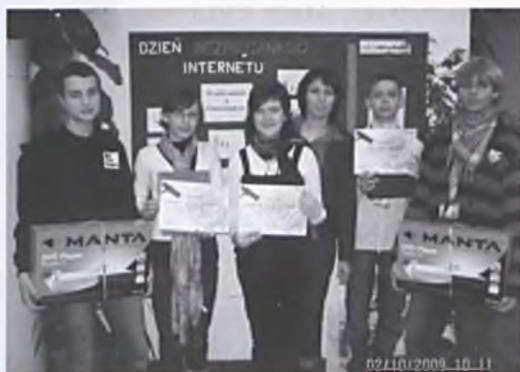
Nagrodzeni uczniowie z lubońskich szkół

W kategorii Szkół Gimnazjalnych drużyny z Gimnazjum nr 2 zajęły miejsca na podium. Druga i trzecia nagroda jaką otrzymali uczniowie jest powodem do dumy zarówno dla szko-