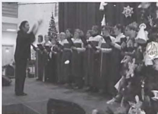
Nagrodzeni uczniowie z lubońskich szkół