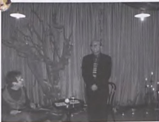
Spotkanie ze znanym aktorem Arturem Barcisiem w Bibliotece Miejskiej w Luboniu