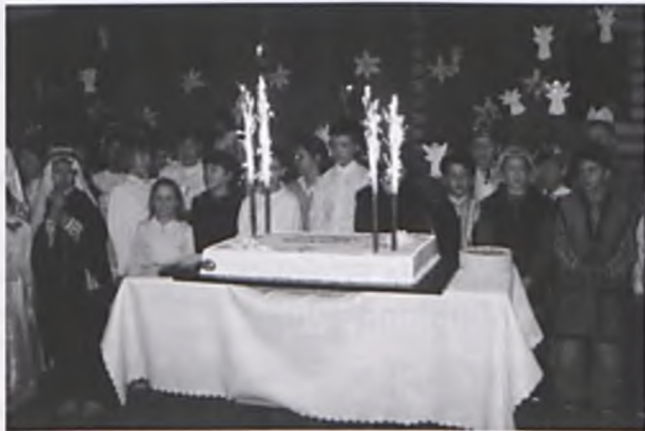
Zimowe spotkanie z Babciami i Dziadkami w SP 4