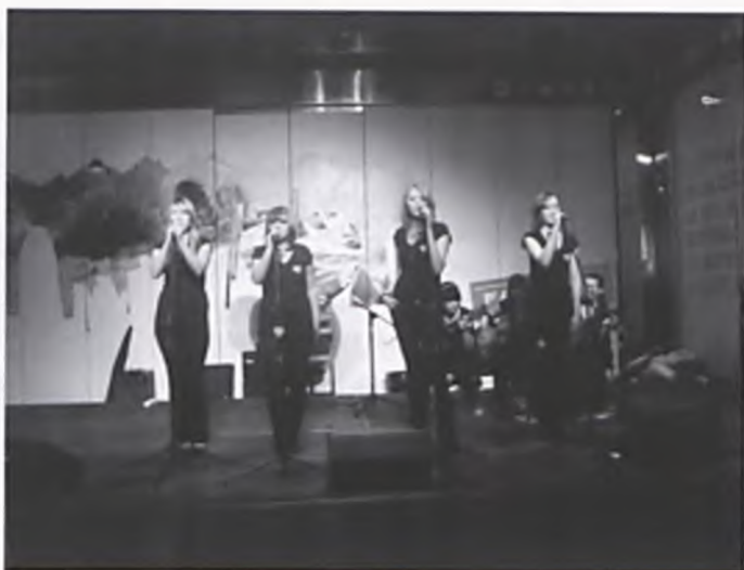
Zespół Akcent - Orkiestra Świątecznej Pomocy