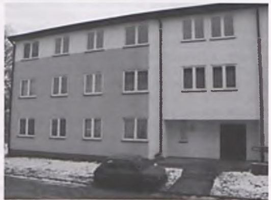
Budynek przy ulicy Źródlanej

Zaskakująco szybki termin realizacji inwestycji możliwy był, dzięki zastosowaniu nowatorskich technologii wykonania – domy wybudowano w konstrukcji szkieletowej. ■