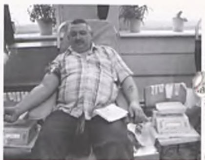
W akcji pobierania krwi wzięło udział 140 osób

Sponsorami 42 akcji poboru krwi byli: Urząd Miasta Luboń, „Ziołolek” Poznań, Firma „Dra-