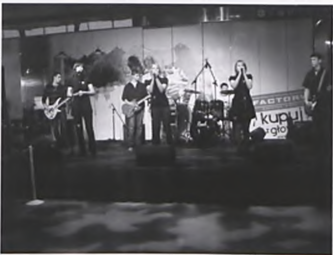
Zespół Makabia - Orkiestra Świątecznej Pomocy

dejmowania z uczniami działań o charakterze badawczym, zarówno w naukach matematyczno - przyrodniczych, jak i humanistyczno - społecznych, poprzez realizowanie projektów i organizowanie szkolnych festiwali nauki. W „Szkoła Myślenia” stawiamy na umiejętność rozumowania, zadawania pytań badawczych, rozwiązywania problemów oraz wykorzystania wiedzy w praktyce. Program realizowany jest w ramach prowadzonej od sześciu lat akcji „Szkoła z klasą”.