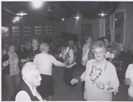
Walentynkowa zabawa w bibliotece