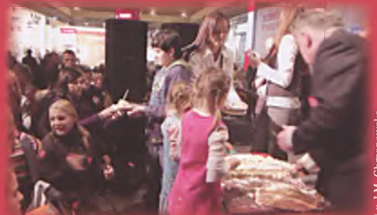
Zamiast „Światelka do nieba” słodki poczęstunek

Orkiestry pozwolą udzielić wsparcia ośrodkom podstawowej opieki zdrowotnej w celu wcześniejszego wykrywania nowotworów poprzez zakup odpowiednich ultrasonografów (szacunkowo około 3 aparatów na każde województwo) oraz pomóc osiemnastu ośrodkom onkologii i hematologii dziecięcej w celu uzupełnienia najbardziej potrzebnej aparatury diagnostycznej i leczniczej. W czasie XVII finału WOŚP została przeprowadzona licytacja przedmiotów, która zasilila konto akcji w kwocie 1.193,00 zł. Wśród licytowanych przedmiotów największym wzięciem cieszyły się: piłka z podpisami piłkarzy KKS Lech Poznań ofiarowana przez radną Rady Miasta Luboń