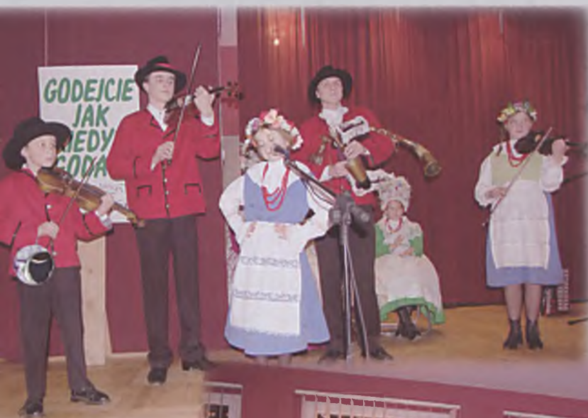
Kapela Kozłary ze Stęszewa