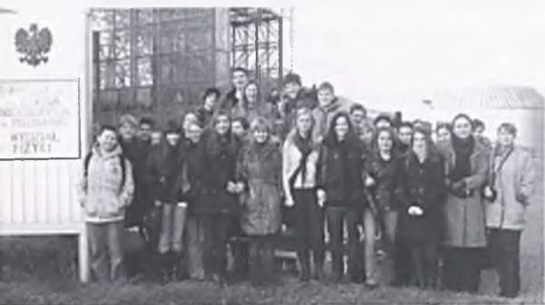
Uczestnicy konferencji naukowej „Blżej klimatu”

zmian w środowisku. Organizatorzy przywitani nas projekcją filmu poświęconego w całości zmianom klimatu na naszej planecie przygoto-