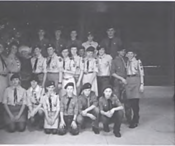
Młodzi statyści na deskach Teatru Wielkiego

Wielką radością dla uczniów, ich rodziców oraz nauczycieli Gimnazjum nr 1 były występy naszych gimnazjalistów w „Wigiliach Polskich” wystawianych w Teatrze Wielkim w dniach 14 – 21 grudnia 2008 r. Dwa razy dziennie nasi uczniowie grając role harcerzy występowali przed publicznością.