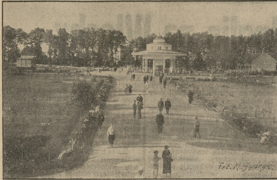
PROMENADA I PIJALNIA WÓD W MORSZYNI