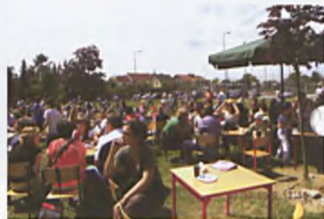
Dziękuję Ci Mamo!