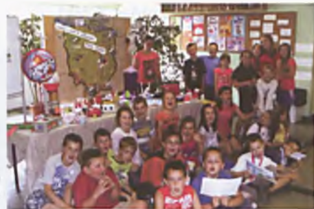
Dokąd i czym w wakacyjną podróż marzeń?