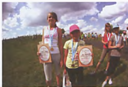
Biegać każdy może