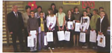
10 urodziny Omnibusa miasta Luboń