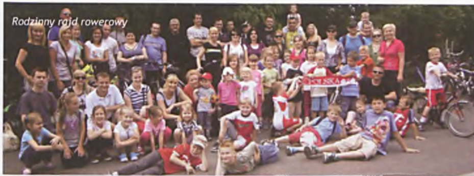
Rodzinny rajd rowerowy