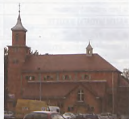
Kościół pw. Bł. Jana Pawła II

W lubońskich parafiach, jak w całej diecezji, następują inne zmiany wikariuszowskie. Można o nich przeczytać na stronach internetowych archidiecezji poznańskiej. ■