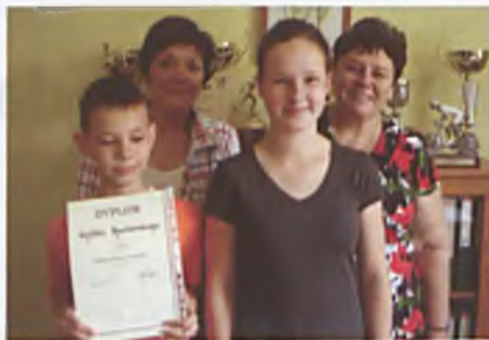
Laureaci konkursu ekologicznego