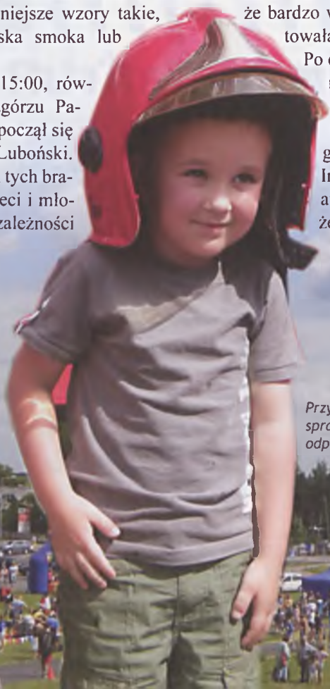
Przy stoisku strażackim można było sprawdzić, czy kariera strażaka będzie odpowiednia.

Impreza upłynęła w bardzo miłej atmosferze. Miejmy nadzieję, że za rok będzie podobnie! ■