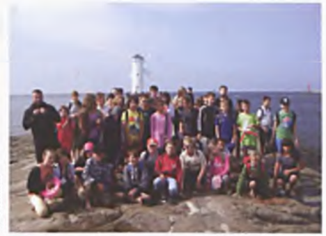
Wycieczka nad morze