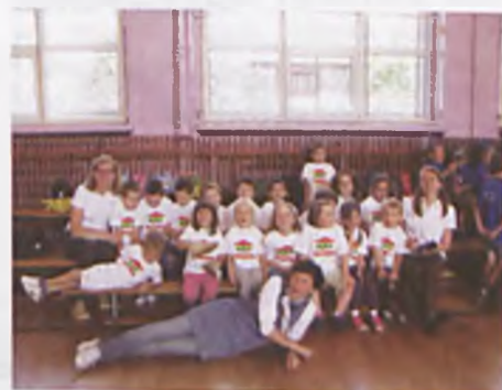
W Przedszkolu Czarodziejski Ogród

Dzieci prezentowały piosenki i tańce. Odbyło się wiele konkurencji sportowych, kiermasz i loteria. Wspaniała pogoda umiliła dzień.