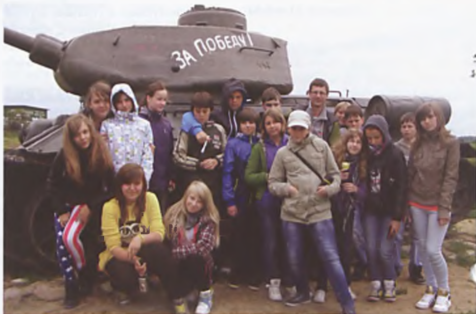
Na wycieczce w Sierakowie

Finał tegorocznej edycji Konkursu Ekologicznego odbył się dnia 5 czerwca br. w Gimnazjum nr 1 w Luboniu. Do etapu miejskiego zakwalifikowało się troje