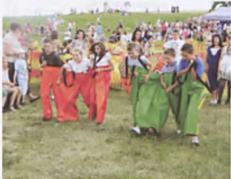
Zabawa na Wzgórzu Papieskim w Luboniu

D nia 27 maja br. na Wzgórzu Papieskim w Luboniu odbyła się impreza z okazji Dnia Dziecka. Wydarzenie zostało zorganizowane przez Urząd Miasta Luboń, Luboński Ośrodek Sportu i Rekreacji, Gimnazjum nr 2 w Luboniu, Ośrodek Kultury w Luboniu. W organizacji imprezy pomagał Klub Biegacza Luboń. Od godziny 14:00 do 18:00 dzieci mogły korzystać z wielu atrakcji oraz brać udział w konkursach i zawodach.