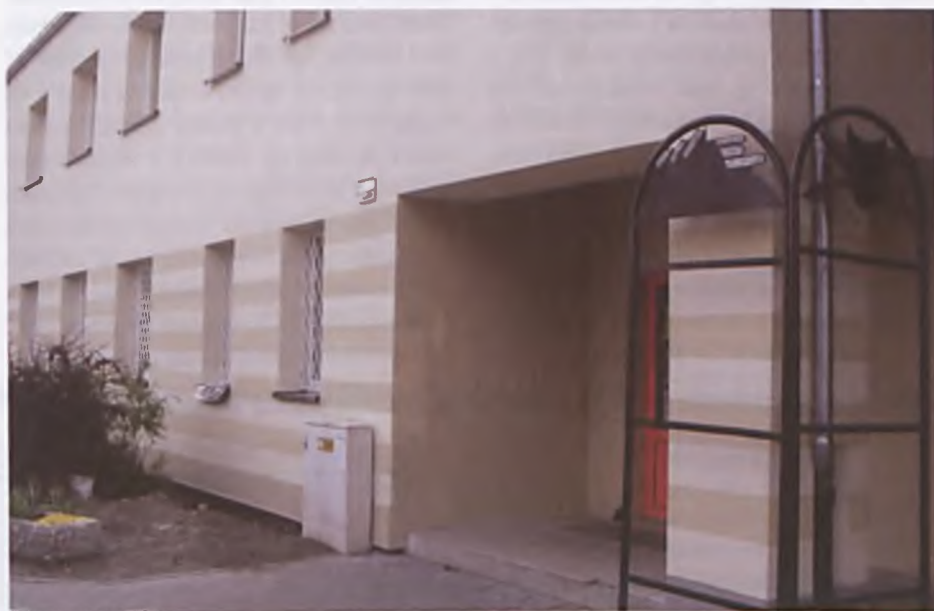
Nowa elewacja Biblioteki Miejskiej przy ulicy Żabikowskiej

Rozpoczęta w ubiegłym roku termomodernizacja budynków użyteczności publicznej obejmuje swym zasięgiem przede wszystkim nasze szkoły i bibliotekę.