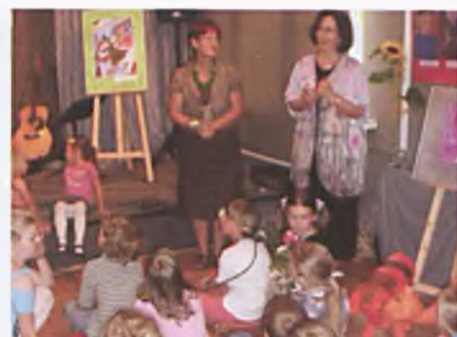
Nasze kolorowe wędrówki - wernisaż