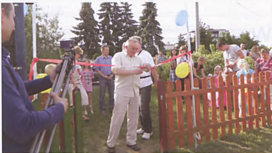
Burmistrz otwiera nowy plac zabaw w Luboniu

„Autostradowa Dolinka” – taką nazwę otrzymał nowy plac zabaw przy ul. Chopina w Luboniu. Plac ten powstał przy porozumieniu GDKDiA, AWSA oraz Urzędu Miasta Luboń. Uroczyste otwarcie z inicjatywy okolicznych mieszkańców nastąpiło w sobotę 26 maja o godzinie 17:00. Część oficjalna rozpoczęła się tradycyjnym przecięciem wstęgi. Później były, za-