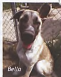
Zwierzęta na zdjęciach powyżej są mieszkańcami „Przituliska”.

działają jedynie od 3 do 5 tygodni, później należy powtórzyć ich stosowanie.