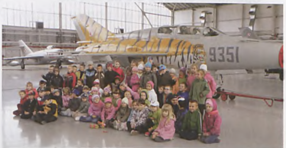
W bazie lotniczej w Krzesinach.