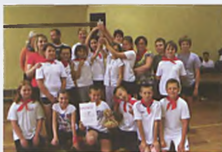
Dzień Dziecka na wesoło i na sportowo!