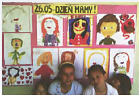
Konkurs świetlicowy z okazji Dnia Matki