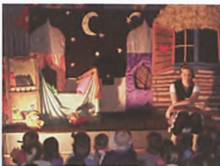
Noc i jej przyjaciele

Taki tytuł nosił wernisaż, który miał miejsce 17 czerwca w Galerii na Regale. Wernisaż był prezentacją twórczego dorobku dzieci uczęszczających w roku