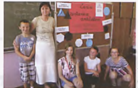
Zanim zostaniesz architektem