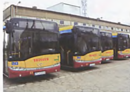
Nowe autobusy w zajezdni Translubo

nowych autobusów jest w większości sfinansowany z pozyskanych przez miasto środków europejskich z dotacją 1 miliona złotych z naszych podatków - z budżetu miasta - mówi Dariusz Szymt - Burmistrz. Zakup nowych autobusów zasila nasz tabor i obniża jego wiek. To ważne, gdyż stawiamy na bezpieczeństwo podróżnych i sprawne realizowanie rozkładu jazdy, który realizujemy w ramach systemu komunikacji aglomeracyjnej - dodaje Burmistrz.