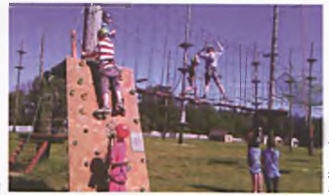
W parku linowym