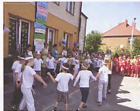
Grupa Kropelki podczas występu