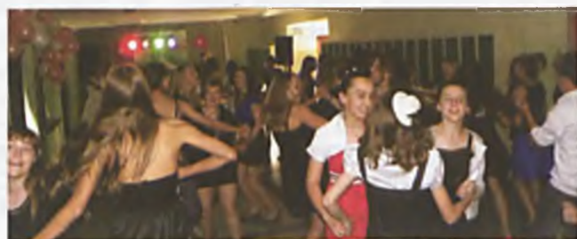
„Niech żyje bal...”

Uczniowie naszej szkoły wzięli udział w II