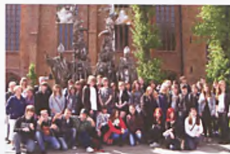
II „C” i III „C” w Kołobrzegu