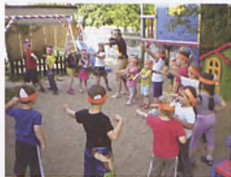
Indiańska Majówka w Przedszkolu Chatka Skrzatka