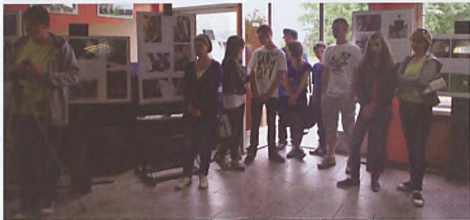
Uczestnicy wystawy w Ośrodku Kultury w Luboniu