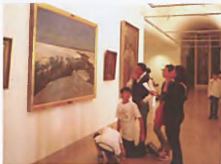
Comenius w poznańskim Muzeum Narodowym