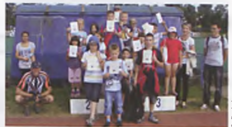
Świetlica na zawodach lekkoatletycznych na AWF