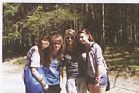
Wycieczka do Zakopanego