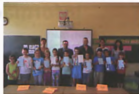
How do you spell

Dobiegł końca rok szkolny 2013/14. Dla najmłodszych aktorów koła teatralnego języka angielskiego była to doskonała okazja, aby po raz ostatni w tym roku zaprezentować swoje aktorskie umiejętności. 18 czerwca odbyła się premiera "Kopciuszka". Serdecznie dziękuję wszystkim uczestnikom koła teatralnego za trud włożony w przygotowanie przedstawień oraz za