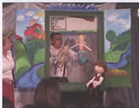
Lekcja o Polsce