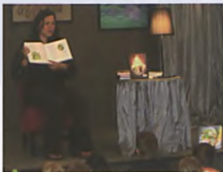
Spotkanie autorskie dla dzieci