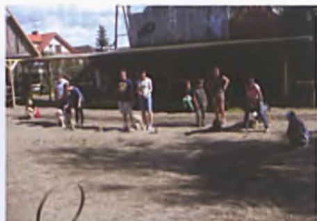
Czworonożni uczestnicy w rywalizacji

Pieski uczestniczyły w konkurencjach, które nie stanowiły dla nich dużego wyzwania: spacer slalomem, przejście po ruchomej kładce, skok przez płotek, przeskok przez obręcz, przejście przez okno oraz przez wlot w beczce. Wszystkiemu bacznie przyglądali się jurorzy, którzy oceniali ich zmagania. Po werdykcie ogłosili zwycięzców i wręczyli nagrody: I miejsce