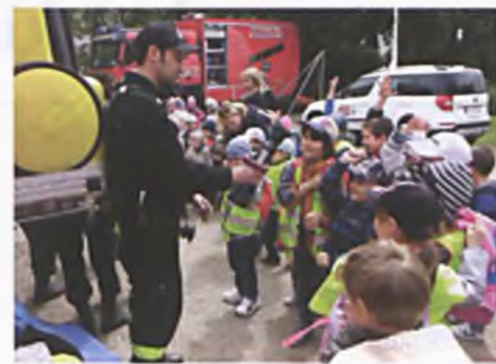
Przedszkolaki na pikniku strażackim

Wyprawa do kina zawsze jest dla dzieci miłym przeżyciem. Uczestniczyły w filmowym festiwalu pod hasłem: „Pali się”. Znani bohaterowie dziecięcych kreskówek przybliżyli dzieciom zawód strażaka, oraz nauczyli podstawowych zasad zachowania się w momencie zauważenia pożaru. Ta lekcja byłaby jednak niepełna,