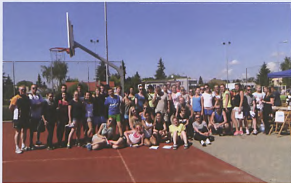
Przez ponad 10 godzin mieszkańcy Lubonia bawili się na festynie sportowo - rekreacyjnym zorganizowanym na boisku Orlik

1 czerwca w hali LOSIR-u jak co roku o tej porze odbył się kolejny już VII turniej z okazji Dnia Dziecka w tenisie stołowym zorganizowany wspólnie przez LOSIR i LKTS Lubanta Luvana Luboń. Tak jak w poprzednich latach udział w turnieju był bezpłatny a każdy z zawodników uczestniczących w turnieju otrzymał nagrodę lub upominek, którym dzięki hojności sponsorów dzieci zostały obdarowane. Dla najlepszych zawodniczek i zawodników przygotowano puchary, medale oraz dyplomy. VII Turniej Tenisa Stołowego z okazji Dnia Dziecka rozegrany został w sześciu kategoriach wiekowych: Dziewczynki i chłopcy rocznik 2004 i młodsze,