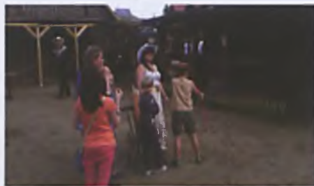
Dzień Dziecka z Kowbojami

W Kowbojskim Miasteczku w Luboniu 15 czerwca 2014 roku odbyła się Charytatywna Wystawa Psów - „Nasz Wierny Przyjaciel” zorganizowana na rzecz schroniska dla zwierząt w Przyborówku. Celem dobroczynnej akcji była zbiórka karmy, produktów oraz artykułów potrzebnych