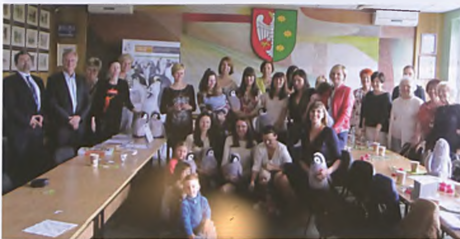
Spotkanie podsumowujące w Urzędzie Miasta

D ziecko i praca – i jak to pogodzić? Jak być jednocześnie efektywnym pracownikiem i dobrym rodzicem? Czy Luboń jest przyjaznym miejscem dla rodziców i dzieci?