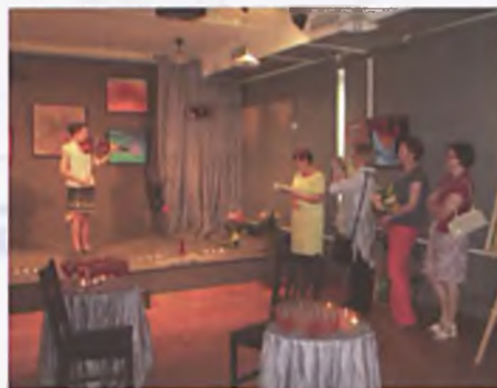
Obrazy mówią o nas