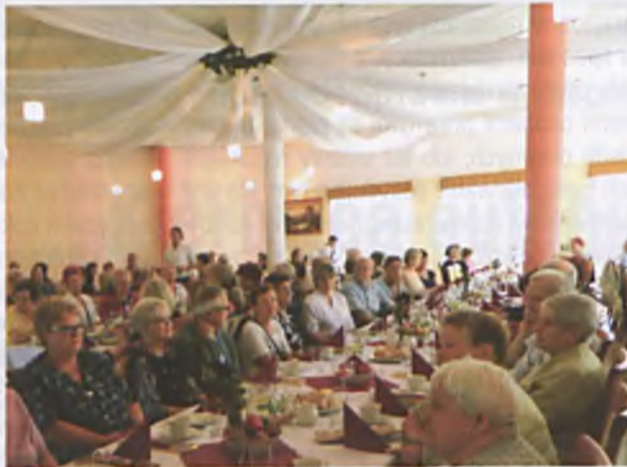
Lubońskie obchody Światowego Dnia Inwalidy i Osób Niepełnosprawnych w dniu 10 czerwca 2014 roku w Restauracji Lacerta.