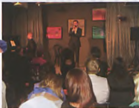
Recital "W ramionach mych"