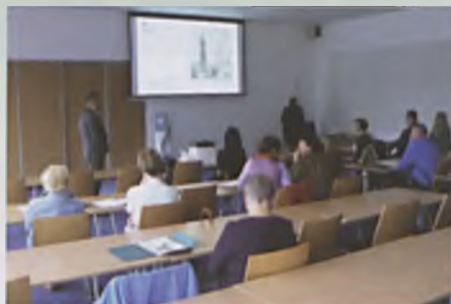
Spotkanie dotyczące przebudowy Parku Siewcy

Uzyskane od mieszkańców uwagi i sugestie zostaną przeanalizowane i z pewnością część pomysłów zostanie uwzględniona w projekcie.