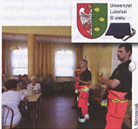
Strażacy-ratownicy, goście ostatniego w tym roku wykładu dla słuchaczy ULTW