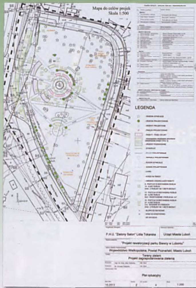
Mapa do celów projekt Skala 1:500