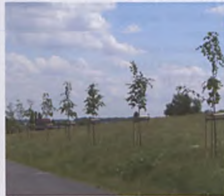
Na terenie Parku Papieskiego oraz wzdłuż dróg nasadzono 85 szt. drzew