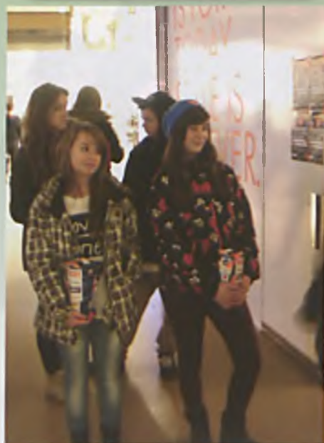
Wolontariusze czekają na rozliczenie