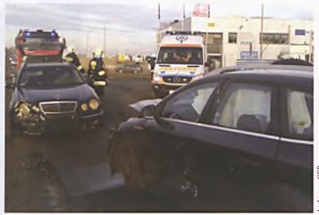
Wypadek w Komornikach na ul. ks. Wawrzyniaka 4

21.12 – Komorniki, ulica ks. Wawrzyniaka wypadek trzech samochodów osobowych, w którym ranne zostały 4 osoby w tym jedno dziecko,