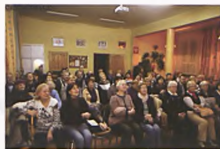
„Za mundurem panny sznurem”

polskiego to szczególna okazja, by uczcić bohaterów, którym zawdzięczamy wolną Polskę. W tym dziele mają swój udział również lubonianie. Znamy ich z publikacji prasowych, książek i filmów.