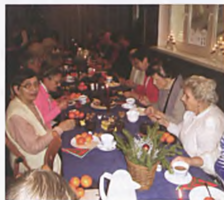
Wigilia w Promyku

To tytuł tradycyjnego już wieczoru kolęd, który co roku na początku stycznia odby-