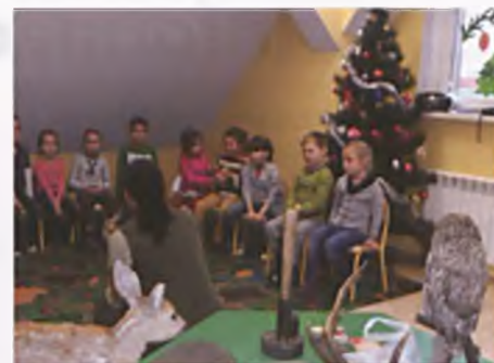
Z lasem za pan brat

ponatów i pomocy. Zerówkowicze dowiedzieli się między innymi jak odróżnić królika od zająca, czym się żywią dziki, sowy i inne leśne zwierzęta, usłyszeli prawdziwe odgłosy samy, dzięcioła, cietrzewia, puszczyka i wielu innych. Pan leśnik opowiadał o drzewach, a pani leśnik o zwierzętach. Dzieci poszerzyły swoją wiedzę o nowe trudne pojęcia. Dowiedziały się czym mierzy się drzewo. Teraz będą wiedziały, że średnicomierz czyli kłupa to przyrząd do