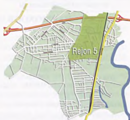
Rejon 5 został zaznaczony kolorem zielonym

M. P.: Moje zamiłowania zmieniają się zależnie od wielu czynników, jednak w obszarze moich zainteresowań zawsze pozostaje sport. Lubię także zwierzęta i wyjazdy.