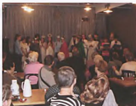
Jasełka w „Promyku”