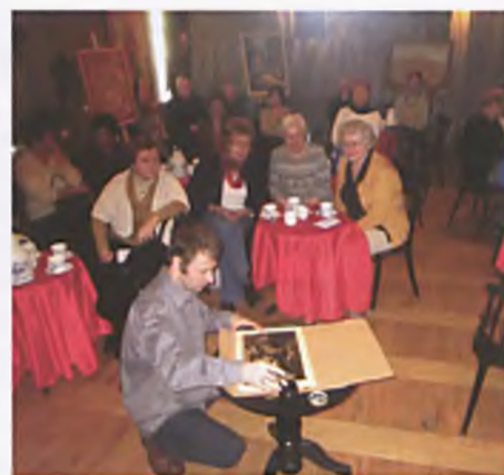
LUTW - Nostalgia