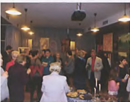
Wyobrażenia ponad wszystko