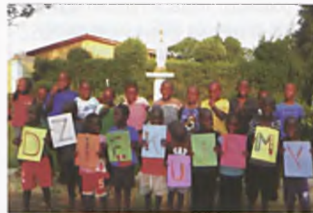
Podziękowania z Kamerunu