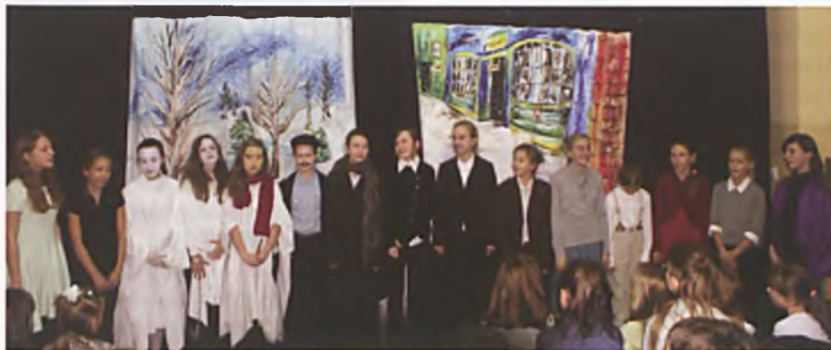
Na deskach szkolnego teatru -Opowieść wigilijna