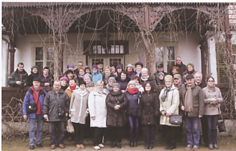
Uczestnicy wycieczki przed dworem w Koszutach