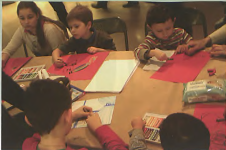
Warsztaty plastyczne dla najmłodszych przygotowane przez Ośrodek Kultury w Luboniu