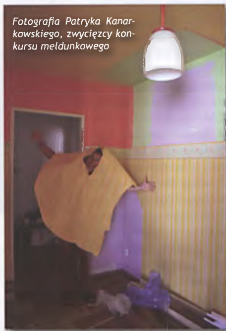
Fotografia Patryka Kanarkowskiego, zwycięzcy konkursu meldunkowego