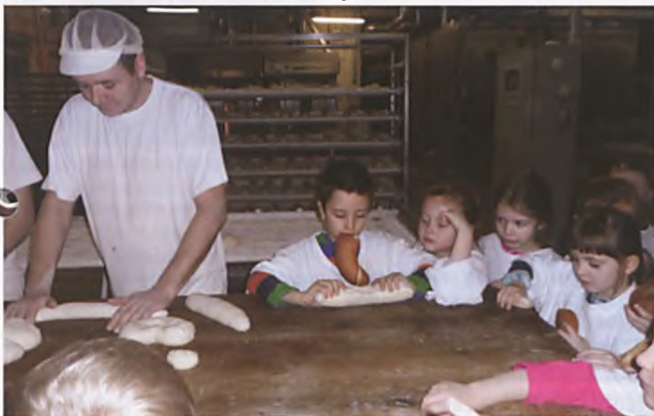
Z wizytą w piekarni