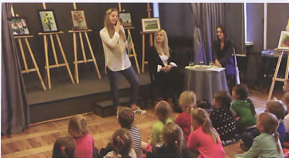
Cały Luboń czyta dzieciom