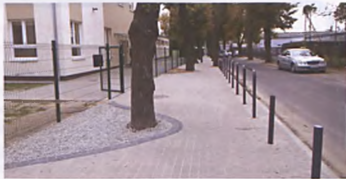
Teren przed Szkołą Podstawową nr 1 wygląda naprawę ładnie.

5. W dniu 19.10.2015r. podpisano umowę na „Wykonanie robót budowlanych – instalacyjnych dostosowujących pomieszczenia dawnego hotelu robotniczego Zakładów Luvena S.A. przy ul. Romana Maya 1b w Luboniu, do potrzeb Dziennego Domu SENIOR-WIGOR”.