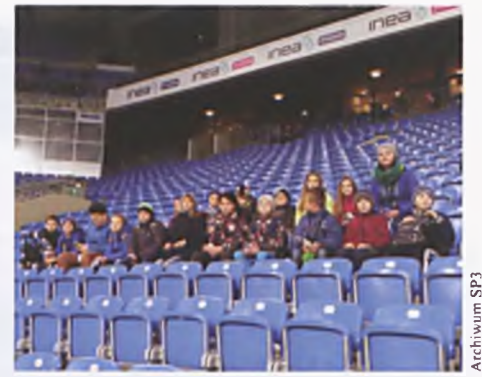
Na meczu Lecha Poznań

Uczniowie naszej szkoły, coraz bardziej interesują się piłką nożną. Dlatego tak wielkim zainteresowaniem cieszą się wyjazdy na mecze naszej najlepszej wojewódzkiej drużyny, czyli Lecha Poznań. 17 października 2015 roku najwięksi piłkarzy zapaleńcy pojechali z dwójką opiekunów obejrzeć na żywo mecz Lech Poznań – Ruch Chorzów. Warto wspomnieć, że mecze dla uczniów są okazją do wspólne-