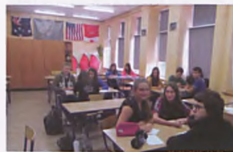
Europejski Dzień Języków

W poniedziałek 28.09.2015 roku obchodziliśmy w naszej szkole Europejski Dzień Języków. Uczniowie mieli okazję obejrzeć wystawę plakatów wykonanych własnoręcznie w ramach konkursu „Poznajemy świat przez języki”. Punktem centralnym obchodów szkolnych Europejskiego Dnia Języków była natomiast akcja ogólnoszkolna Dyktando w Trzech Językach, w którym wybraliśmy naszych największych poliglotów szkolnych. Drużyny klasowe miały za zadanie napisać trzy dyktanda na temat wydarzeń sportowych: po polsku, angielsku oraz w trzecim nauczonym przez siebie w szkole