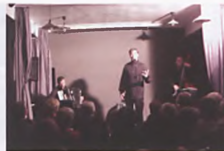
Muzyka przy samowarze