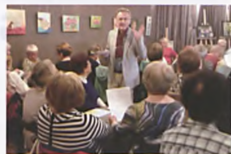
Z ortografią na wesolo