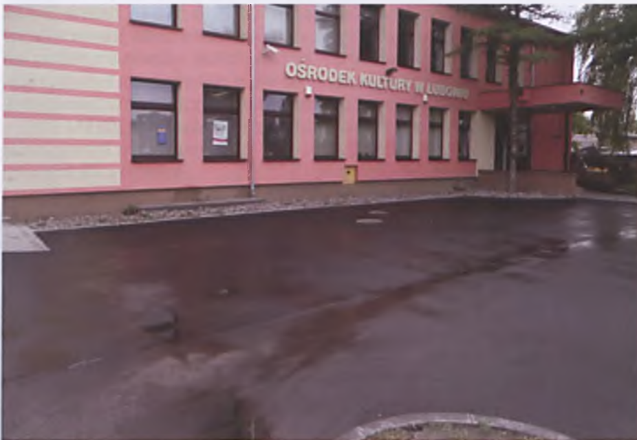
Nowa nawierzchnia przed Ośrodkiem Kultury