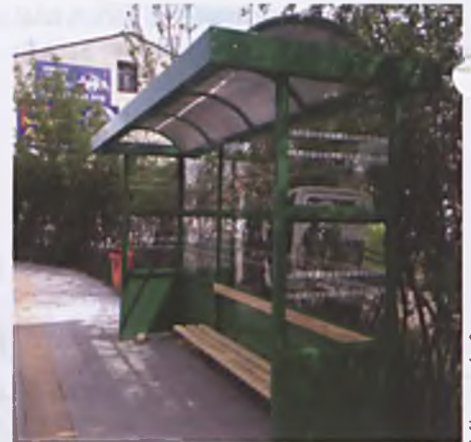
Nawierzchnia w okolicach przystanków