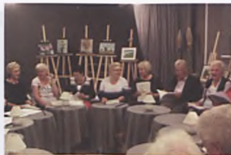
Śpiewać każdy może