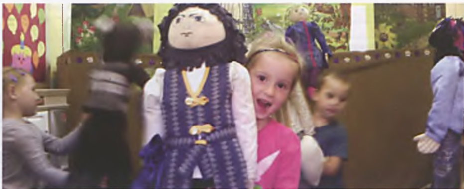
Zabawa w przedszkolu

W minionym miesiącu mieliśmy także okazję obejrzeć spektakl teatralny, w wykonaniu aktorów teatru lalek, pod tytułem „Dzielny Tomek, kompan Reksia”. Przedstawienie ukazywało perypetie biednego pastuszka, który pomimo swej pracowitości został okrutnie oszukany przez skąpego kramarza. Z pomocą przyszedł mu ptaszek, który ofiarował mu magiczny kufer pełen skarbów. Podczas spektaklu mali widzowie