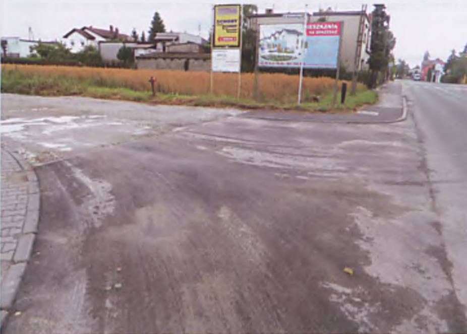
Wjazd na ul. Kurowskiego