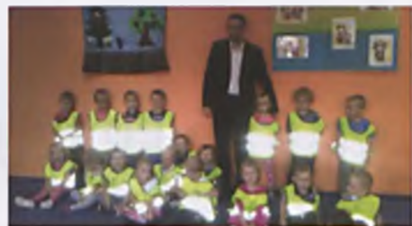
W trosce o bezpieczeństwo dzieci na drogach

Dnia 24.09.2015r. ważnym wydarzeniem dla naszych przedszkolaków była wizyta policjantów. Tematem numer jeden było bezpieczeństwo dzieci na drogach, lecz nie obyło się bez wielu pytań maluchów dotyczących codziennej pracy policjanta. Ostatni dzień września był uroczystym świętem dla każdego chłopca. Dziewczynki przygotowały dla swoich kolegów z grupy laurki oraz drobne upominki.