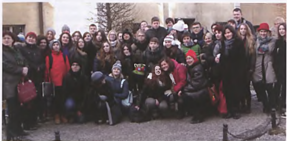
Goście z Hiszpanii, Francji, Niemiec, Rumunii i Włoch z polskimi przyjaciółmi w Poznaniu

W ramach spotkania dzielił się obserwacjami i doświadczeniami. Uczniowie