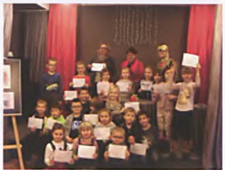
Czytanie bajek dla dzieci