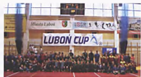
Intensywny weekend piłkarski w LOSiR