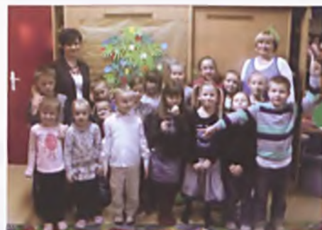
Spotkanie z absolwentami

Od stycznia nasze przedszkole oficjalnie bierze udział w kampanii „Cała Polska Czyta Dzieciom”. Zostaliśmy zarejestro-