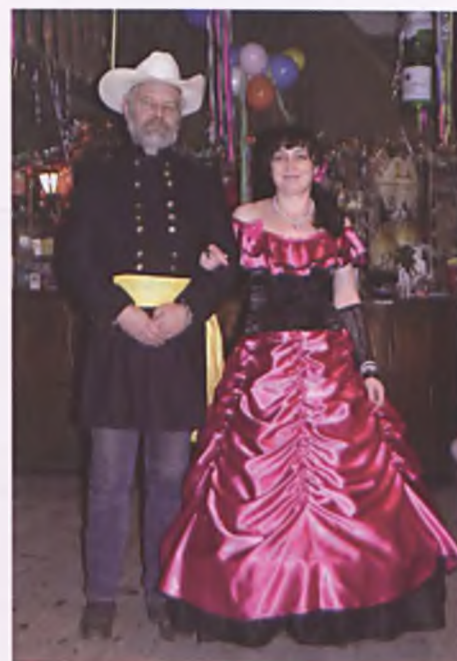
Piękna dama z Dzikiego Zachodu w towarzystwie generała Grandfathera

Osoby bardziej zafascynowane tą tradycją lub kulturą, pogłębiały i przyswajały sobie wiedzę oraz wiadomości związane z tą tematyką. Muzykę country zapewnił gospodarz – Jack, który zachęcał do zwiedzenia aresztu w towarzystwie Szeryfa. Dzieliliśmy się spostrzeżeniami, które dotyczyły wspólnie spędzonych chwil podczas całego przebiegu Balu Country.