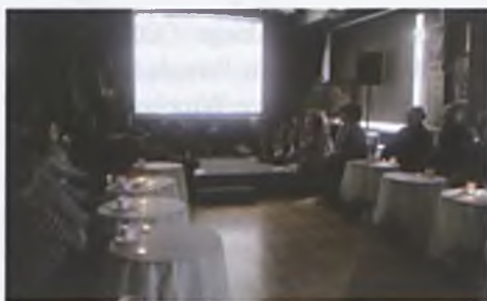
Śpiewać każdy może

- 14 maja 2016r. godz. 9.00-13.00 – prze-