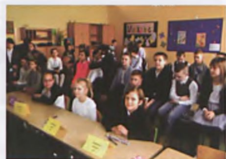
Szkolny Konkurs Języka Angielskiego "How do you spell...?"

Samorząd Uczniowski postanowił dzień pierwszego kwietnia uczcić prima aprilis przebijając się w zabawny sposób. Nawet niektórzy nauczyciele przyłączyli się do nas. Dzień żartów, to obyczaj związa-