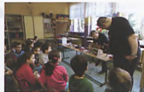
Warsztaty z elektryczności