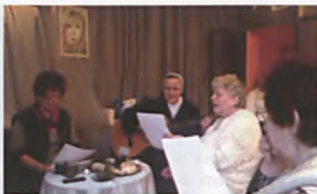
Spotkanie w Klubie Promyk