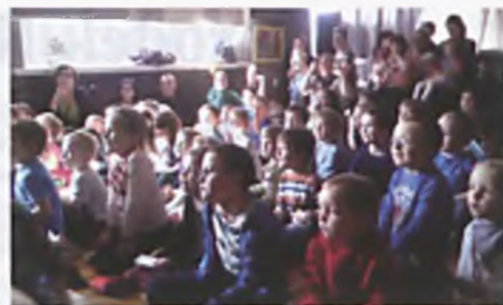
Wiosna u Kubusia Puszatka