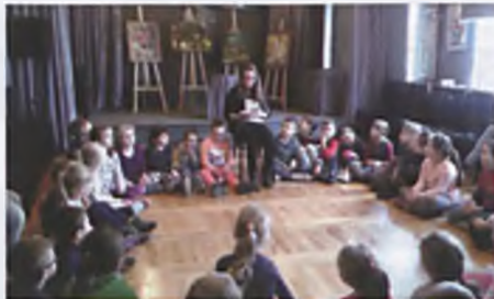
Cały Luboń Czyta Dzieciom