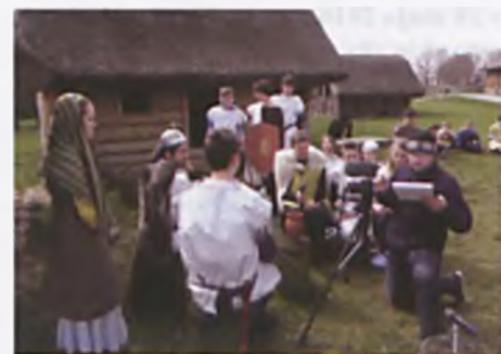
Na planie filmu "Legenda o Lubomiu"