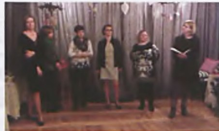
Śpiewać każdy może

nia 2016r. Bibliotekę Miejską w Luboniu. Przedszkolaki z "Czarodziejskiego Ogrodu" uczestniczyły w lekcji bibliotecznej, podczas której poznali pracowników Biblioteki, zwiedzili pomieszczenia biblioteczne i poznali tajniki wypożyczania książek. Na zakończenie wycieczki z zaciekawieniem wysłuchali bajkę o Małej Syrence.