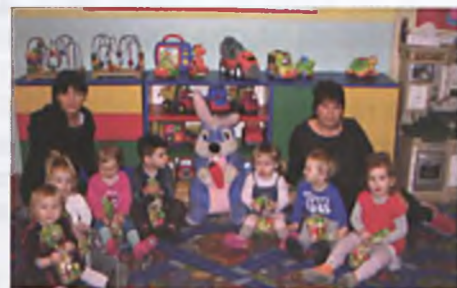
W Przedszkolu Chatka Skrzatka

W marcu poznawaliśmy świąteczne tradycje, śpiewaliśmy piosenki związane z Wielkanocą i wykonywaliśmy świąteczne dekoracje. Jak co roku, dzieci miały okazję uczestniczyć wraz z rodzicami w świąteczno-wiosennych warsztatach, w trakcie których bawiły się w rozmaite zabawy, tańczyły i brały udział w konkursach. Na zakończenie tradycyjnie wykonały wraz ze swoimi gośćmi świąteczne dekoracje, którymi ozdobiły swoje domy. Ostatnią z marcowych atrakcji był cykliczny koncert Filharmonii Pomysłów,