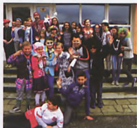
Prima aprilis w przebraniach

ny z pierwszym dniem kwietnia, obchodzony w wielu krajach świata. Polega on na robieniu żartów, celowym wprowadzaniu w błąd, kłamaniu, konkurowaniu w próbach sprawienia, by inni uwierzyli w coś nieprawdziwego. SP4