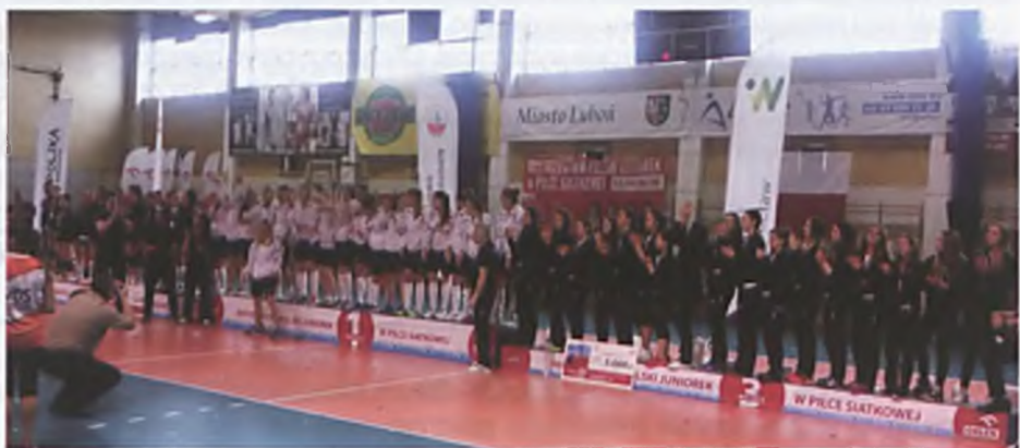
Rozdanie medali Mistrzostw Polski Juniorek