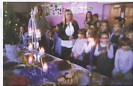
Przy wspólnym stole

15 grudnia klasy drugie wybrały się na wycieczkę do Dymaczewa Starego „Radosna twórczość” na przedświąteczne warsztaty, podczas których dzieci oswoiły się z różnymi dziedzinami sztuki. W programie rozwijaliśmy nasze talenty w ceramice, wykonując dzwonek z gliny. Ponadto szlifowaliśmy i ozdabialiśmy pod fachowym okiem choinkę oraz wykonaliśmy kartkę świąteczną. Przeszliśmy kurs pieczenia i ozdabiania