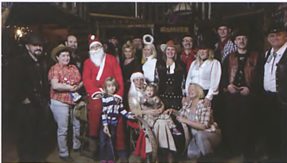
Uczestnicy Wigilii Klubowej