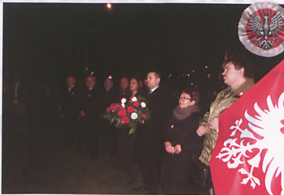
Uroczystości na skwerze pod Krzyżem Milenijnym przy pamiątkowej tablicy