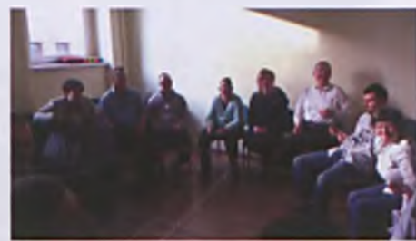
Terapia zajęciowa ma za zadanie przede wszystkim ogólnie usprawnić uczestnika

Słowa szczególnego uznania kierujemy w stronę Stowarzyszenia Wspólna Droga, którego działacze poświęcili wiele godzin, dni, miesiące, aby dać swoim podopiecznym tak wyjątkowe miejsce. Z wielkim po-