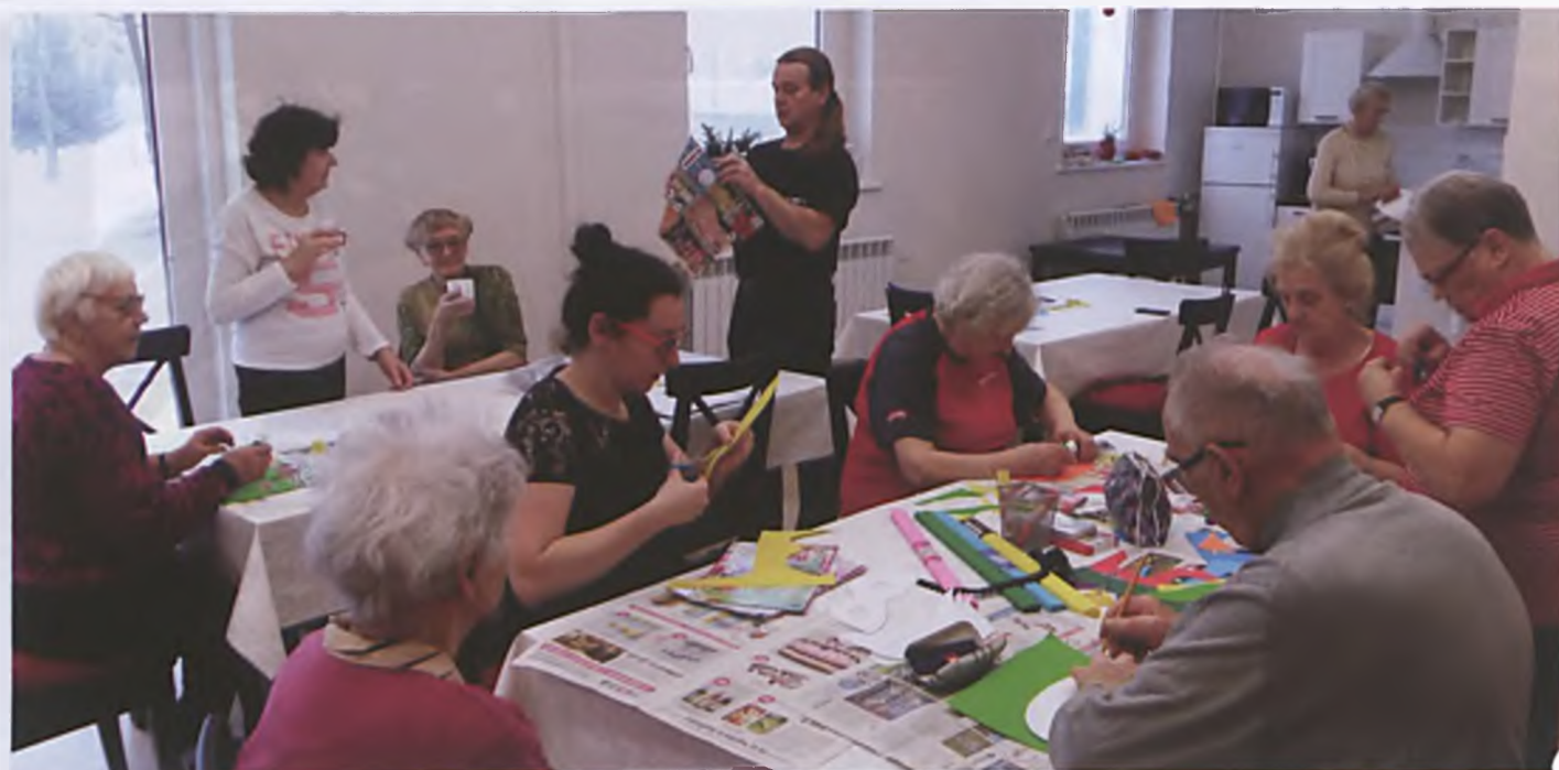
Przygotowania do balu maskowego. Każdy uczestnik robi swoją maskę, a zaprezentuje ją na balu podczas konkursu. Wygra najpiękniejsza.