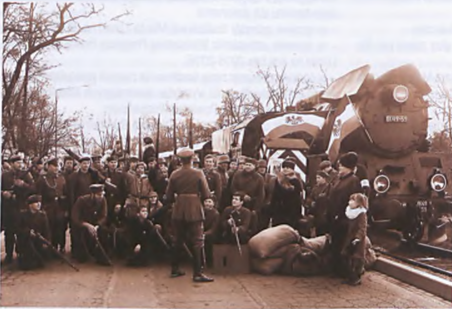
W Luboniu można było 27 grudnia 2015 roku obejrzeć inscenizację historyczną prezentującą obronę posterunku wojskowego na dworcu kolejowym zaatakowanego przez powstańców. Wzięło w niej udział prawie 50 rekonstruktorów przede wszystkim z Lubonia, Poznania, Bydgoszczy, Gubina oraz Borówca.

T owarzystwo Miłośników Miasta Lubonia przy współpracy z Turkol Turystyka Kolejowa zorganizowało w dniu 27 grudnia 2015 roku wraz z innymi stowarzyszeniami oraz instytucjami uroczystości upamiętniające 97. rocznicę wybuchu Powstania Wielkopolskiego.