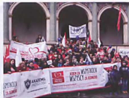
Marsz Szlachetnej Paczki, Poznań