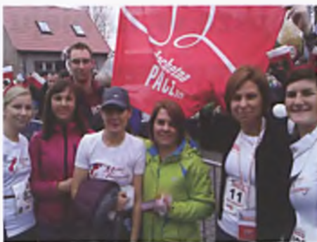
Szlachetna Paczka na Biegu Niepodległości