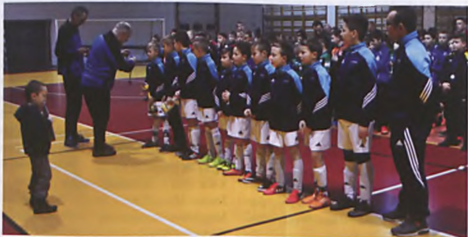
Dąbroczanka Pępowo, zwycięzca turnieju Luboń Cup