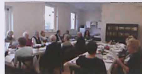
Spotkanie świąteczno-noworoczne upłynęło w miłej atmosferze.

Wciąż trwa rekrutacja do Dziennego Domu „Senior-Wigor” w Luboniu.