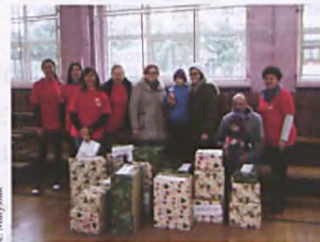
Darczyńcy z przedszkola „Kaczka Dziwaczka” w Poznaniu