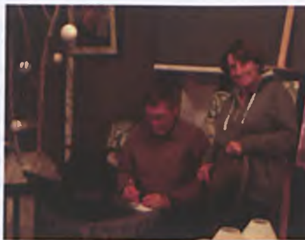
Świat na wyciągnięcie ręki