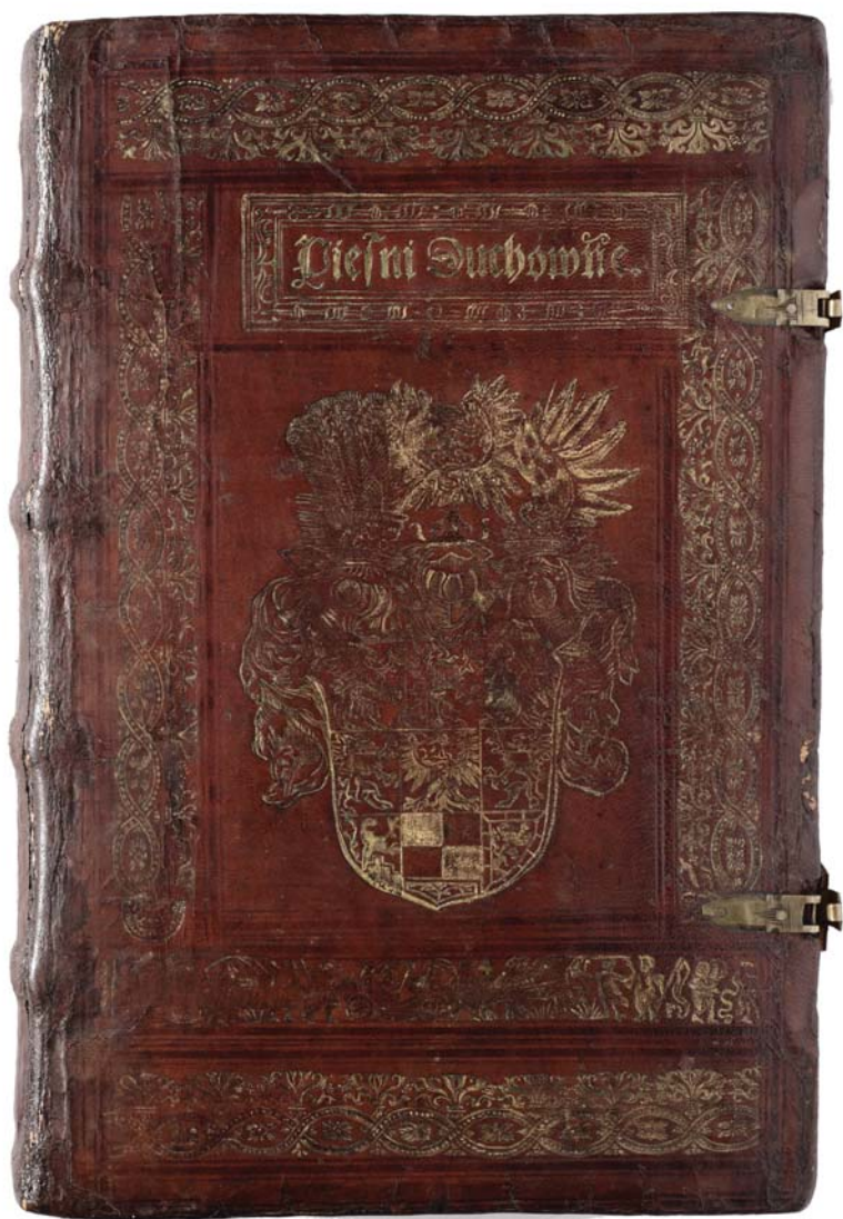
Il. 3a. Oprawa Kaspara Anglera (górna okładzina) z supereklibrisem dedykacyjnym i portretowym medalionem (w funkcji własnościowej) księcia Albrechta Pruskiego, Królewiec, 1554; zbiory Biblioteki Uniwersyteckiej w Toruniu.