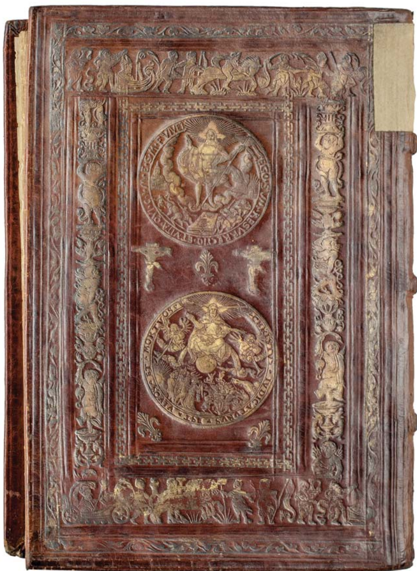
Il. 2b. Oprawa Kaspara Anglera (dolna okładzina) wykonana na zlecenie Walentego Schrecka z przeznaczeniem do księgozbioru księcia Albrechta Fryderyka, Królewiec, 1559; zbiory Biblioteki Kórnickiej. Fot. Z. Nowakowski