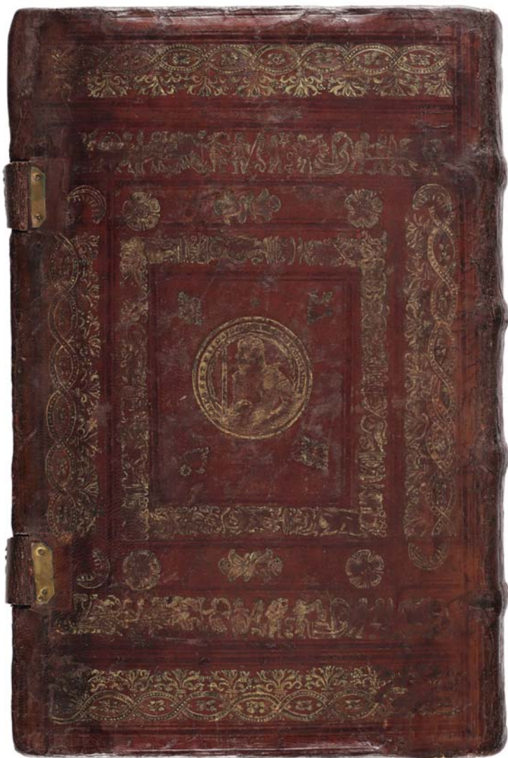
Il. 3b. Oprawa Kaspara Anglera (dolna okładzina) z supereklibrisem dedykacyjnym i portretowym medalionem (w funkcji własnościowej) księcia Albrechta Pruskiego, Królewiec, 1554; zbiory Biblioteki Uniwersyteckiej w Toruniu.