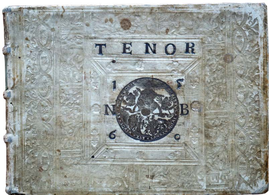
Il. 4. Oprawa Kaspra Anglera (górna okładzina) z medalionem ukazującym Sąd Ostateczny, Królewiec, 1560; zbiory Wojewódzkiej Biblioteki Publicznej – Książnicy Kopernikańskiej w Toruniu.