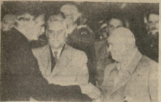
Premier Wielkiej Brytanii — Eden wita gości na Dworcu Victoria w Londynie.

Tak więc zespoły PGR podlegać będą w zasadzie wojewódzkiemu zarządom PGR, a te bezpośrednio Ministerstwu PGR.