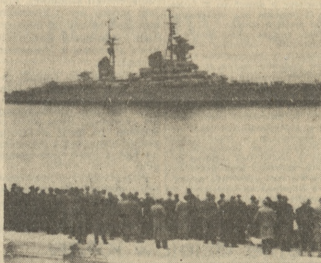
Krajoznik „Ordżonikidze” u wybrzeży Wielkiej Brytanii.