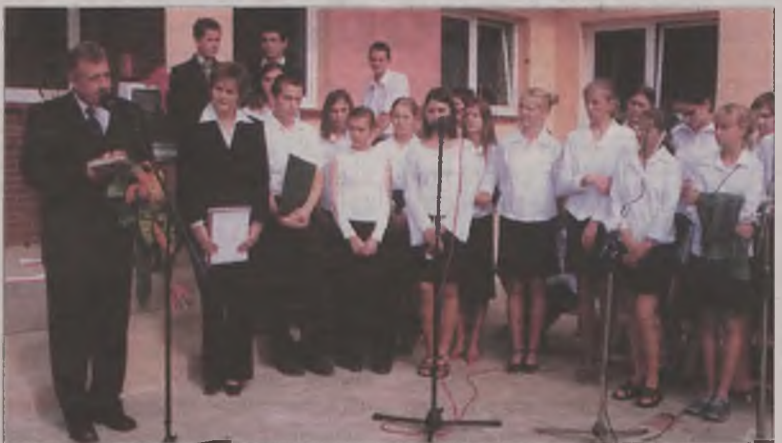
Gimnazjaliści z gm. Malanów wreszcie na swoim

Należałoby odnotować również to, że wśród uczestników uroczystości dominowały pochwały pod adresem samego obiektu, szczególnie jego przytulny nastrój i solidne wykonanie. A i nie na końcu (i słusznie) wymieniano trafną nad lokalizację szkoły.