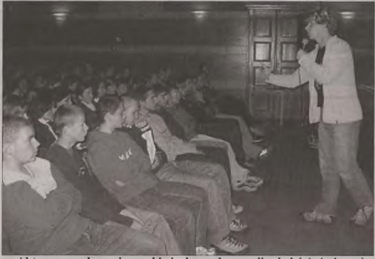
Aktorzy na własnych przykładach przekonywali młodzież, że by osiągnąć sukces nie trzeba sięgać po środki psychotropowe.

Spektakl terapeutyczny, który 1 października odbył się w Miejskim Domu Kultury, zorganizował Ośrodek Wsparcia dla Osób z Problemami Uzależnień i Polskie Towarzystwo Zapobiegania Narkomanii w Turku. Impreza skierowana została do uczniów młodszych klas Zespołu Szkół Technicznych, Zespołu Szkół Ogólnokształcących, Zespołu Szkół Rolniczych oraz klasy zawodowej ze Specjalnego Ośrodka Szkolno-Wychowawczego i klas trzecich Gimnazjum w Przykonie.