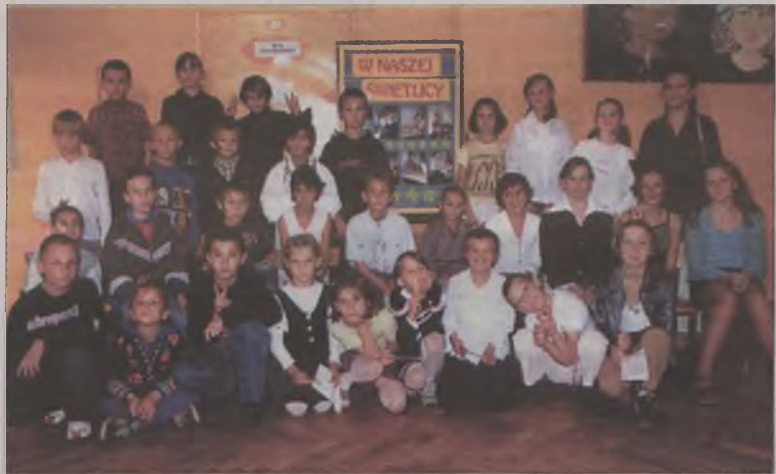
Uczestnicy zajęć świetlicowych w SP 1