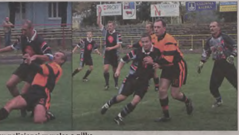
Turkowskie policjanci w walce o piłkę.

Oko policjanta Kolejnym punktem programu było oficjalne otwarcie centrum monitoringu. Kamery Turek obserwują od prawie dwóch lat, jednak teraz zmieniły się zasady funkcjonowa-