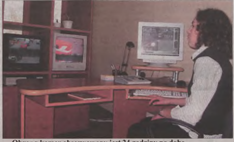
Obraz z kamer obserwowany jest 24 godziny na dobę.

Niegościnni gospodarze Wiele emocji wywołał towarzyski mecz tureckich funkcjonariuszy z kolegami z Komendy Powiatowej Policji w Kole. Nie wiadomo, czy to piskliwy doping pań z biur policyjnych, wsparcie kapitana drużyny - ks. Dereszewskiego, czy też nakaz komendanta powiatowego policji sprawiły, że nasi stróż prawa dosłownie śmigali po boisku, co chwilę strzelając przeciwnikom kolejną bramkę. Warto dodać, że policjanci z Turku grali w koszulkach firmowanych przez Caritas i Diecezję Włocławek. Ostatecznie mecz zakończył się wynikiem 9:1. Nic więc dziwnego, że kolanie zapowiedzieli rewanż. AZ