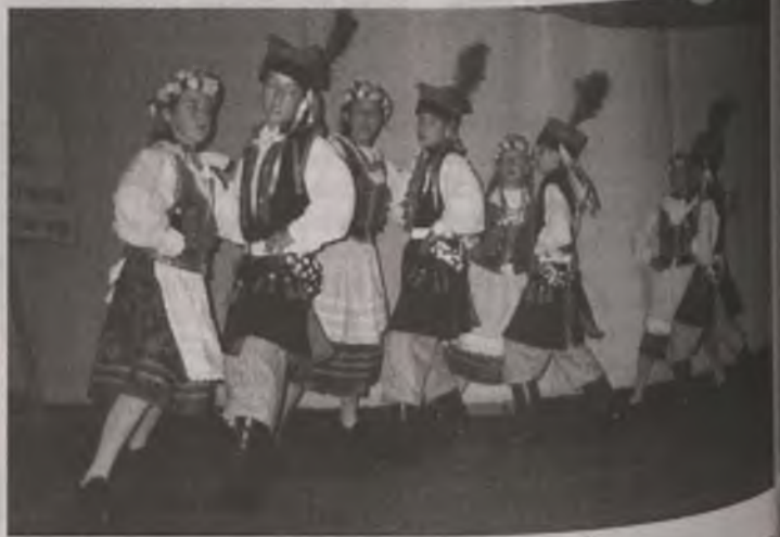
W przeglądzie wystąpili „krakowiacy” z Sarbic