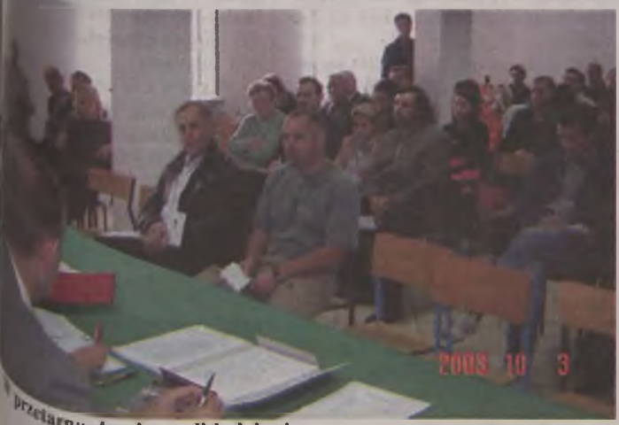
przetargu dominowali łodzianie

Jak łatwo można zostać oszukany przez obwoźnych handlarzy przekonali się rolnik z gminy Kawęczyn, który kupił fałszywe nawozy. Można przypuszczać, że podobnie oszukanych zostało wielu innych rolników z naszego powiatu.