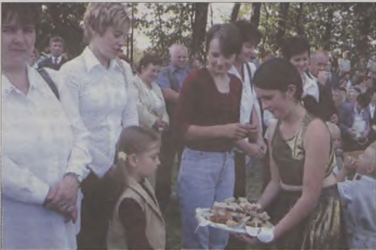
Częstowano świeżym chlebem

W części artystycznej wystąpiły zespoły: dziecięcy i seniorów, działające przy dobrskim Domu Kultury, lutłowy „Złoty Kłosa” z Wierzbinka oraz kapela podwórkowa „Konstantynowiaci”. (can)