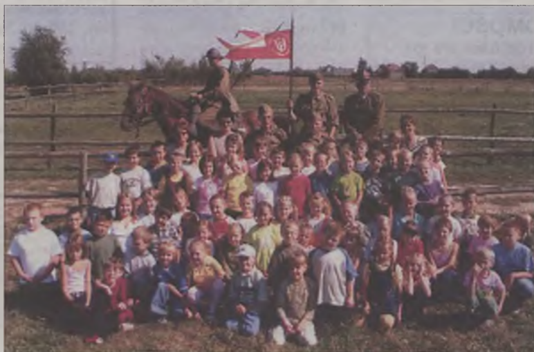
Ułani spotkali się uczniami SP 4

We wtorek szwadron wyruszył w dalszą drogę w kierunku na Uniejów. ika