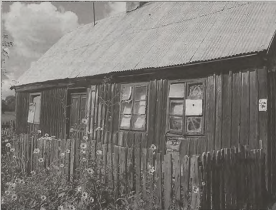
Trudno uwierzyć, że w chatce z numerem 17 w Małoszynie, ktoś jeszcze mieszka. A jednak.

-My nie musimy robić, a gmina musi nam dać - usłyszałem od nich,