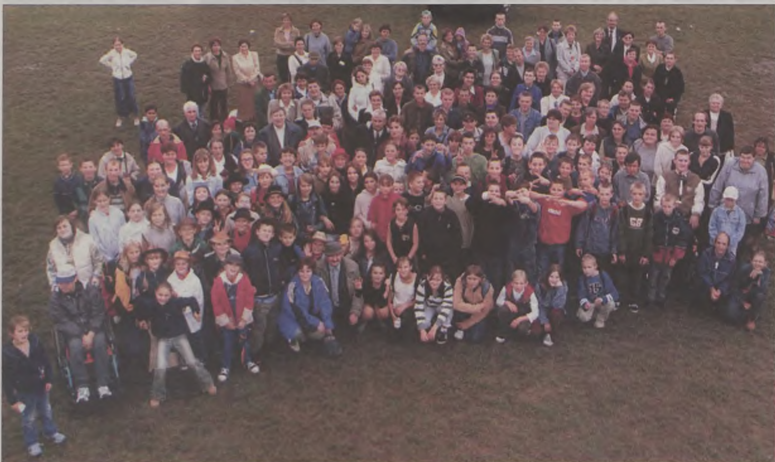
Na zbiorowym zdjęciu nie zmieściliby się wszyscy uczestnicy imprezy

Do sprawnego przebiegu imprezy przyczynili się także liczni wolontariusze z Centrum Ogólnokształcącego w Turku, którzy przez cały czas służyli osobom niepełnosprawnym wsparciem i pomocą.