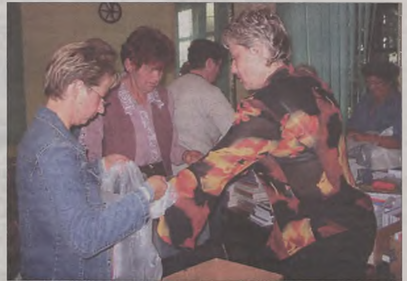
Przygotowywanie wyprawek dla około 200 dzieci

rum zorganizowało imprezę w parku pod nazwą „Dzień Europejska”. Dla uczestników zabawy przygotowano mnóstwo atrakcji, m.in. krzyżówkę europejską, konkursy plastyczny i piosenki oraz zabawy z nagrodami.