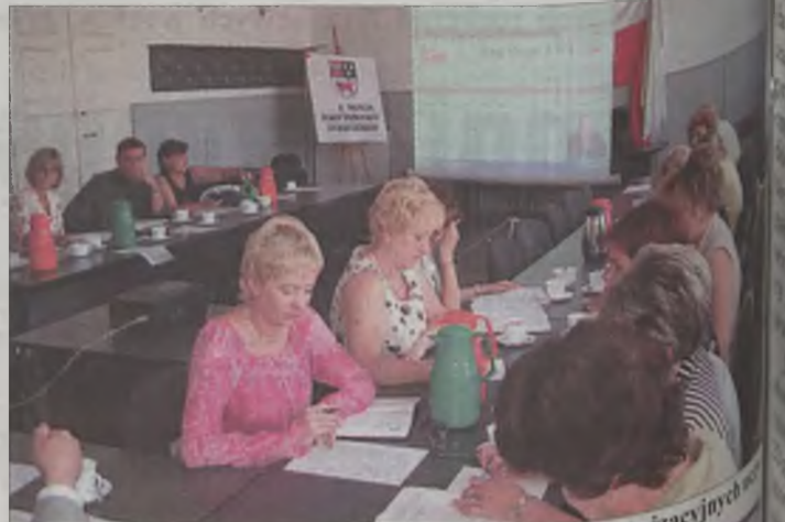
Dyrektorzy i kierownicy miejskich jednostek organizacyjnych wzięli udział w szkoleniu z obsługi BIP-u

Od 1 lipca działa internetowy Biuletyn Informacji Publicznej Urzędu Miejskiego w Turku, z którego internauci mogą dowiedzieć się nie tylko tego, kto rządzi miastem, ale również, jak załatwić sprawę w urzędzie.