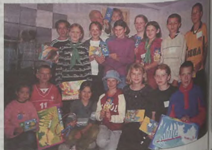
Laureaci kolonijnych konkursów

Policjant w ramach patronatu prowadził zajęcia o przeciwdziałaniu uzależnieniom i pogadanki z zakresu profilaktyki antyalkoholowej. Ponadto dzieciaki zwiedziły dolinę