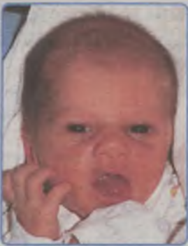
... RAŹNIEWSKI syn Lidii i Sławomira ur. 1 lipca 2003r, godz. 23.40 wazył 3100g, mierzył 53cm