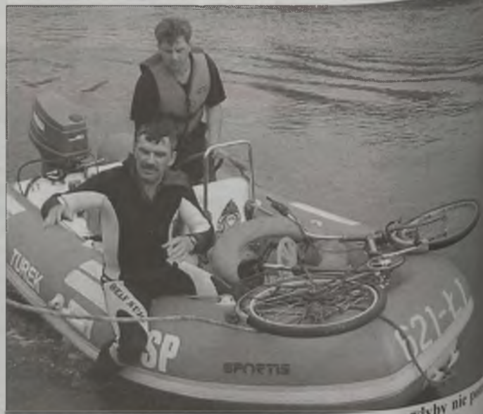
Znalezienie roweru i sierpa nie byłoby możliwe, gdyby nie policjanci i strażaków z PSP.

Tuż przy rzece sprawca znalazł miejsce, gdzie ukrył rower, którą przewiózł rower i ukrył go wśród wysepek powstałych w środku rzeki. Strażacy z pomocą specjalny ponton i wzięli z pomocą tamiami oraz podejrzewanym mężczyzną ruszyli na poszukiwania. Mężczyzna w kajmanach i oporów opowiadał o swym zachowaniu czyli nielegalnym powożeniu. Wskazał też miejsca ukrycia poszukiwanych rzeczy. Policjanci i strażacy najpierw wyjęli z roweru. Niedługo potem w turku