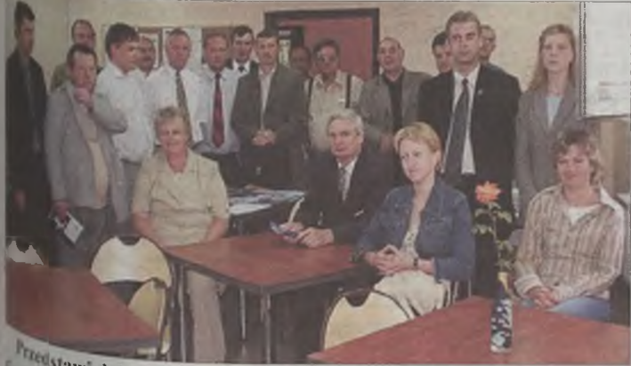
Przedstawiciele samorządów powiatu tureckiego w śmigielskim Centrum Informacji