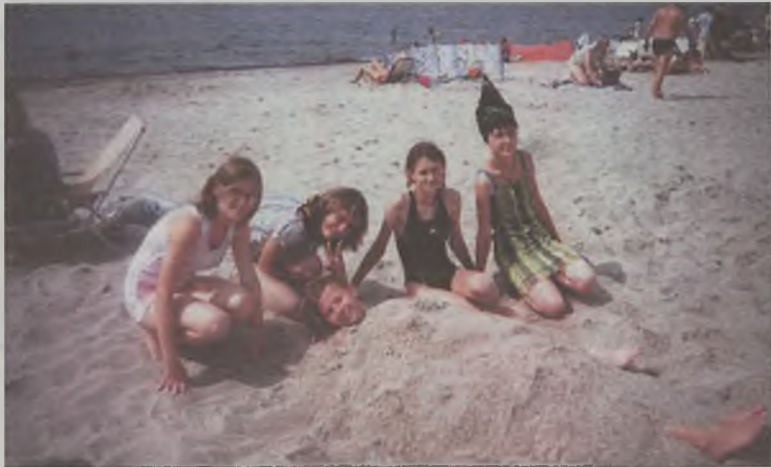
Zabawa na plaży

nie chcieli przede wszystkim wypocząć. Ciepłe dni spędzali na plaży kąpiąc się i opalając. Brali udział