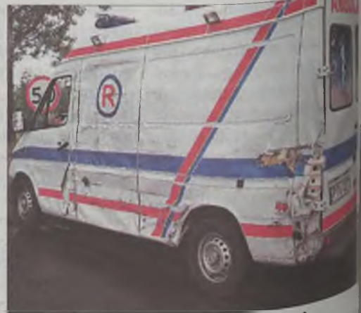
TIR staranował radiowóz i karetkę, które przyjechały na wezwanie do wypadku drogowego.

cała, odjeżdżając do szpitala z dwojgiem rannych, od strony Tuliszkowa nadjechał z dużą prędkością TIR. Kierowca Scani z naczą próbował manewrować pojazdem, by wyrzucić jak najmniej szkód. Nie udało się.