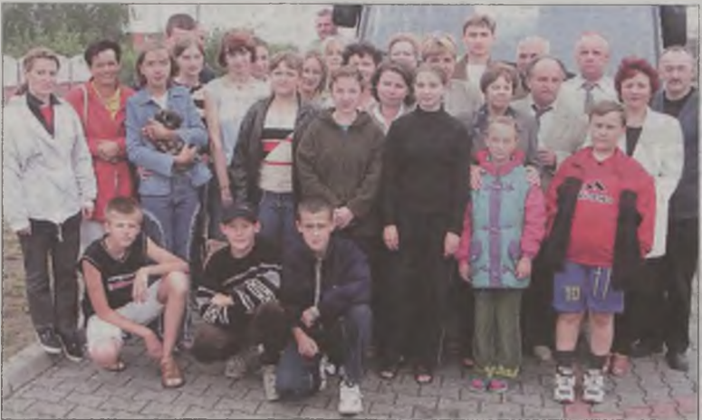
Grupa dzieci z Ukrainy wraz z opiekunami z Turku tuż przed odjazdem

rych młodzi dunajewczanie gościli – od 24 czerwca do 2 lipca. Wypoczynek naszych gości z Ukrainy został również wsparty pomocą finansową i organizacyjną władz miasta, powiatu i gminy Przykona. Całą inicjatywę z pełną życzliwością i szerokim gestem wsparło również kierownictwo KWB „Adamów” S.A. Nie sposób było też przy tym nie zauważyć osobistego, pełnego entuzjazmu zaangażowania w przedsięwzięcie