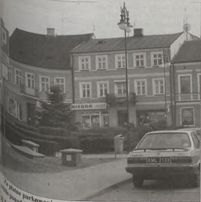
Za płatne parkowanie przez ostatnie dwa miesiące miasto Turek zarobiło ponad 11 tysięcy złotych.

Grupa wiekowa: 15-75 lat Wielkość próby: 385 110 (141 przypadków, 4,4% całej próby) Źródło: SMG/KRC Poland Media S.A. Data za okres: styczeń-marzec 2003 r.