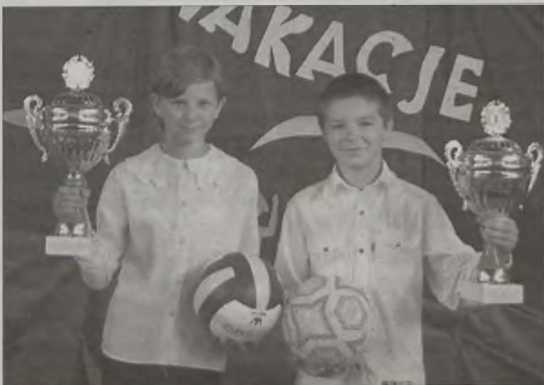
Najlepsi w rankingu