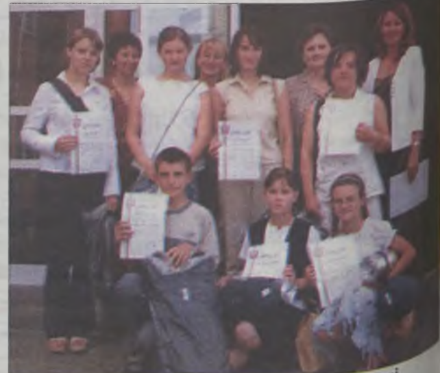
Laureaci z powiatu tureckiego wraz z opiekunami