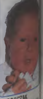
SOBOTZAK syn Elżbiety i ur. 19 czerwca wżył 3900g