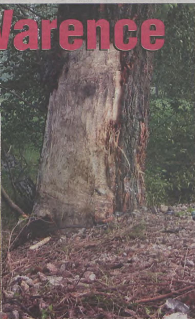
Siła uderzenia była tak duża, że samochód złamał się w połowie. Przód utkwil w drzewie, a tylna część spadła na ziemię kilka metrów dalej.