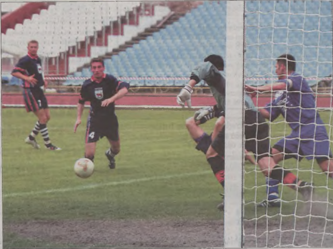
Fragment niedzielnego meczu Chemika/Zawiszy Bydgoszcz z Tur Turek

Nieco optymizmu (i co najważniejsze) 20 maja 2003 r.