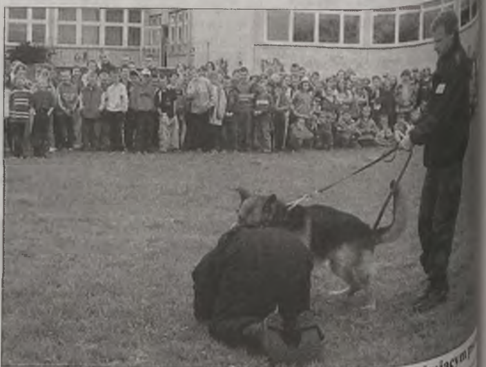
Policjanci pokazali dzieciom, jak uchronić się przed atakującym

Uczniowie w nagrodę za cierpliwość i uwagę, otrzymali przygotowaną przez policję niespodziankę, jaką był symboliczny pościg psa za uciekającą kulką.