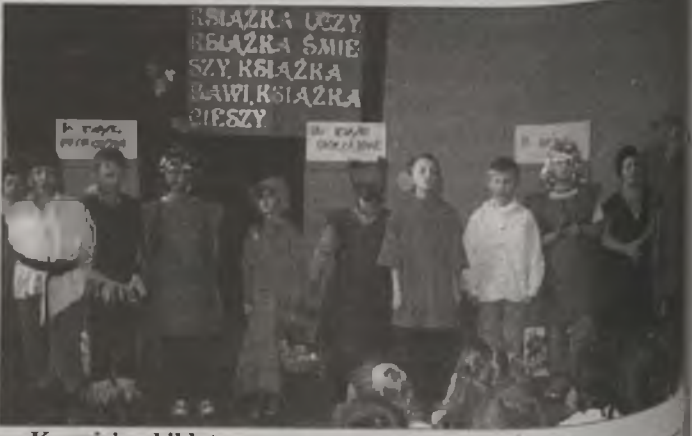
Kosmici w bibliotece