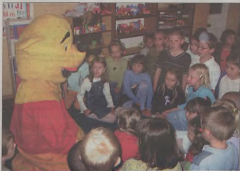
Zabawa z Kubusiem Puchatkiem