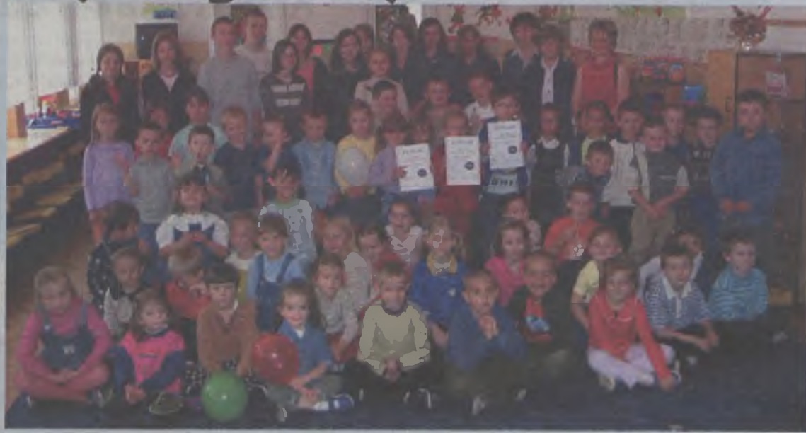
Przedzskolaki polubiły swych starszych kolegów z gimnazjum